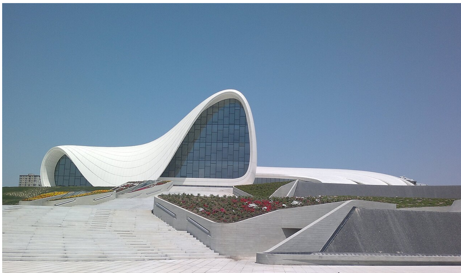
Heydar Aliyev Center (Μπακού, 2013)

Η τελευταία από τις Αρχές της Zaha Hadid, που ίσως συμπυκνώνει όλες τις υπόλοιπες, είναι η αποδόμηση . Ήδη από τις αρχές του 1980, άρχισε να εφαρμόζεται ένας άλλος σχεδιασμός, ο οποίος δεν πατούσε πλέον στις μορφές και τυπολογίες του Μεταμοντερνισμού, αλλά κινούνταν πιο άνετα μεταξύ της φαντασίας και της μορφής. Το νέο αυτό ρεύμα πήρε το όνομά του από την εμβληματική έκθεση Deconstructivism in Architecture του MoMA, που πραγματοποιήθηκε το 1988, ενώ το υπόβαθρό του βρίσκεται και στις σκέψεις του Jacques Derrida.