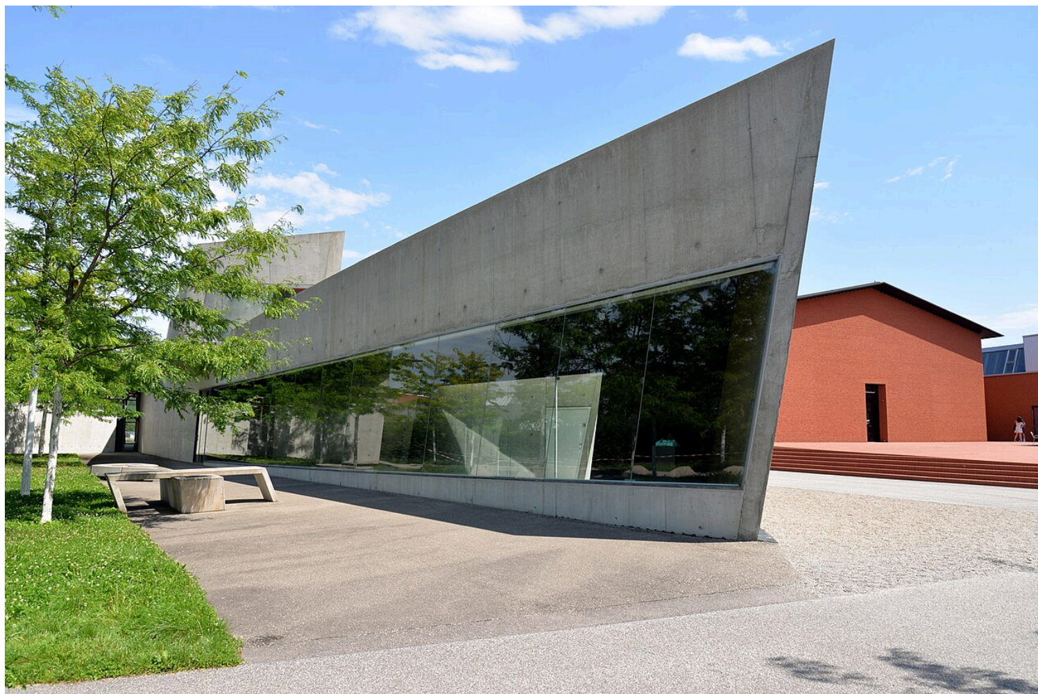
Bade-Wurtemberg Weil am Rhein Vitra Fire Station (1991-1993)

Το γεγονός, όμως, που βοήθησε στην καθιέρωση του ονόματός της και την ανάδειξη του ξεχωριστού της στυλ ήταν, όταν το 1988, επιλέχθηκε ως μία από τους επτά αρχιτέκτονες που παρουσιάστηκαν στην έκθεση Deconstructivism in Architecture υπό την επιμέλεια των Philip Johnson και Mark Wigley στο Μουσείο Μοντέρνας Τέχνης (MoMA) της Νέας Υόρκης. Επιστέγασμα των βραβείων και των διακρίσεων που έλαβε, ήταν η βράβευσή της με το Βραβείο Pritzker το 2004 για την καινοτομία και τη συνολική αποτύπωση του έργου της. Η βράβευση ήταν ορόσημο, καθώς η Hadid έγινε η πρώτη γυναίκα του θεσμού που τιμήθηκε, ενώ ήταν μία από τους νεότερους βραβευθέντες που έλαβαν το Pritzker, σε ηλικία 53 ετών.