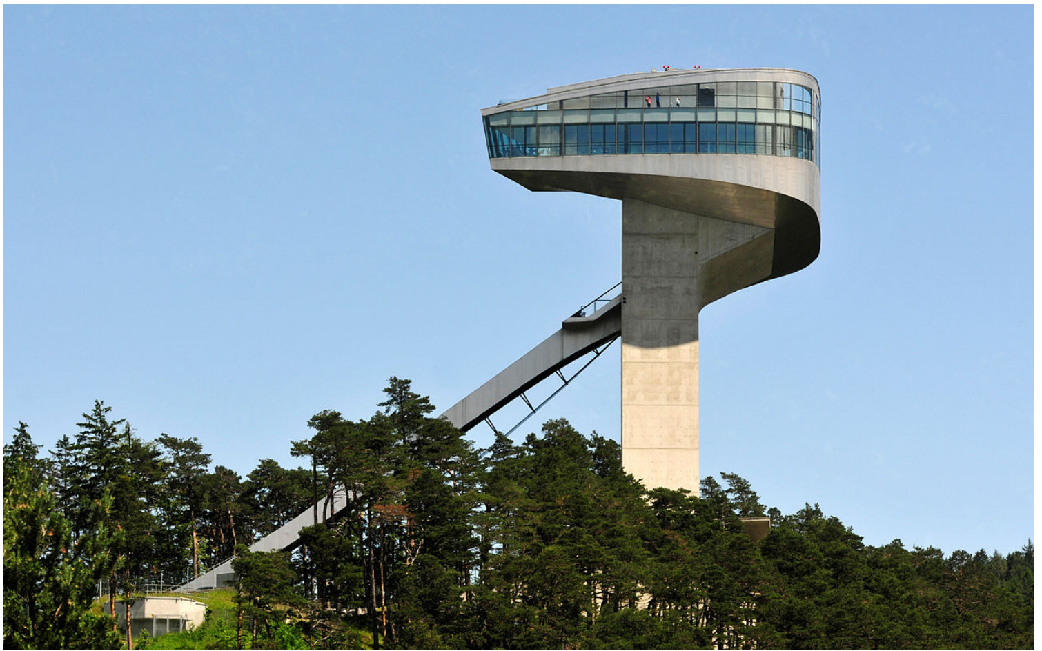
Bergisel Ski Jump (Innsbruck, Αυστρία, 2002)

Όλες οι αρχιτεκτονικές της συνθέσεις είναι ένας χείμαρρος κίνησης, ο οποίος γεφυρώνει όλες τις ετερόκλητες επιφάνειες και όγκους μέσω μιας αλληλουχίας αλληπάλληλων σημείων, ενώ οι έννοιες της στάσης και της κίνησης είναι ρέουσες. Ένα ακόμα στοιχείο της δουλειάς της είναι η συνεχής ροή , που σχετίζεται με την ομαλή λειτουργία των επιμέρους χώρων και στοιχείων των έργων της. Το θέμα της ροής, όμως, δεν συνδέεται μόνο με τη σύνθεση, αλλά και με την επαρκή παρουσία του αέρα, του φωτός και του νερού σε αυτά. Η Hadid, μέσω της εξερεύνησης των δυνατοτήτων της κίνησης και της ροής, προσπάθησε να «σπάσει» τα στατικά σχήματα και να τα ερμηνεύσει υπό ένα διαφορετικό πρίσμα.