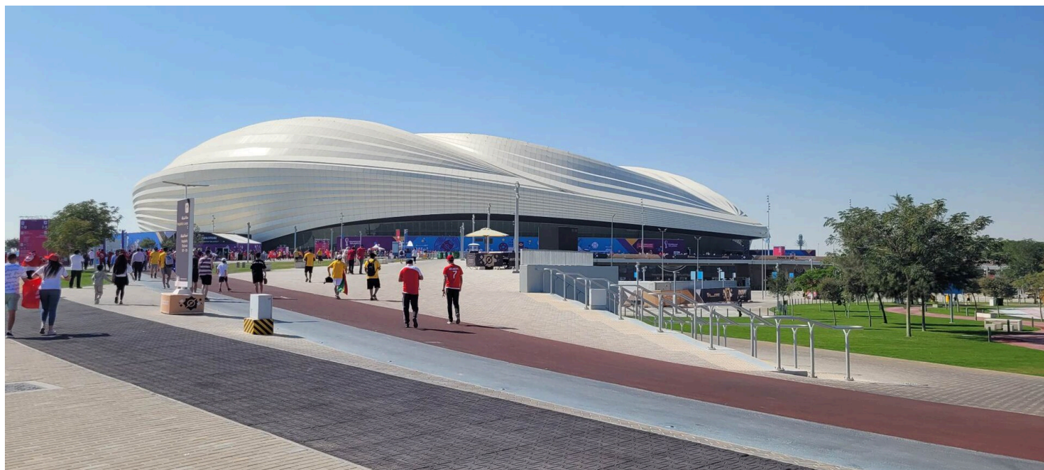
Al-Janoub stadium (Κατάρ, 2019)

Η τελευταία από τις Αρχές της Zaha Hadid, που ίσως συμπυκνώνει όλες τις υπόλοιπες, είναι η αποδόμηση . Ήδη από τις αρχές του 1980, άρχισε να εφαρμόζεται ένας άλλος σχεδιασμός, ο οποίος δεν πατούσε πλέον στις μορφές και τυπολογίες του Μεταμοντερνισμού, αλλά κινούνταν πιο άνετα μεταξύ της φαντασίας και της μορφής. Το νέο αυτό ρεύμα πήρε το όνομά του από την εμβληματική έκθεση Deconstructivism in Architecture του MoMA, που πραγματοποιήθηκε το 1988, ενώ το υπόβαθρό του βρίσκεται και στις σκέψεις του Jacques Derrida.