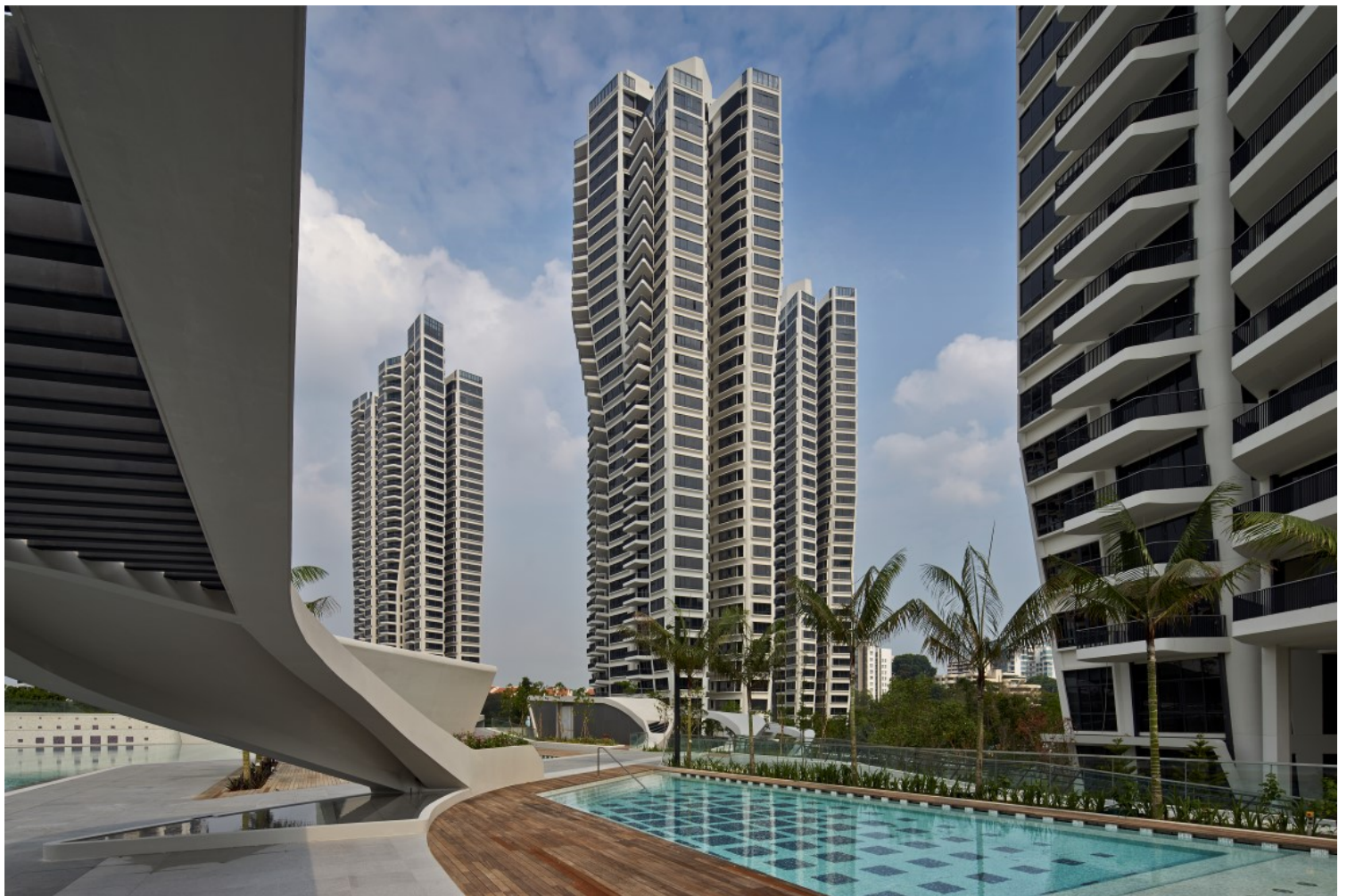
Οικιστικό συγκρότημα d' leedon (Σιγκαπούρη, 2014)