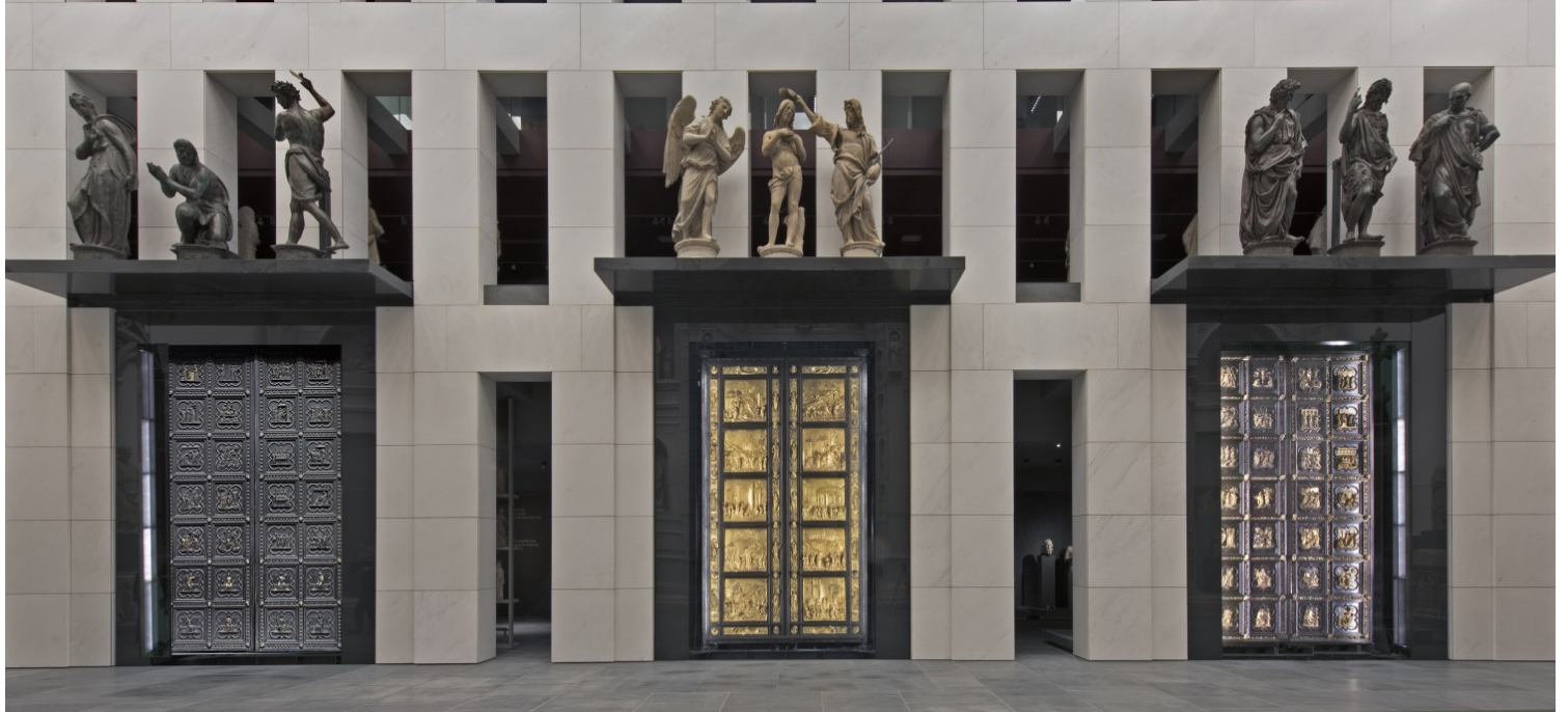
Η μεγάλη ισόγεια αίθουσα του Μουσείου του Καθεδρικού της Φλωρεντίας, με την τοποθέτηση των τριών αυθεντικών πυλών του Βαπτιστηρίου (Lorenzo Ghiberti και Andrea Pisano).