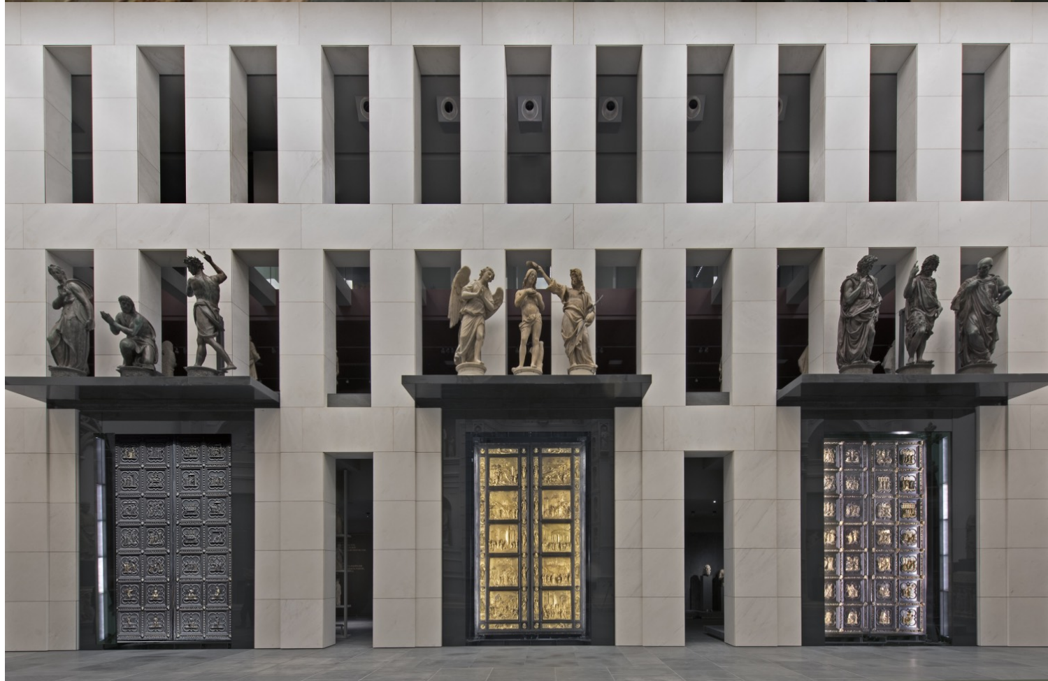
Η μεγάλη ισόγεια αίθουσα του Μουσείου του Καθεδρικού της Φλωρεντίας, με την τοποθέτηση των τριών αυθεντικών πυλών του Βαπτιστηρίου (Lorenzo Ghiberti και Andrea Pisano).