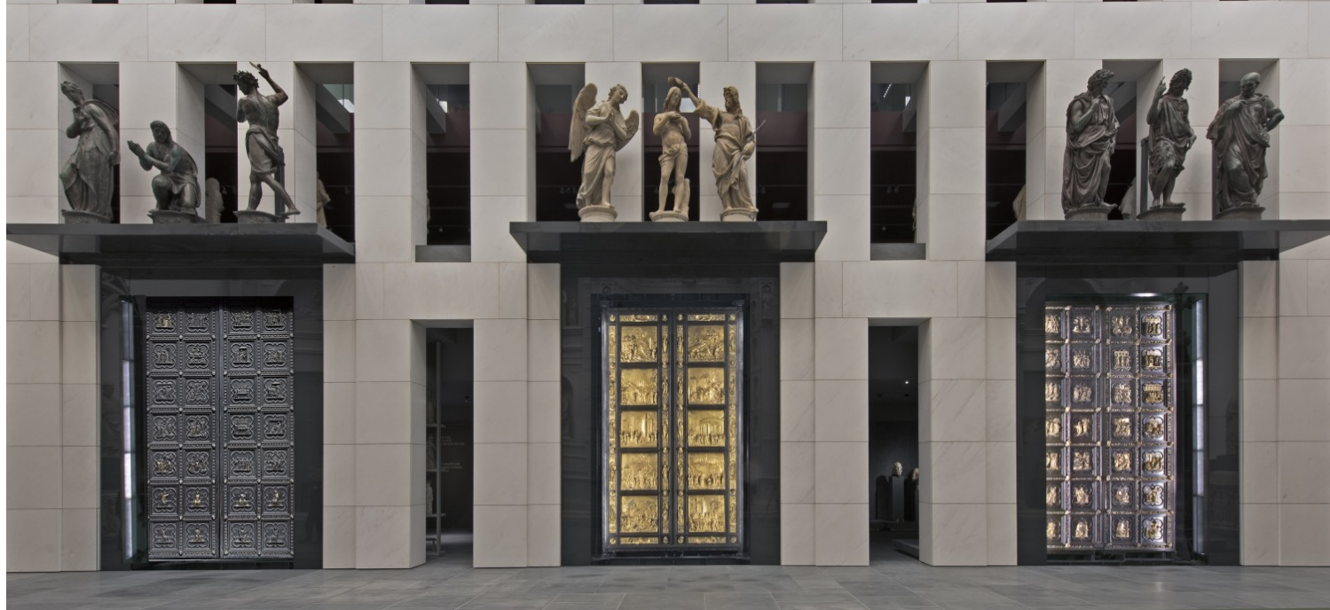
Η μεγάλη ισόγεια αίθουσα του Μουσείου του Καθεδρικού της Φλωρεντίας, με την τοποθέτηση των τριών αυθεντικών πυλών του Βαπτιστηρίου (Lorenzo Ghiberti και Andrea Pisano).