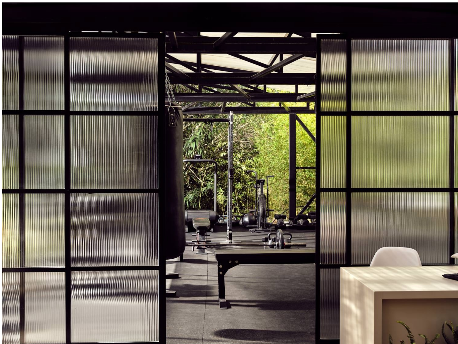
Agarch + Architects, Ekies, Βουρβουρού

Στον τομέα του επανασχεδιασμού και της ανακαίνισης, βρίσκουμε τη Μάιρα Ριδάκη , μια αρχιτέκτονα με χρόνια εμπειρία στον κλάδο. Με συνεργασίες όπως την εταιρεία COCO-MAT και εφαρμογές της πρακτικής της σε όλη την Ελλάδα, η Μάιρα αναδεικνύει τις γήινες και πολυχρηστικές επιλογές της στον κλάδο, δουλεύοντας σε διαφορετικής κλίμακας projects, από μεγάλα ξενοδοχεία μέχρι boutique residences. Μια ιδιαίτερα γλυκιά απόδοση της δουλειάς της αποτελεί το ξενοδοχείο Nature Boutique Hotel στο Μαίναλο, ένα συγκρότημα 12 δωματίων, όπου το interior έρχεται σε πλήρη εναρμόνιση με το ορεινό περιβάλλον. Απλότητα και φυσικότητα στις γραμμές και τις υφές υπόσχονται μια εμπειρία ασφάλειας και αποκέντρωσης κοντά στη φύση.