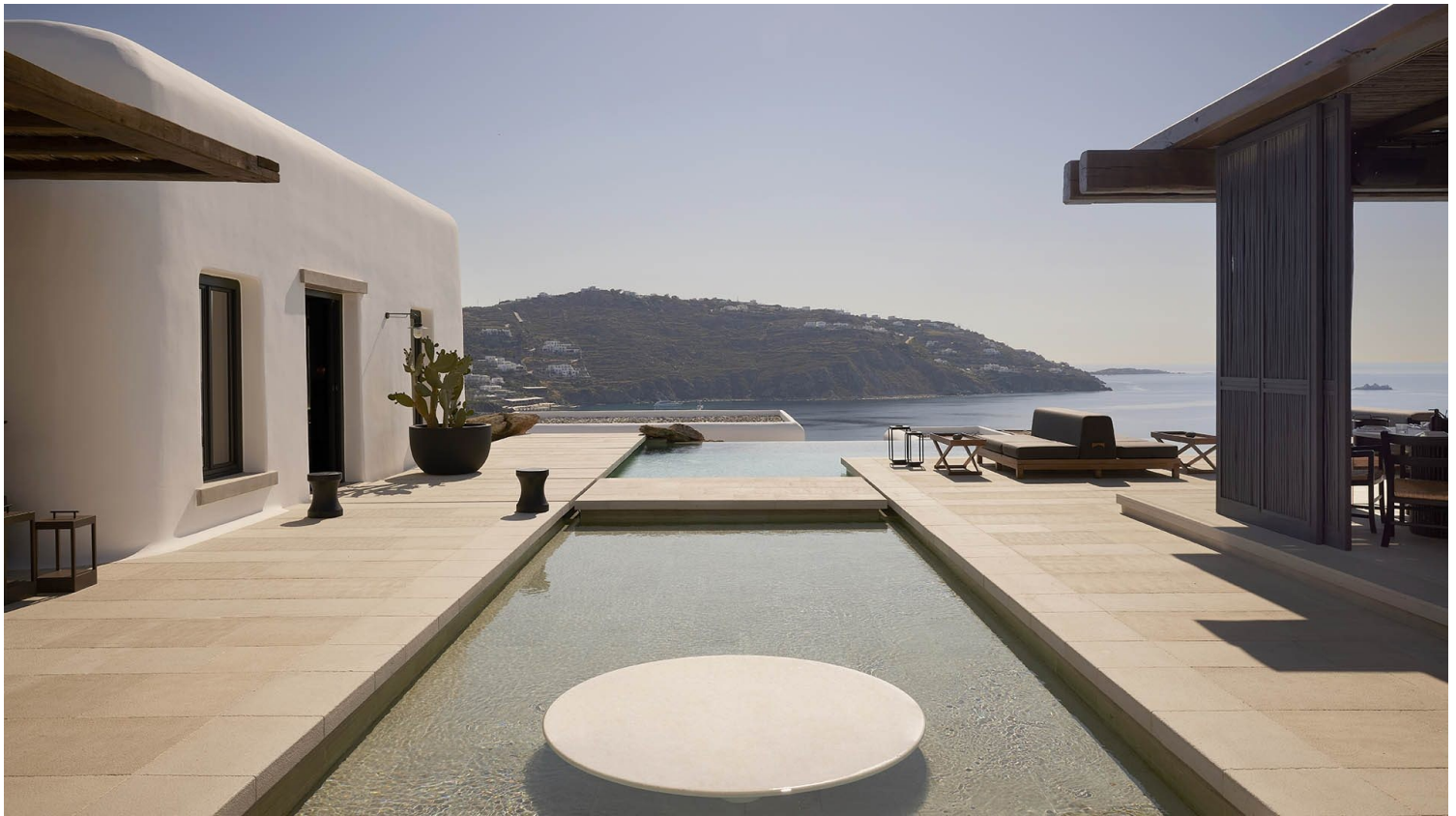
K-studio, Kalesma, Μύκονος

Οι K-studio , στο έργο τους Kalesma , ένα ξενοδοχειακό συγκρότημα στη Μύκονο, δημιουργούν μια αρχιτεκτονική που σέβεται το τοπίο και τον τόπο , χρησιμοποιούν υλικά φιλικά προς το περιβάλλον του νησιού, που δεν είναι ξένα με τον βióτοπο και παράλληλα δημιουργούν μια προέκταση στην αρχιτεκτονική εμπειρία του νησιού. Το νησί των ανέμων, με πλούσια αρχιτεκτονική ιστορία που έχει εκτιμηθεί και από τους μεταγενέστερους και που είναι σαφώς επηρεασμένη από την κοντινή Δήλο και τις κυκλαδίτικες χαράξεις, διατηρεί τα λιθόστρωτα, τις κυκλικές καμάρες και το λευκό χρώμα στην αρχιτεκτονική του. Το Kalesma επιτυγχάνει να επικοινωνήσει αυτή την ιστορία μέσα από τις χαράξεις του, τις γήινες υλικότητές του, τα ανάγλυφα πλακόστρωτα και τις ξύλινες πέργκολές του, και έτσι γίνεται ένα με το κυκλαδίτικο τοπίο της Μυκόνου. Τα εσωτερικά συνεχίζουν την αφήγηση, σε ήρεμες και γήινες αποχρώσεις, με λινά υφάσματα και ψάθα. Οι K-studio δημιουργούν ένα περιβάλλον φιλόξενο και οικείο, το οποίο στην ήσυχη πολυτέλειά του δεν μιμείται καμία άλλη αρχιτεκτονική πρόταση, μόνο το λιτό περιβάλλον του Αιγαίου.