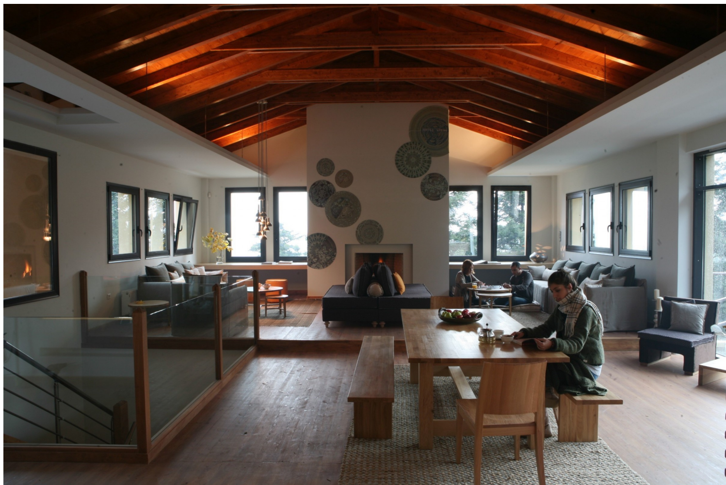
Μάιρα Ριδάκη, Nature Boutique Hotel, Μαίναλο

Ιδιαίτερο σχεδιασμό που μπλέκει με το φυσικό τοπίο προτείνουν οι Urban Soul Project , με το έργο Yoma Suites στη Ζάκυνθο. Το ξενοδοχείο απαρτίζεται από δέκα υπόσκαφες σουίτες στο άγριο ζακυνθινό περιβάλλον. Το φυσικό φως επιτρέπεται σε όλους τους χώρους κάθε βίλας, μέσω φωταγωγών. Η παλέτα υλικών βασίζεται σε γήινους τόνους, αμμώδη χρώματα, φινιρίσματα από ξύλο βελανιδιάς, ελαφριά υφάσματα και φλεβώδη μάρμαρα. Στους εσωτερικούς χώρους έχουν επιλεγθεί ιδιαίτερα αντικείμενα και έπιπλα με αναφορές από τη σύγχρονη ελληνική τέχνη και κεραμική, σε ένα πάντρεμα με τον βιομηχανικό σχεδιασμό που ανάγει τη συνολική αισθητική των χώρων σε μια καθ' όλα επίκαιρη σχεδίαση!