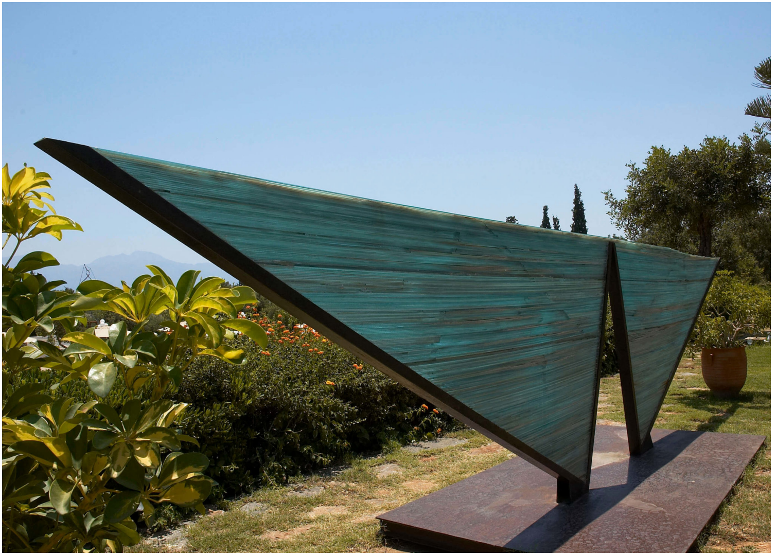
«Self-defined Horizon», Costas Varotsos, 2nd Art Symposium (1990), Sculpture Garden, Minos Beach art hotel