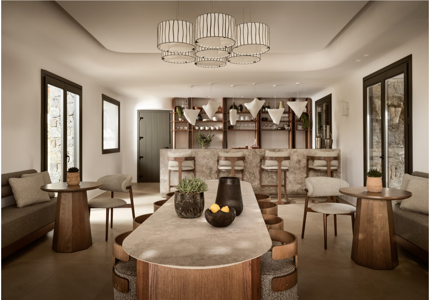
Anemelia Mykonos, A&M Architects and Evripiotis Architects

αρχιτεκτονική του τόπου αποτέλεσε κύριο στόχο για τον σχεδιασμό, με τη χρήση των υλικών να προέρχεται κατεξοχήν από τις Κυκλάδες. Πέτρα και υπόλευκες τοιχοποιίες πρωταγωνιστούν στον χώρο παραπέμποντας στα ασβεστωμένα σοκάκια της χώρας του νησιού, ενώ οι ξύλινες πέργκολες μαζί με τους τόνους και τις υφές των υφασμάτων φέρνουν στο μυαλό αποχρώσεις της αμμουδιάς. Το έργο επιμελούνται οι A&M Architects στον σχεδιασμό των interiors και το detailed design και οι Evripiotis Architects στην αρχιτεκτονική μελέτη.