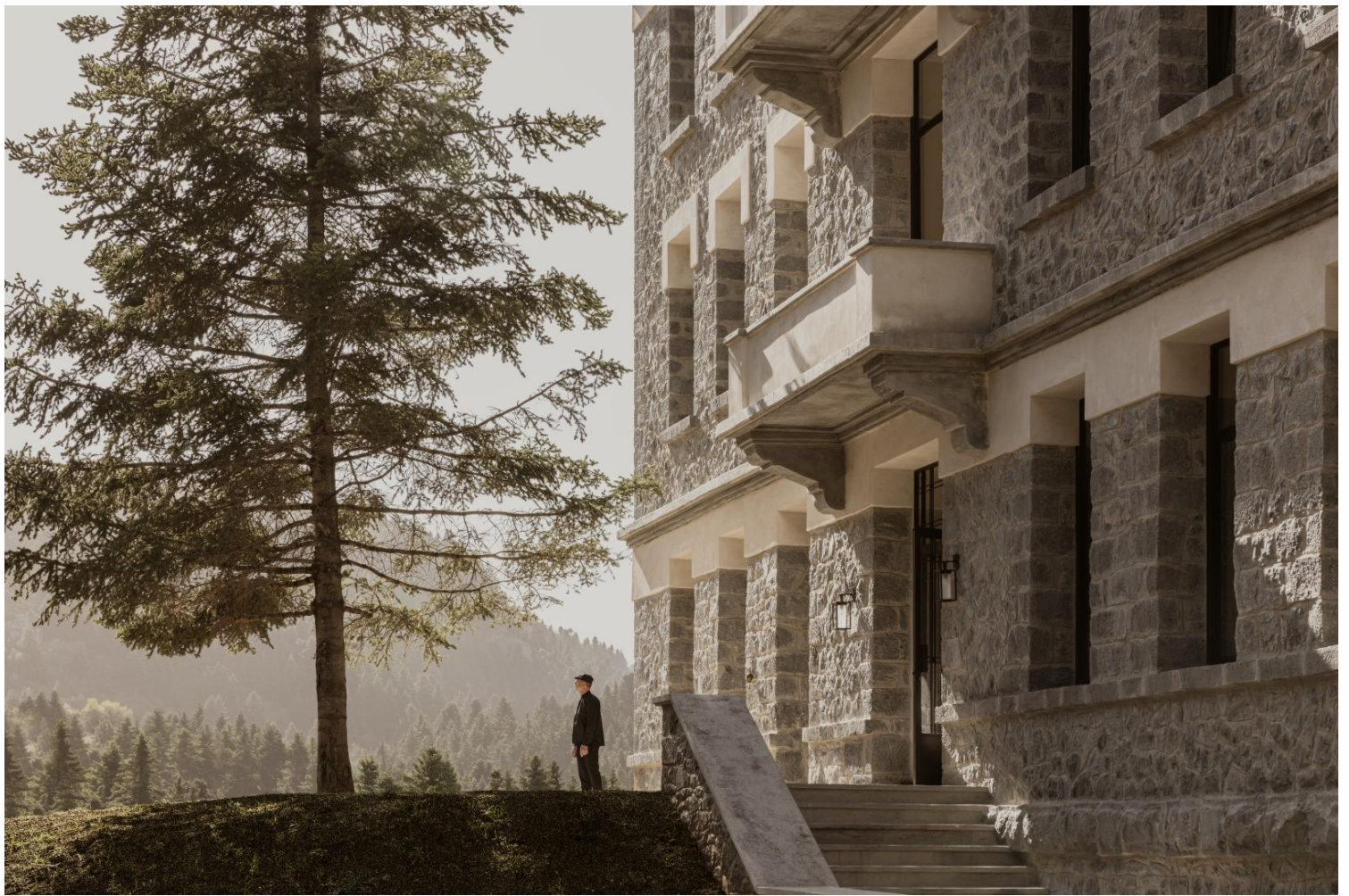
Manna, Arcadia, Greece, K-STUDIO, MONOGON

Τέλος, μια πρόταση ανάμεσα στο ονειρικό και το φανταστικό, με αλληγορίες από τα βάθη της θάλασσας, με πρακτικές αρχιτεκτονικής που η Ελλάδα σιγά σιγά τώρα γνωρίζει. Το ξενοδοχείο The Whale από τους 314 Architecture Studio είναι μια αρχιτεκτονική πρόταση στα πλαίσια του ξενοδοχειακού σχεδιασμού, που μάλλον ορίζει μια νέα εποχή στον κλάδο. Με αναφορές από τις γεωμετρίες της θάλασσας και των πλασμάτων που ζουν σε αυτή, το The Whale υπόσχεται να ανανεώσει το αρχιτεκτονικό τοπίο της Μυκόνου σε πλήρη συνομιλία με το φυσικό του περιβάλλον. Η ιδιαίτερη επεξεργασία της γεωμετρίας τού κελύφους στους ημιυπαίθριους χώρους ενθάρρυνε τη διαρκή συνομιλία του κτιρίου με το φως και τη σκιά, ενώ παράλληλα δημιουργήθηκαν κάδρα θέασης του φυσικού τοπίου. Στο εσωτερικό του κτιρίου, κανείς συναντά διαφορετικές ποιότητες και υλικότητες χώρων. Ο σμιλεμένος εσωτερικός όγκος θυμίζει ολόκληρα κομμάτια λευκού βράχου, τα οποία φαίνεται να έχουν δεχθεί επεξεργασία και μέσω της αφαίρεσης έχουν μετατραπεί σε χώρους. Στους κοινόχρηστους χώρους του ξενοδοχείου, μεγάλες επιφάνειες επενδύονται με καθρέπτη, δημιουργώντας σημειακά ένα ιδιαίτερο παιχνίδι οφθαλμαπάτης με τον θεατή.