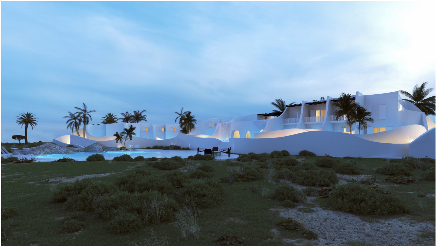
The Whale, Mykonos, 314 Architecture Studio