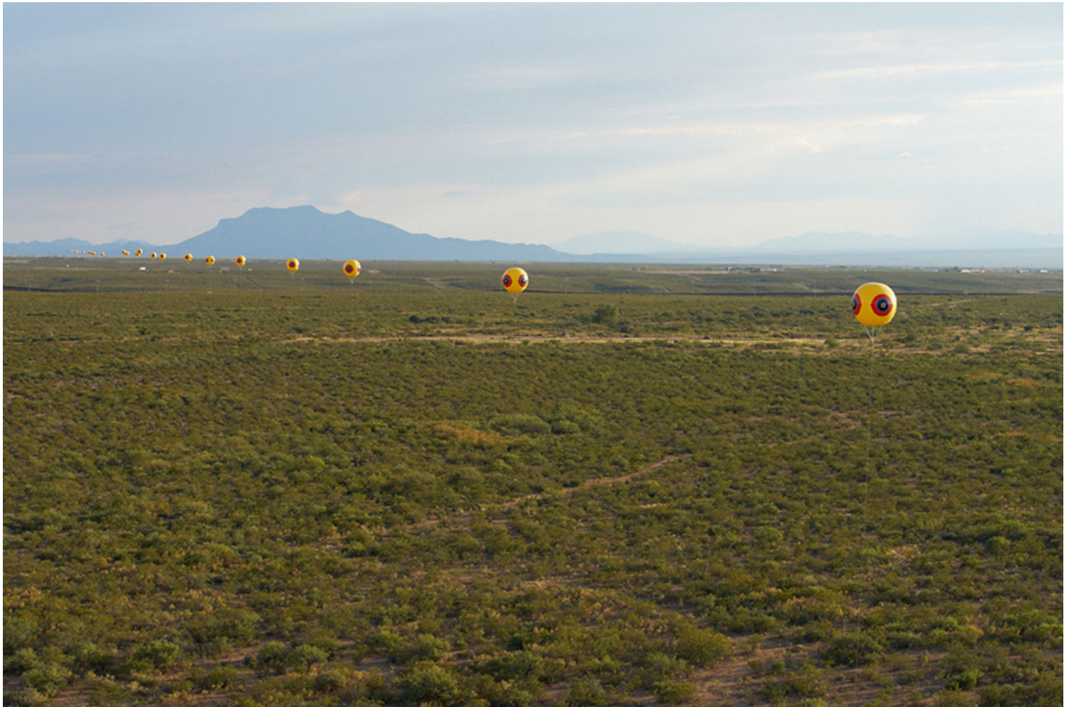
(Εικ.4) Postcommodity, Repellent Fence, 2015.

Η έρευνα θεωρείται σε μεγάλο βαθμό ως «παραγωγική» εργασία στα πλαίσια της ακαδημαϊκής κοινότητας, ενώ η διδασκαλία γίνεται αντιληπτή σαν μια δευτερεύουσα μορφή αναπαραγωγικής εργασίας. Η διδασκαλία κωδικοποιείται από τον καπιταλισμό ως απλά αναπαραγωγική, θηλυκοποιημένη και δευτερευούσας σημασίας σε σχέση με τις υποτιθέμενες πρωταρχικές μορφές παραγωγής της γνώσης. Θεωρούμε αυτό το δίπολο βαθιά εμπεδωμένο στις ακόμα πατριαρχικές επικερδείς δομές της ακαδημίας οι οποίες ορίζουν τις θέσεις όλων μας· το μάθημα Contested Spaces ασκεί κριτική και επιχειρεί να ανατρέψει αυτή τη θεώρηση. Κατά τη γνώμη μας, η εκπαίδευση της νέας γενιάς ερευνητριών, διανοητών και πολιτών αποτελεί μια μορφή παραγωγής γνώσης ισότιμης με και φυσική απόρροια της έρευνάς μας. Ελπίζουμε ότι η αυξημένη επίγνωση την οποία αποκόμίζουν οι φοιτητριές μας από την παρακολούθηση του μαθήματός μας θα τις ωθήσει να παρέμβουν και να αγωνιστούν για πιο δίκαιους χώρους στους κόσμους τους. Ο κανόνας είναι ουσιαστικό, αλλά το διεκδικείν είναι ρήμα και πράξη.