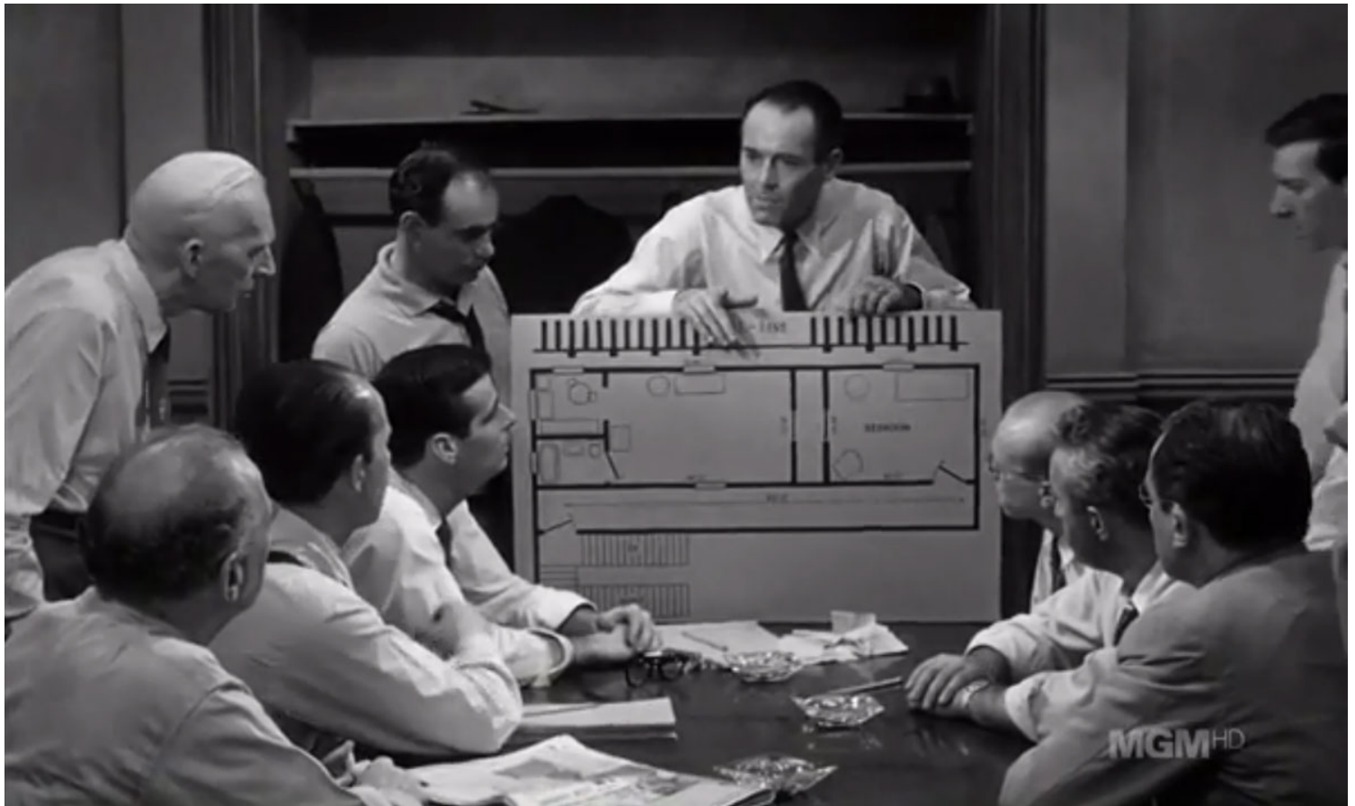
Εικ.5. 12 Angry Men. Σκηνοθεσία: Sidney Lumet, 1957. Απόσπασμα φιλμ.

Είναι εφικτή η αναζήτηση της δημόσιας αλήθειας σε έναν κόσμο που κυριαρχούν οι μύθοι και οι πλαστές ειδήσεις; Μήπως έχουμε αφήσει οριστικά πίσω μας την εποχή εκείνη κατά την οποία υπήρχε ακόμη η ξεκάθαρη αίσθηση της ειλικρινώς αναμεταδιδόμενης αλήθειας; 8