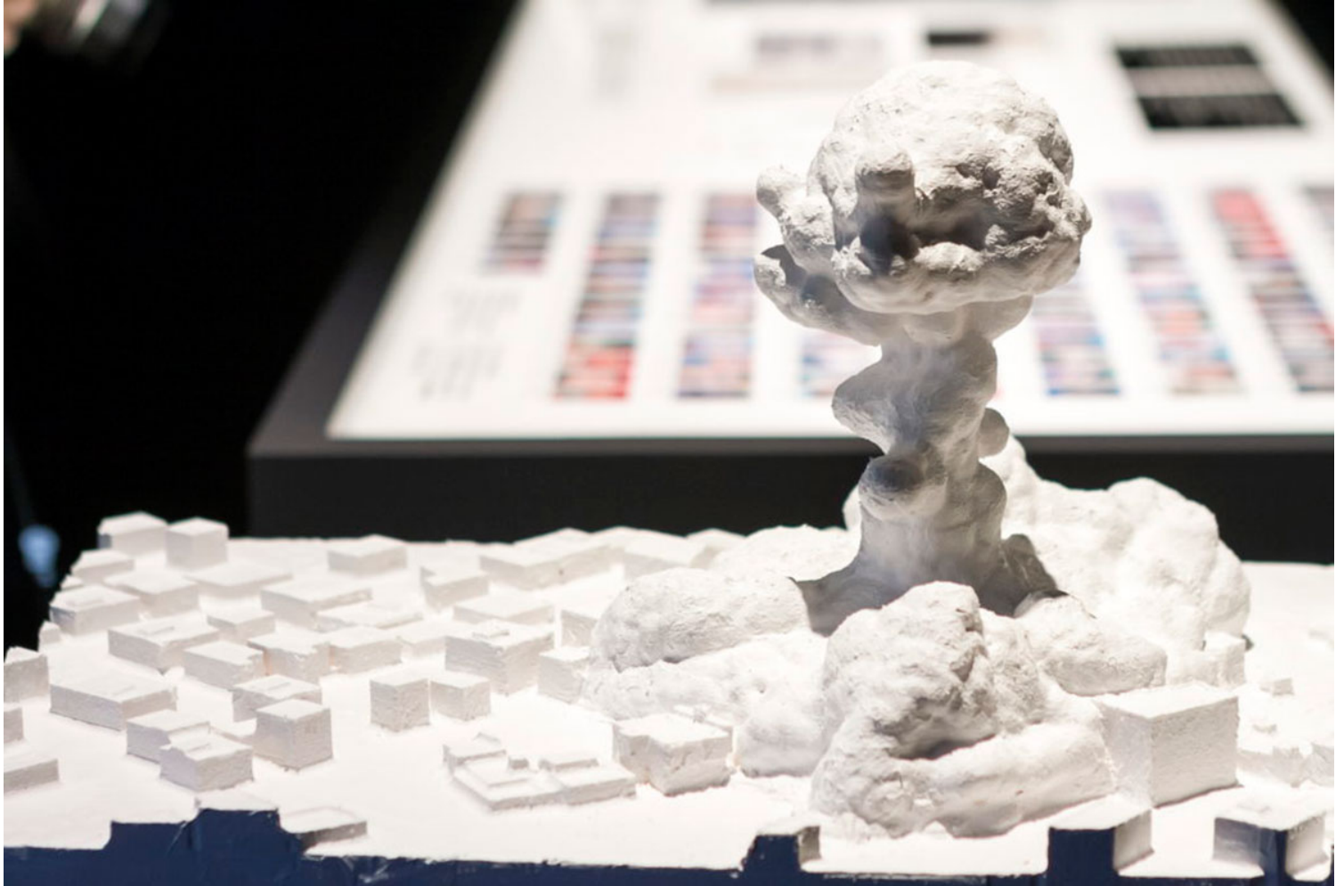
Εικ.4. Forensic Architecture, Μακέτα νέφους βόμβας. © TOKYO PHOTOGRAPHIC ART MUSEUM and OSHIMA Kenichiro. Πηγή: forensic-architecture.org.

Ποια είναι η ιδιαίτερη αισθητική των ψηφιακών εικόνων και δεδομένων που αντιμετωπίζουμε καθημερινά στα δίκτυα και αξιοποιούν στα έργα τους οι Forensic Architecture;