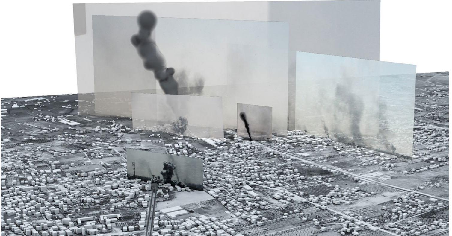
Εικ.3. Forensic Architecture, Rafah: Black Friday. Απόσπασμα video.

Πως όμως είναι δυνατόν μια εγκληματολογική έρευνα, η οποία μάλιστα διεξάγεται από αρχιτέκτονες, να αποτελεί αντικείμενο κορυφαίας διάκρισης εικαστικών τεχνών;