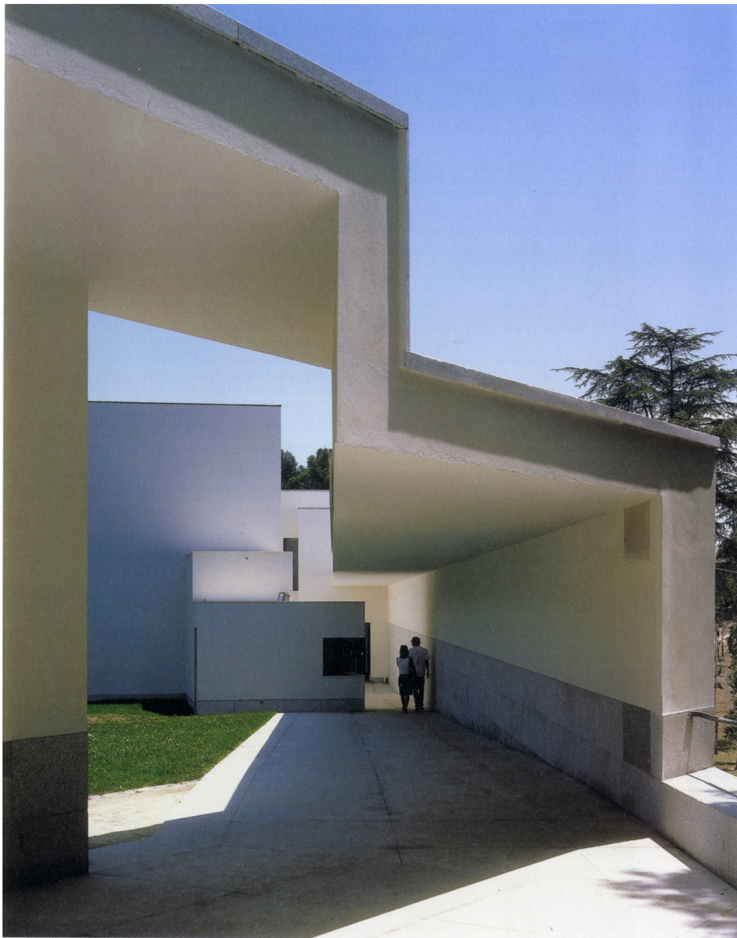
Alvaro Siza μουσείο Seralves-κατώφλι

Μ.Ο: Η Αθήνα διαθέτει έναν μεγάλο αριθμό κτιρίων, κυρίως γραφείων, τα οποία βρίσκουν ξανά τη θέση τους στην πόλη. Μετατρέπονται, πολλές φορές μέσα σε μια νύχτα, σε ξενοδοχεία, με σημαντικές αλλαγές στην κάτοψη και την όψη τους αλλάζοντας την ίδια στιγμή και την εικόνα της πόλης. Ποια είναι η άποψη σας για αυτήν την εφήμερη αρχιτεκτονική; Μήπως χάνεται η ευκαιρία να διαβάσουμε στην πόλη μας τα αστικά