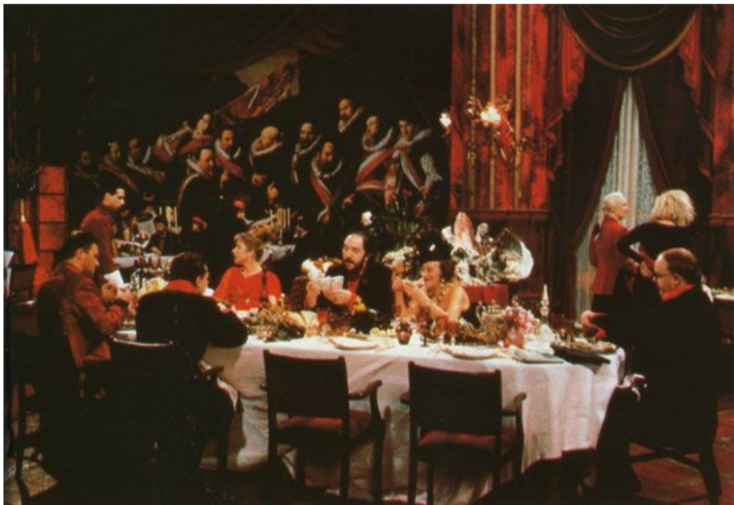
Ο μάγειρας, ο κλέφτης, η γυναίκα του και ο εραστής της, Peter Greenaway, 1989.

Μ.Ο: Κλείνοντας αυτήν την πολύ ενδιαφέρουσα κουβέντα, θα ήθελα να σας πω ότι απόλαυσα, όπως είμαι σίγουρος και πολλοί άλλοι, το κεφάλαιο “Τελετουργίες” και την αναφορά σας στον σκηνοθέτη Peter Greenaway. Ποιους άλλους σκηνοθέτες, ξένους και Έλληνες, ξεχωρίζετε για την αρχιτεκτονική τους κινηματογραφική ματιά;