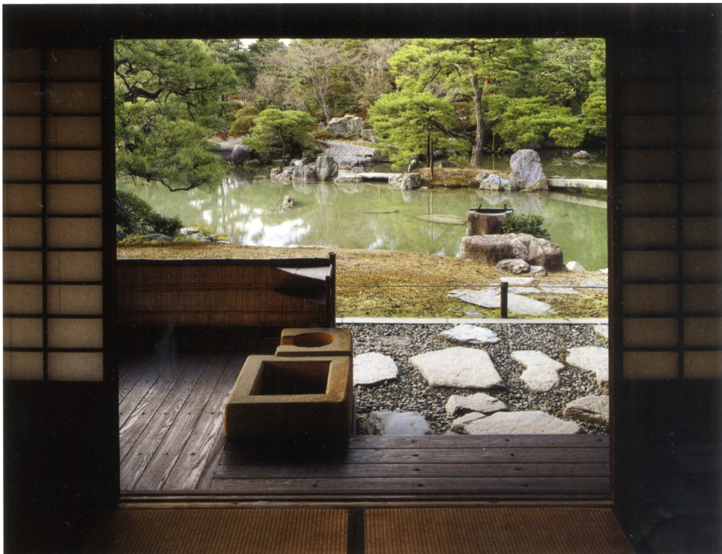
Βίλα katsura_θέα στους κήπους από το δωμάτιο του τσαγιού

Μ.Ο: Σε ένα τέτοιο μη ευνοϊκό περιβάλλον, αντιθέτως, προκηρύσσεται πληθώρα αρχιτεκτονικών διαγωνισμών και παράγεται αξιόλογο αρχιτεκτονικό έργο, που μένει όμως στα συρτάρια των αρχιτεκτόνων. Πώς πιστεύετε ότι μπορεί να αντιμετωπιστεί αυτό το παράδοξο;