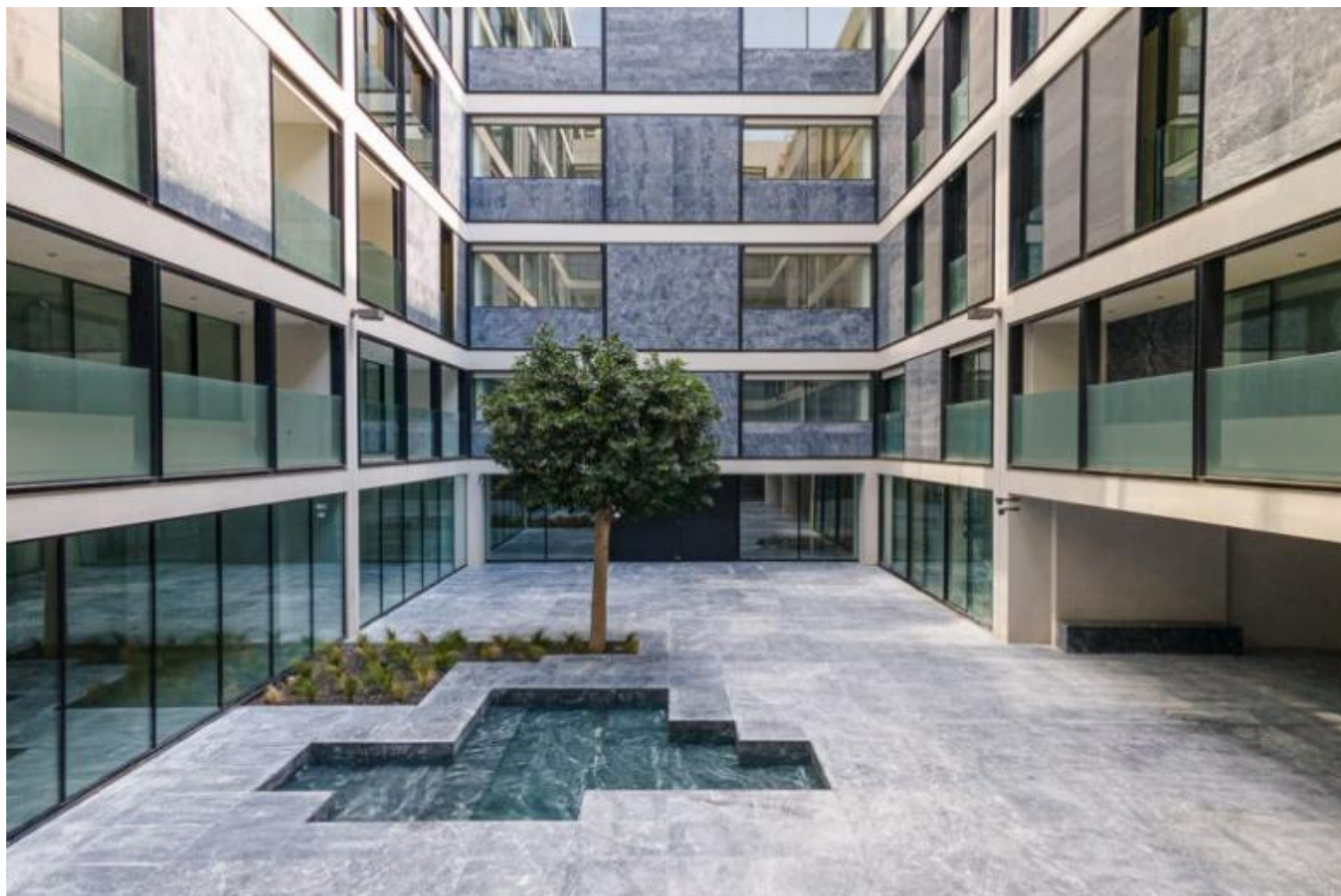
One Athens, Σχολή Δοξιάδη, αρχιτέκτονας Κωνσταντίνος Δοξιάδης, Λυκαβηττός, Αθήνα

Κατευθυνόμενοι προς το υδάτινο μέτωπο της Αττικής, δε θα μπορούσαμε να παραλείψουμε το Κέντρο Πολιτισμού Ίδρυμα Σταύρος Νιάρχος , ένα από τα πιο σημαντικά έργα σύγχρονης αρχιτεκτονικής της πόλης. Σχεδιασμένο από το αρχιτεκτονικό γραφείο Renzo Piano Building Workshop , το Κέντρο Πολιτισμού Ίδρυμα Σταύρος Νιάρχος φιλοξενεί στις λειτουργίες του την Εθνική Βιβλιοθήκη της Ελλάδας και την Εθνική Λυρική Σκηνή . Μαζί με ένα πλήθος προαύλιων χώρων, ο κτιριακός όγκος επιδέχεται το τοπογραφικό δημιουργώντας ένα ελαιόδασος με κλήση 5>#/span###, που αναδύεται από τον κήπο του κτιρίου μέχρι την οροφή. Πολεοδομικά, ενώνει τον αστικό ιστό με το παράκτιο μέτωπο του Φαλήρου μέσω μιας επιμήκους γέφυρας και λειτουργεί ως δημόσιος/ημιδημόσιος χώρος, αναβαθμίζοντας το βιοτικό επίπεδο της περιοχής και της πόλης.