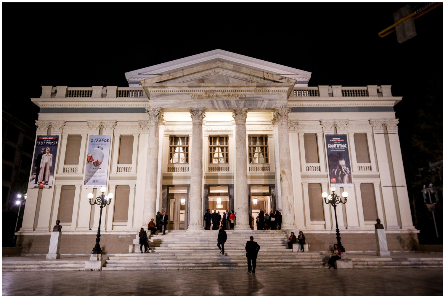
Δημοτικό Θέατρο Πειραιά

Συνεχίζοντας στις γειτονιές του Πειραιά, συναντάμε τον πρώην βιομηχανικό χώρο των Λιπασμάτων της Δραπετσώνας. Μετά το 1880, η Ηετιώνεια Ακτή και οι γειτονικοί όρμοι της Δραπετσώνας -Σφαγείων και Φωρών- μετατρέπονται στην παραθαλάσσια βιομηχανική ζώνη του Πειραιά. Το 1909 ιδρύεται η Ανώνυμη Ελληνική Εταιρεία Χημικών Προϊόντων και Λιπασμάτων . Η Εταιρεία είχε ως σκοπό την παραγωγή και εμπορία οξέων, λιπασμάτων και εν γένει χημικών προϊόντων. 90 χρόνια αργότερα, μετά από ένα πλήθος μεταρρυθμίσεων και πολιτικών αναταράξεων, η εταιρεία χρεοκοπεί και τα βιομηχανικά κελύφη -σε σύνολο 109- μένουν ανενεργά. Το βιομηχανικό συγκρότημα εμπεριείχε, ανάμεσα σε άλλα, έναν Εργατικό Οικισμό, τον Υδατόπυργο, μονάδα ενέργειας, το Υαλουργείο και το Ινστιτούτο Χημείας. Σήμερα το βιομηχανικό συγκρότημα αποτελεί δημόσιο πάρκο, τον " Πολυχώρο Λιπασμάτων ", με χώρους άθλησης και ψυχαγωγίας, προσβάσιμο από όλους τους πολίτες.