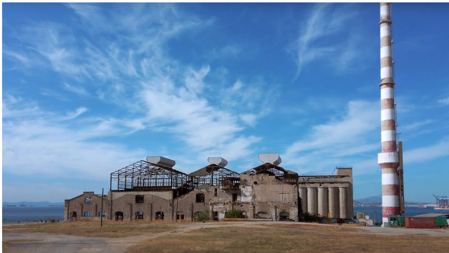
Πολυχώρος Λιπασμάτων, Δραπετσώνα