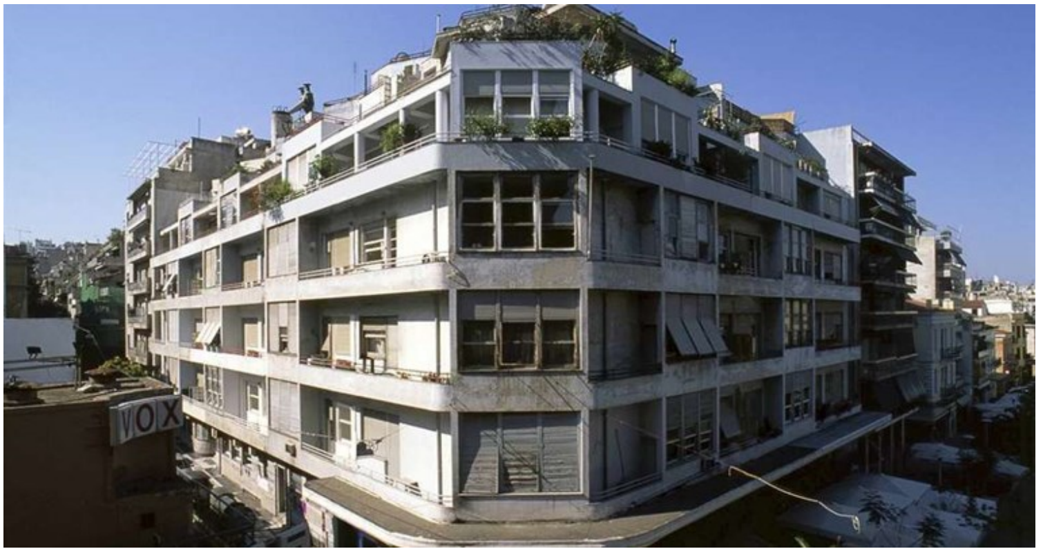
Μπλε Πολυκατοικία, αρχιτέκτονας Κυριάκος Παναγιωτάκος, Εξάρχεια, Αθήνα

Ανεβαίνοντας στους πρόποδες του Λυκαβηττού συναντάμε την τότε σχολή Δοξιάδη , που σήμερα είναι συγκρότημα υπερπολυτελών κατοικιών με το όνομα One Athens . Ο αρχιτέκτονας και πολεοδόμος Κωνσταντίνος Δοξιάδης , κατά τη δεκαετία του 1950, ψάχνει να στεγάσει τα γραφεία του και τη σχολή Δοξιάδη και διαλέγει μια από τις πιο προνομιούχες θέσεις στην πόλη, αυτή του Λυκαβηττού με θέα μέχρι το παράκτιο νοτιοανατολικό μέτωπο της Αττικής. Το κτήριο αποτελούνταν από τέσσερις όγκους που αναπτύσσονταν γύρω από ένα αίθριο, πυρήνα του συγκροτήματος μέχρι και σήμερα. Η σχολή Δοξιάδη αποτέλεσε την πρώτη σχολή σχεδιασμού στη χώρα και τον χώρο όπου εγκαταστάθηκε ο πρώτος ηλεκτρονικός υπολογιστής. Γύρω από το αίθριο ο Δοξιάδης δημιούργησε μια κοινότητα από δημιουργικά άτομα, καλλιτέχνες, σχεδιαστές, αρχιτέκτονες κ.α. Το κτίριο αποτελεί ένα από τα πιο σημαντικά δείγματα μεταπολεμικής αρχιτεκτονικής στη χώρα.