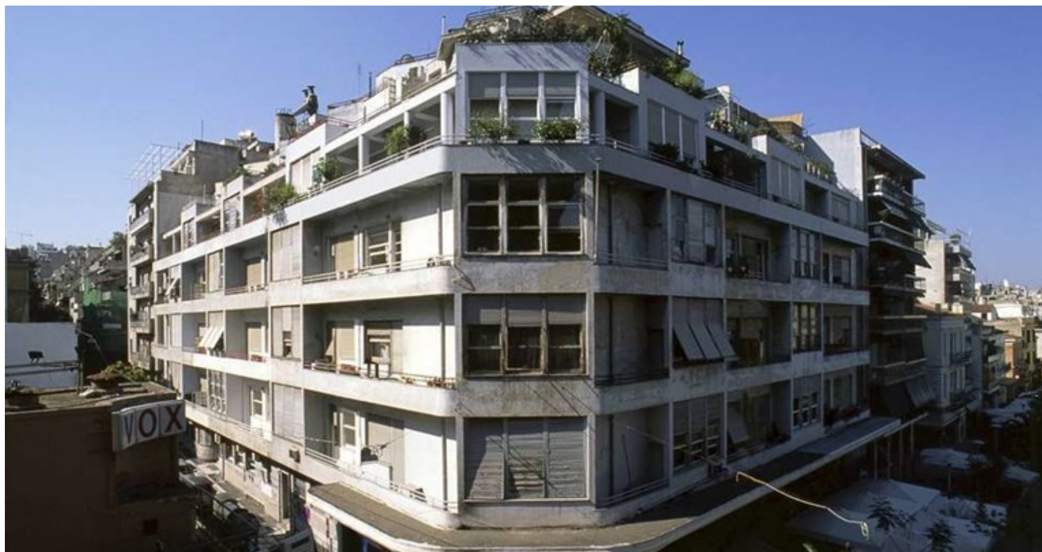
Μπλε Πολυκατοικία, αρχιτέκτονας Κυριάκος Παναγιωτάκος, Εξάρχεια, Αθήνα

Ανεβαίνοντας στους πρόποδες του Λυκαβηττού συναντάμε την τότε σχολή Δοξιάδη , που σήμερα είναι συγκρότημα υπερπολυτελών κατοικιών με το όνομα One Athens . Ο αρχιτέκτονας και πολεοδόμος Κωνσταντίνος Δοξιάδης , κατά τη δεκαετία του 1950, ψάχνει να στεγάσει τα γραφεία του και τη σχολή Δοξιάδη και διαλέγει μια από τις πιο προνομιούχες θέσεις στην πόλη, αυτή του Λυκαβηττού με θέα μέχρι το παράκτιο νοτιοανατολικό μέτωπο της Αττικής. Το κτήριο αποτελούνταν από τέσσερις όγκους που αναπτύσσονταν γύρω από ένα αίθριο, πυρήνα του συγκροτήματος μέχρι και σήμερα. Η σχολή Δοξιάδη αποτέλεσε την πρώτη σχολή σχεδιασμού στη χώρα και τον χώρο όπου εγκαταστάθηκε ο πρώτος ηλεκτρονικός υπολογιστής. Γύρω από το αίθριο ο Δοξιάδης δημιούργησε μια κοινότητα από δημιουργικά άτομα, καλλιτέχνες, σχεδιαστές, αρχιτέκτονες κ.α. Το κτίριο αποτελεί ένα από τα πιο σημαντικά δείγματα μεταπολεμικής αρχιτεκτονικής στη χώρα.