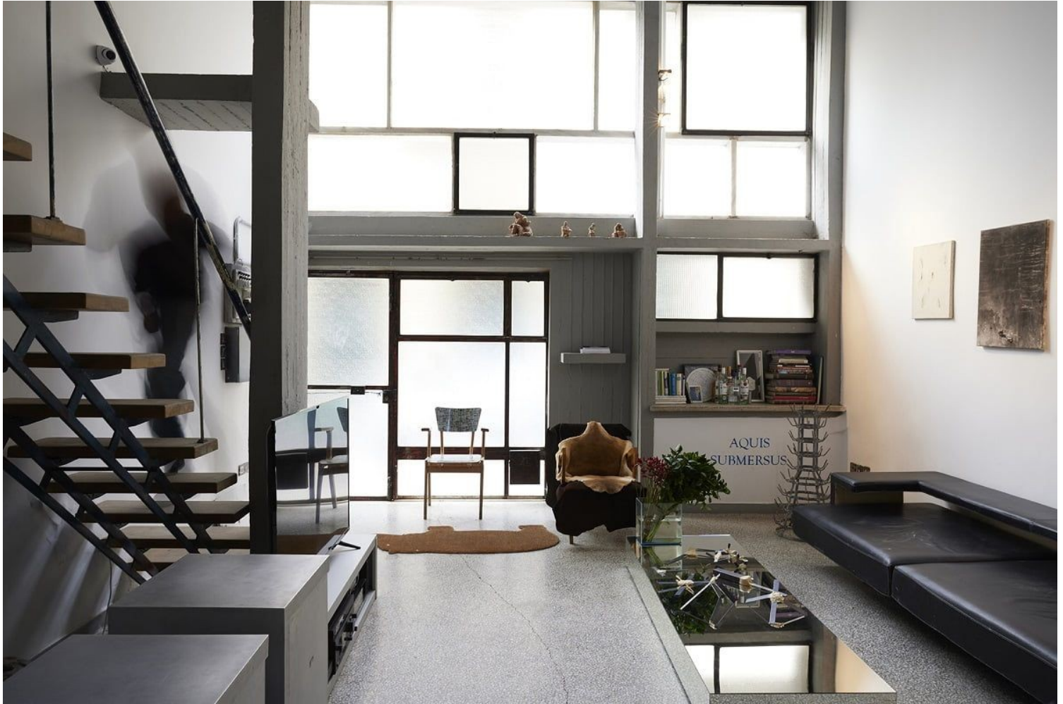
Ατελιέ Σπητέρη, Αριστομένης Προβελέγγιος

Επί της οδού Κυκλάδων, βρίσκουμε ένα από τα πιο εξέχοντα δείγματα μοντέρνας αρχιτεκτονικής, το ατελιέ της Ιωάννας Σπητέρη . Δίπλα σε εμβληματικά κτίρια, το οικοδόμημα αντάξια αποτελεί τοπόσημο για την περιοχή και παραμένει διαχρονικά ένα δείγμα έξυπνου χειρισμού και αρχιτεκτονικής μέριμνας. Η μακρόστενη όψη αναπτύσσεται σε τρία τμήματα, δημιουργώντας έναν κάναβο χρήσεων αλλά και ζωής. Οι διακοπτόμενες τζαμαρίες δημιουργούν μια αμφίδρομη σχέση οικειότητας με τη γειτονιά. Το παιχνίδι κλίμακας μεταφέρεται και στην κάτοψη, όπου διαφαίνονται 2 βασικοί όροφοι, ένα πατάρι και ένα δώμα. Ο Προβελέγγιος επιλέγει να κάνει τη σύνδεση με μια σκάλα ελαφριάς κατασκευής από μέταλλο και ξύλο, η οποία στον τελευταίο όροφο γίνεται διακοπτόμενη, παρέχοντας ιδιωτικότητα αλλά και την ευελιξία μετατροπής του χώρου. Τα υλικά που έχουν επιλεγεί κρατούν αυστηρές μοντερνιστικές γραμμές ανάμεσα σε εμφανές μπετόν, μέταλλο και ξύλο , γεγονός το οποίο στη συγκεκριμένη περίπτωση αναδεικνύει τα γήινης υλικότητας και ζωηρού χαρακτήρα γλυπτά της Ιωάννας Σπητέρη.