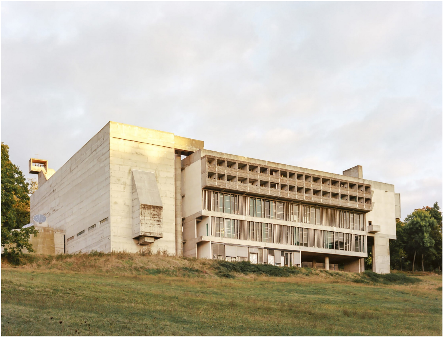
La Tourette