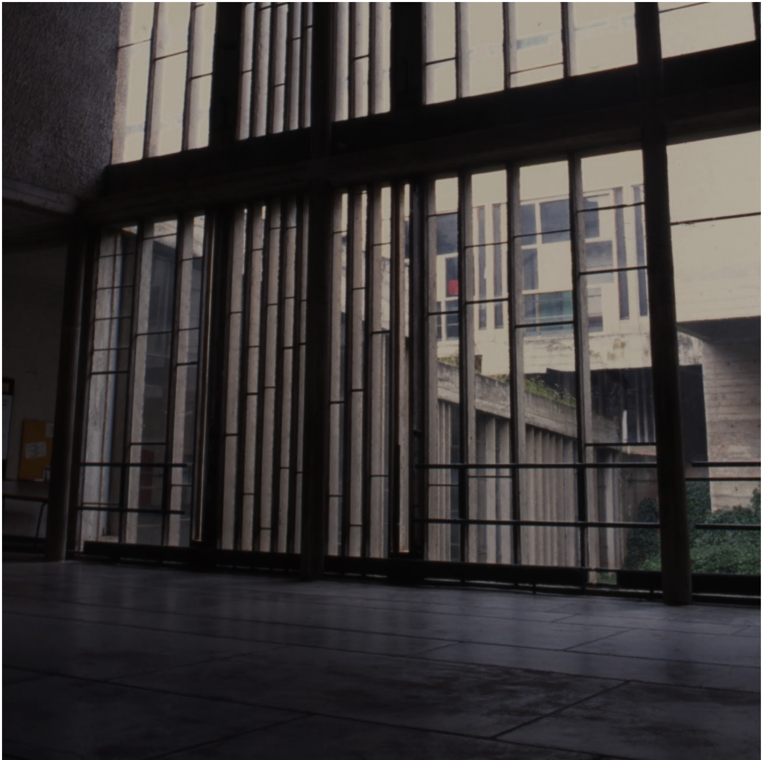
La Touretter Xenakis | justinnicholsarchitects.com