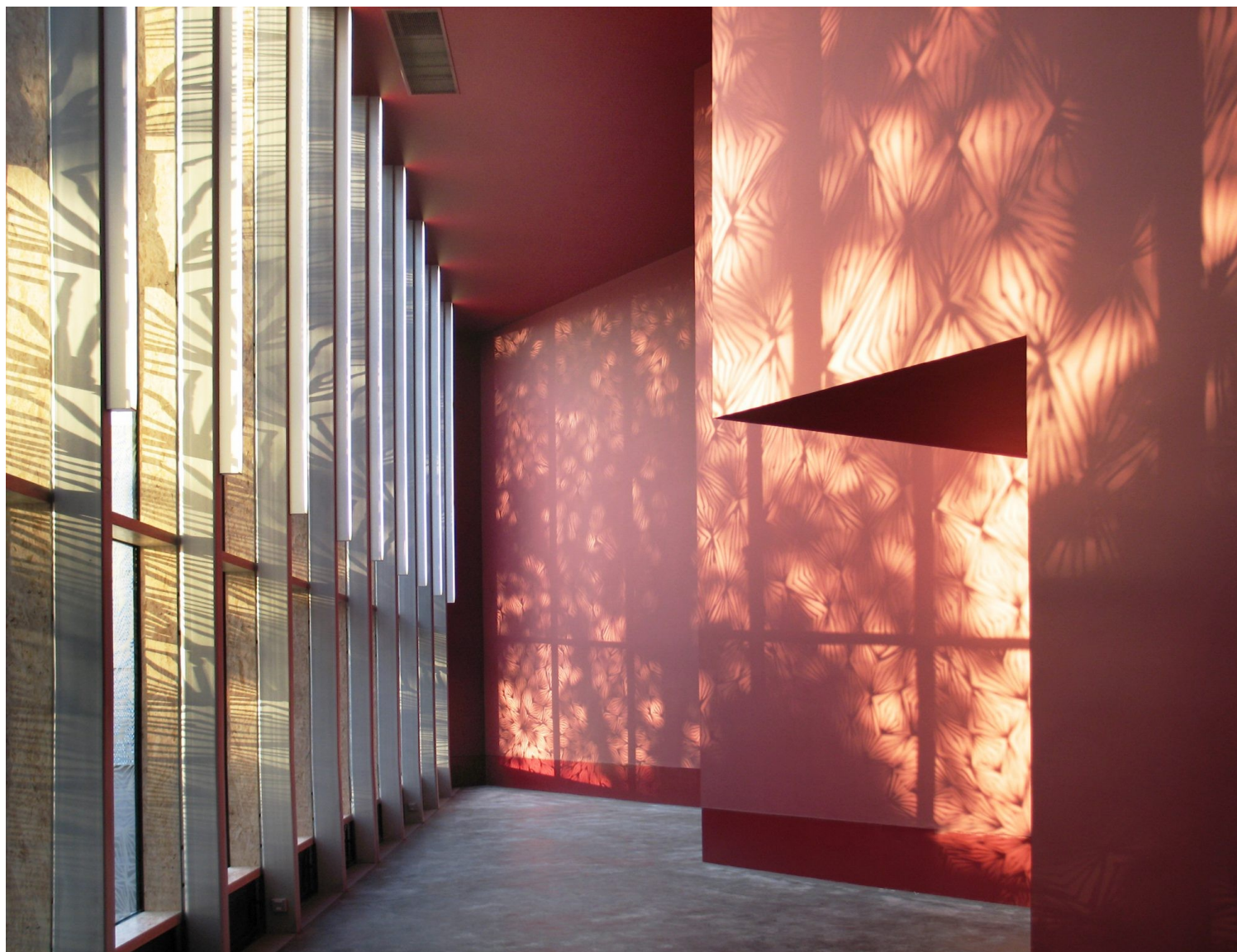
Stephen Lawrence Centre| Deptford arts uk

Αυτό φέρνει στον νου τον εξαιρετικό Ιanni Xenakis και τα έργα του, που εκτελούν αντίθετη κίνηση από αυτά του AJ Kwame. Ο Ιannis εκκινεί από το μουσικό μέλος και οδηγείται στη δημιουργία, επίλυση, εκτέλεση του αρχιτεκτονικού έργου, όπως κάνει στα ανοίγματα του μοναστηριού της Δομινικανής τάξης La Tourette ή στο πρωτοποριακό έργο Metastasis -έργο που παίζει και όση ώρα γράφεται αυτό το κείμενο-, που οδηγεί στον σχεδιασμό τού Philips Pavilion για τη Διεθνή έκθεση EXPO του 1958 στις Βρυξέλλες.