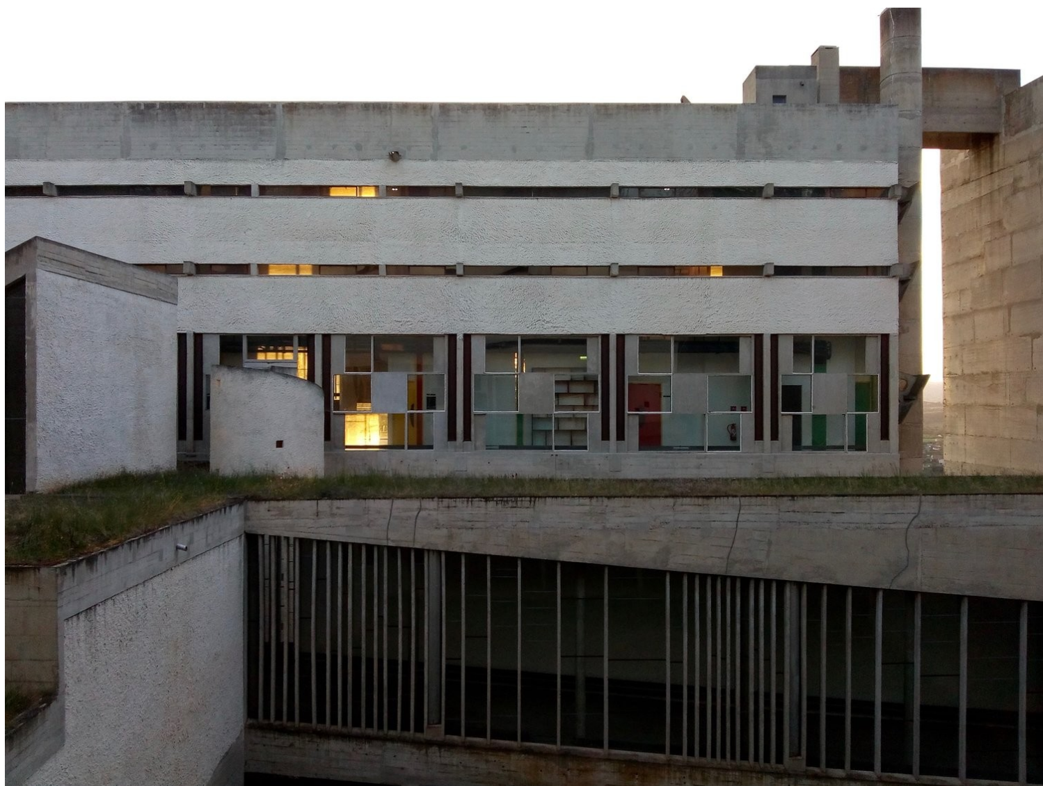
La Tourette Xenakis