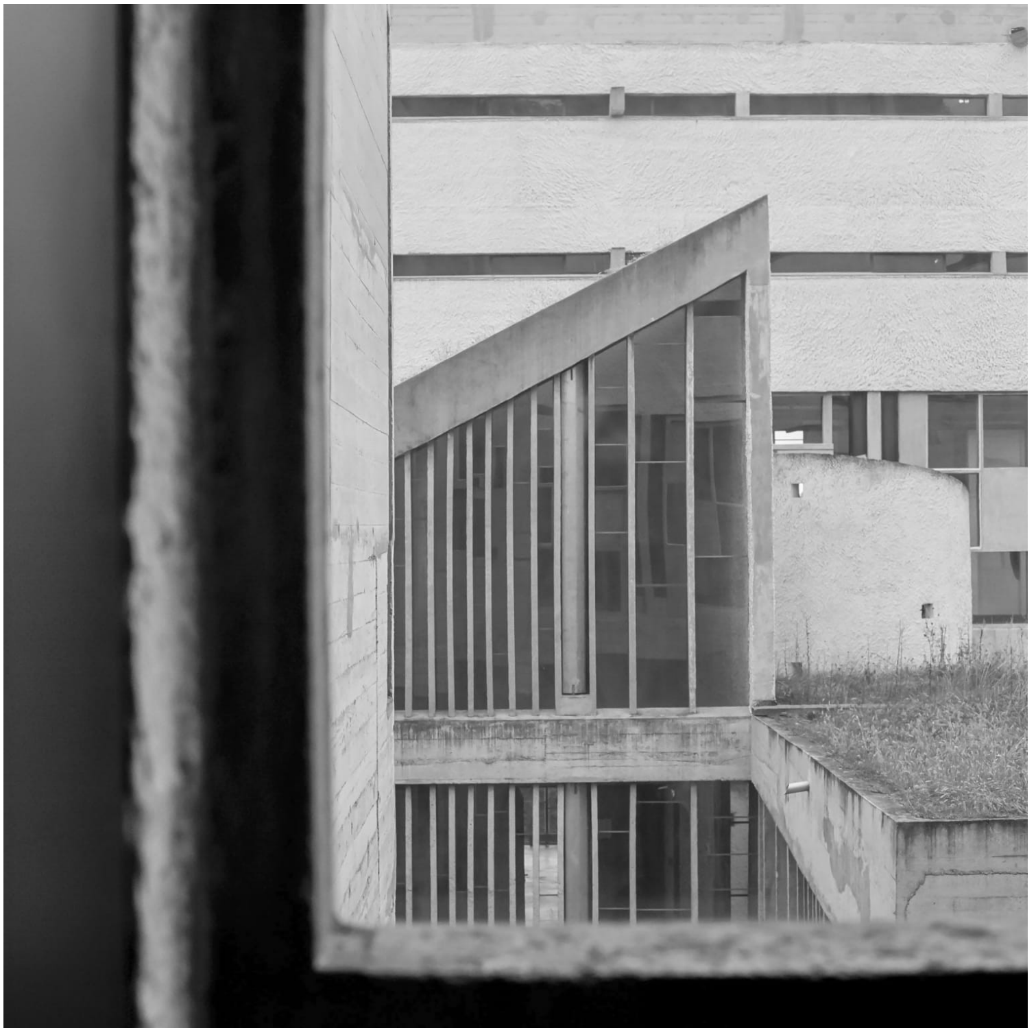
La Tourette Xenakis