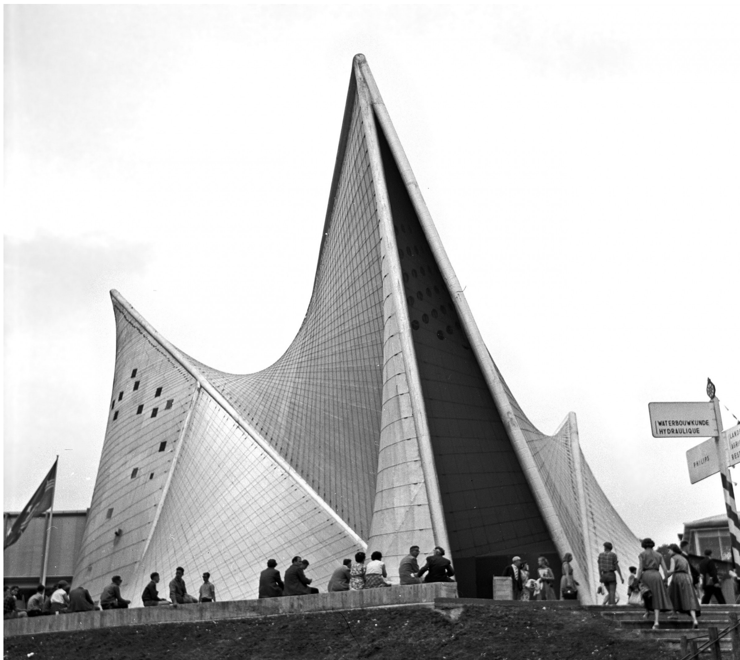
Philips Pavillion Expo 58 Iannis Xenakis | wikipedia.com

Και στα δύο έργα, αν και ποιοτικά απέχουν πολύ, νομίζω υπάρχει μια ρυθμολογική διάθεση ή αφετηρία, όπως την περιγράφει ο Henri Lefebvre το 1992• αναφορά που δείχνει και την πρωτοποριακή δυναμική του Iannis. Υπάρχει, δηλαδή, μια διάθεση ρυθμολογικής αντιμετώπισης του κόσμου, και -για να συνεχίσω και το μεταφορικό παιχνίδι- μια διάθεση οριζόντιας τομής των ρυθμών που υπάρχουν στον κόσμο. Αυτή είναι μια διάθεση που βρίσκει ομοιότητες ανάμεσα στα πράγματα, επειδή δεν εξετάζει τις εσωτερικές σχέσεις που τα καθοδηγούν, και που παράγουν κυρίως διαφορές ανάμεσα στα πράγματα, αλλά ενδιαφέρεται περισσότερο για τις συνηγήσεις που κάνουν αναμεταξύ τους οι εσωτερικοί τους ρυθμοί. Αυτές οι απόπειρες μετάφρασης ή εξέτασης μιας μορφής μέσω μιας άλλης, ενώ μπορεί να υστερούν σε ακρίβεια, είναι βασική ανθρώπινη λειτουργία συνεννόησης. Συνδυάζουν, σε ένα περισσότερο ή λιγότερο κατανοητό σύνολο, εμπειρίες και βιώματά μας, και μας επιτρέπουν να επεκτείνουμε τον διάλογο• τόσο εσωτερικά με εμάς τους ίδιους όσο και με το περιβάλλον μας.