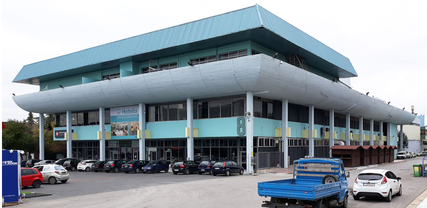
Εικ. 7. Περίπτερο 8 / Συνεδριακό Κέντρο «Νικόλαος Γερμανός» (πρώην Εμπορικό Κέντρο ΔΕΘ), αρχιτέκτονες Γ. Κονταξάκης, Χ. Κουλουκούρης, Ν. Μουτσόπουλος, Χ. Τσιλαλής, 1968. Υφιστάμενη κατάσταση με το «καπέλο» της προσθήκης.

Το «Ειδικό Χωρικό Σχέδιο» για την ανάπτυξη του χώρου της ΔΕΘ προβλέπει τη διατήρηση των εξής κτηρίων: Αλεξάνδρειο Μέλαθρον (γνωστότερο ως Palais des Sports), αρχιτέκτων Π. Τζανέτος και οι Γάλλοι