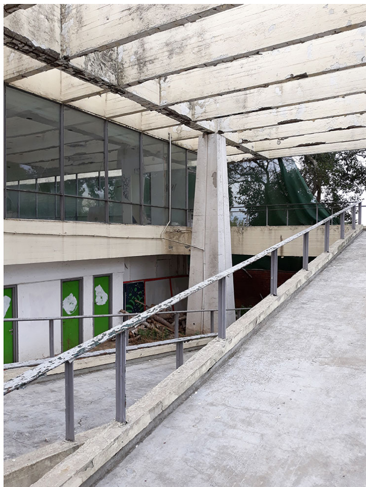
Εικ. 3. Το Περίπτερο της ESSO PAPPAS. Λεπτομέρειες σημερινής κατάστασης. [φωτ. Π. Εξαρχόπουλος, Νοέμβριος 2018]

Ευτελώς ξαφνικά, στις αρχές Μαρτίου, κι ενώ το σημαντικό αυτό κτήριο βρισκόταν κυριολεκτικά βυθισμένο στην αφάνεια και τη λήθη -με μηδαμινή παρουσία στον ειδικό και μη τύπο 4 -, αναρτήθηκε και τέθηκε προς δημόσια ηλεκτρονική διαβούλευση (από 5-3-2019) η «Στρατηγική Μελέτη Περιβαλλοντικών Επιπτώσεων του Ειδικού Χωρικού Σχεδίου για το Εκθεσιακό Κέντρο Θεσσαλονίκης». Ανάμεσα σε άλλα, το Σχέδιο αυτό προβλέπει την κατεδάφιση του Περιπτέρου της ESSO PAPPAS, όπως και όλων των υφιστάμενων εκθεσιακών περιπτέρων (καθώς και άλλων κτηριακών εγκαταστάσεων, όπως π.χ. το «Βελλίδειο» Συνεδριακό Κέντρο), με απώτερο στόχο τη συνολική νέα ανάπλαση του χώρου της ΔΕΘ. 5