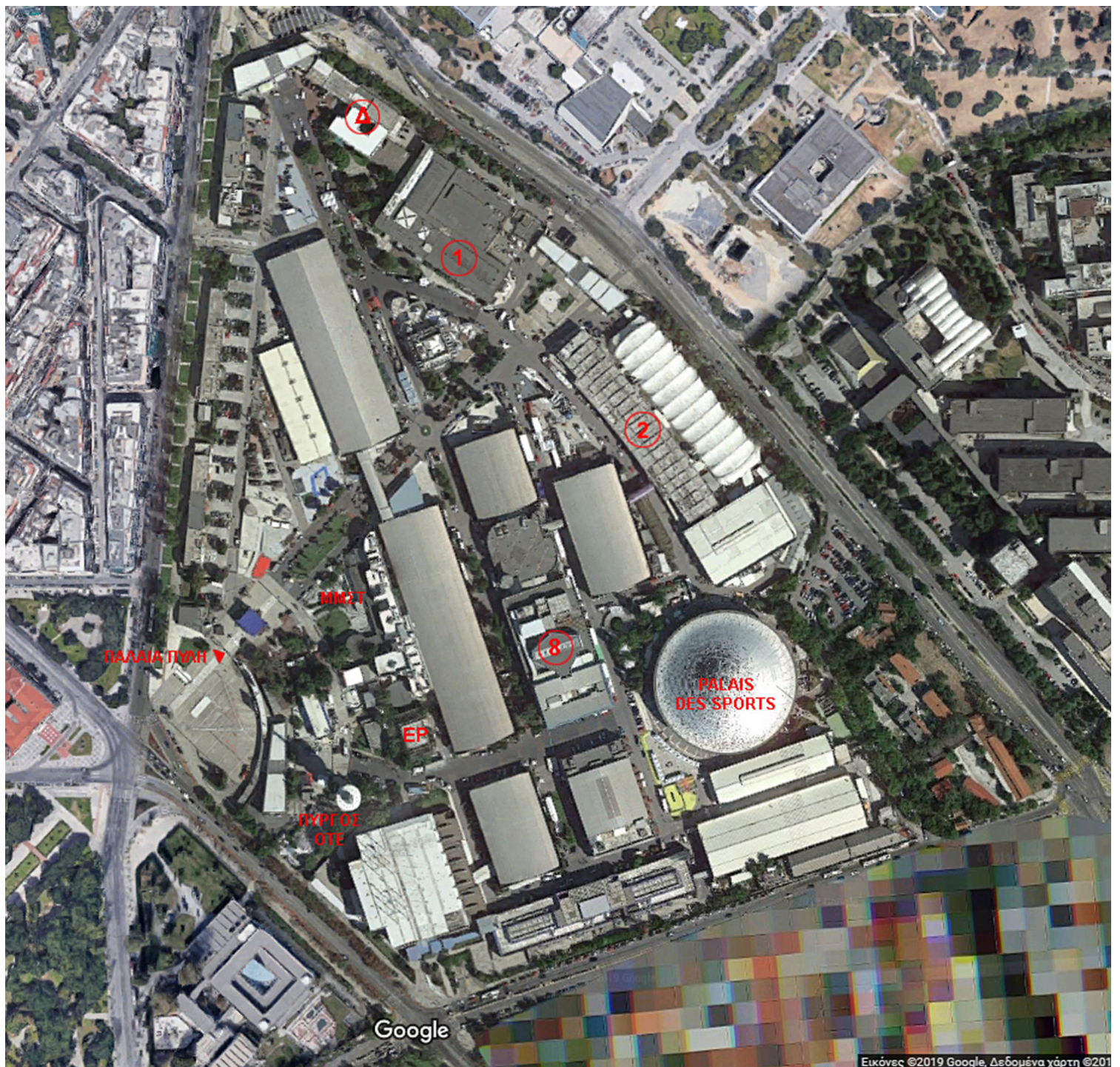
Εικ. 9. Οι «επίμαχες» κτηριακές εγκαταστάσεις της ΔΕΘ και οι προοπτικές τους: Δ: ΚΤΗΡΙΟ ΔΙΟΙΚΗΣΗΣ (προς κατεδάφιση) - 1: ΠΕΡΙΠΤΕΡΟ 1 (προς κατεδάφιση) - 2: ΠΕΡΙΠΤΕΡΟ 2 (προς κατεδάφιση) - 8: ΠΕΡΙΠΤΕΡΟ 8 / ΣΥΝΕΔΡΙΑΚΟ ΚΕΝΤΡΟ «ΝΙΚΟΛΑΟΣ ΓΕΡΜΑΝΟΣ» (προς κατεδάφιση) - EP: ΠΕΡΙΠΤΕΡΟ ESSO RAPPAS (αρχικά προς κατεδάφιση - προς διατήρηση) - MMΣΤ: ΜΑΚΕΔΟΝΙΚΟ ΜΟΥΣΕΙΟ ΣΥΓΧΡΟΝΗΣ ΤΕΧΝΗΣ (προς διατήρηση) - ΠΥΡΓΟΣ ΟΤΕ (προς διατήρηση) - PALAIS DES SPORTS (προς διατήρηση) - ΠΑΛΑΙΑ ΠΥΛΗ στην Πλατεία της ΧΑΝΘ (προς διατήρηση)