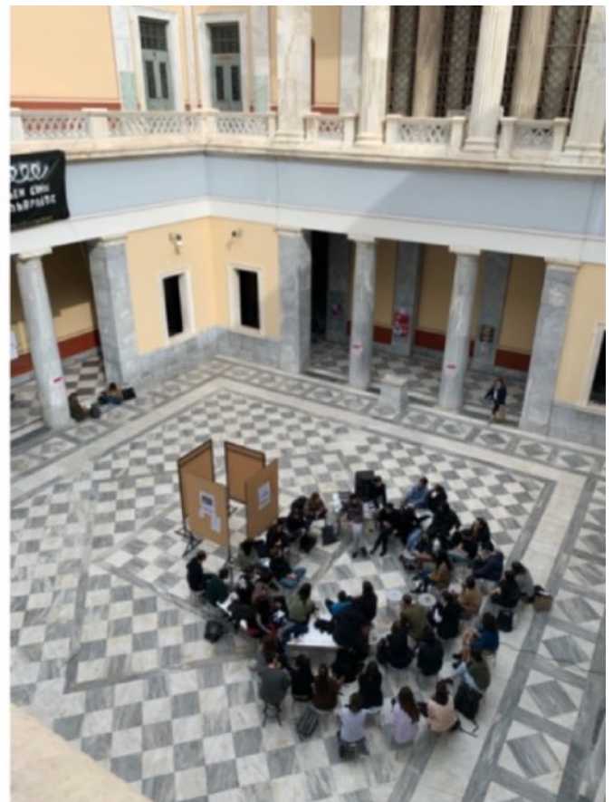
εικ.1. Ο αρχέτυπος χώρος του αιθρίου, στο κτίριο Αβέρωφ, ο ίδιος ζωντανό διδακτικό παράδειγμα.

Γιατί, σε όλα τα μαθήματα των αρχιτεκτονικών σπουδών, διδάσκοντες και διδασκόμενοι, ως μέρος μιας κοινότητας, συνυπάρχουν εκ των πραγμάτων και συνεργάζονται , αλλά και συν-διαλέγονται στον χώρο της σχολής , που, ειδικά σε εκείνη της Αθήνας, συγκροτεί και ο ίδιος το ύψιστο εκπαιδευτικό παράδειγμα . Το αίθριο, οι στοές, οι αίθουσες του κτιρίου Αβέρωφ αποτελούν άλλωστε τα πρώτα αρχετυπικά χωρικά διδάγματα που ασκούν επιρροή στη σκέψη και την πράξη της καθημερινής ζωής της ζωντανής εκπαιδευτικής διαδικασίας.