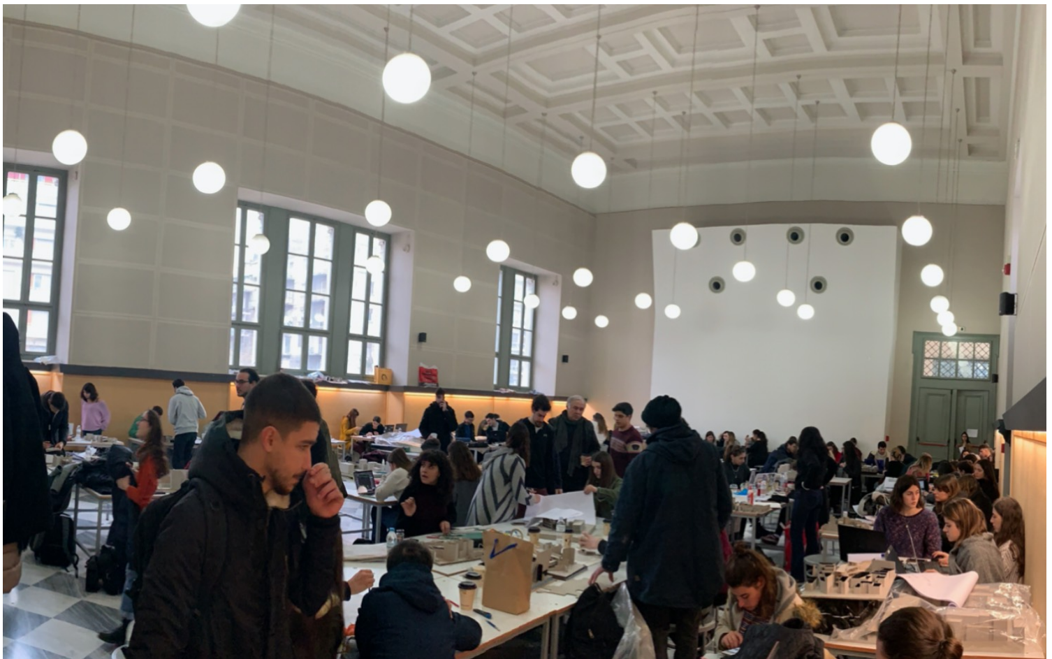
εικ.4. Ο πραγματικός διδακτικός χώρος.

Και επιπλέον (κατά τη διερώτηση του τίτλου). Τι είναι λοιπόν η τηλεεκπαίδευση στις αρχιτεκτονικές σπουδές; Τρόπος στοχαστικής διδασκαλίας ή διεκπεραιωτικής εργασίας; Τι αρχιτέκτονες, μελλοντικούς πολίτες, αυτή μας υπόσχεται;