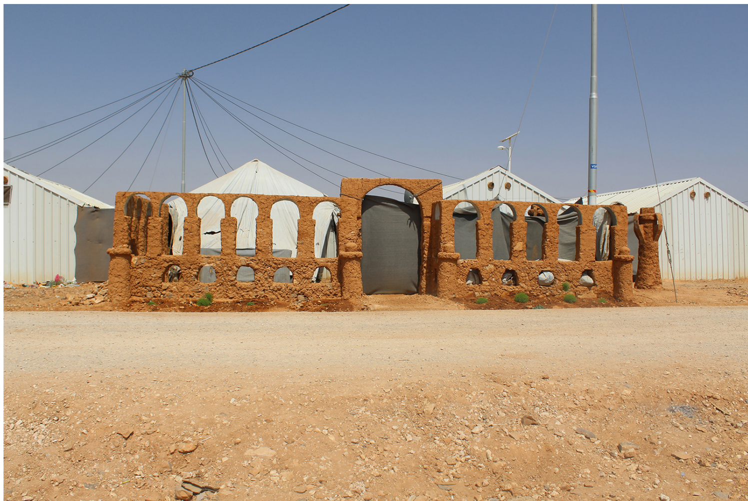
Μνημείο από πηλό που παραπέμπει στην πόλη της Παλμύρας και την ιστορική αρχιτεκτονική στο Αλέπο.