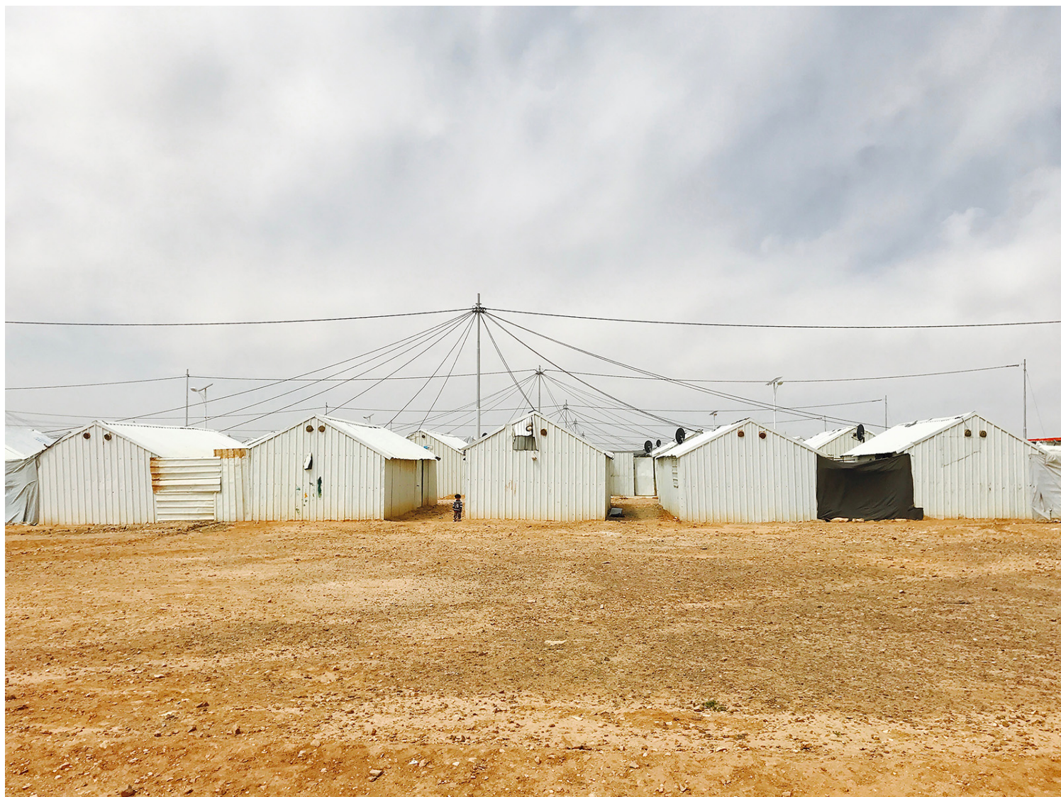
T-Shelter: Το τυποποιημένο ανθρωπιστικό καταφύγιο του καταυλισμού.

Τα Αυτοκρατορικά Λάβαρα που κοσμούν τη σκηνή, εξιστορούν στιγμές από την καθημερινή ζωή στον καταυλισμό μέσα από παρεμβάσεις, εφευρέσεις και έργα τέχνης των κατοίκων. Η παρουσίαση του καταυλισμού μέσα από την πτυχή του σχεδιασμού από πρόσφυγες ανοίγει μια συμμετοχική συζήτηση για τις πολιτικές που διέπουν τους χώρους ανθρωπιστικής βοήθειας. Η πρωτοτυπία και εφευρετικότητα αυτών των παρεμβάσεων φέρνουν στο προσκήνιο την απόσταση ανάμεσα στις διαθέσιμες ανθρωπιστικές υποδομές και τις πραγματικές ανάγκες των προσφύγων. Διαφοροποιώντας και εξοικειώνοντας τα τυποποιημένα καταφύγια του καταυλισμού, οι Σύριοι πρόσφυγες εξαυθρωπίζουν την ανθρωπιστική αρχιτεκτονική, χρησιμοποιώντας την τέχνη και τον σχεδιασμό ως ένα μέσο για αυτοπροσδιορισμό και ανοικοδόμηση.