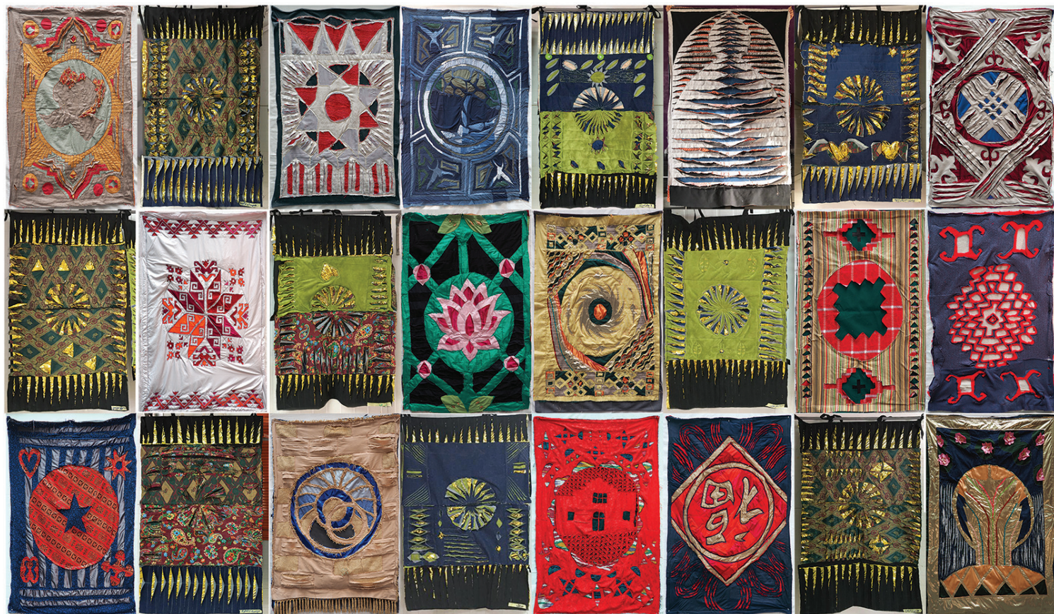
Πάνελ με προσωπικές αφηγήσεις από τους συμμετέχοντες στα επιμορφωτικά εργαστήρια του MIT Future Heritage Lab στη Σάρτζα, ΗΑΕ, Βοστώνη, ΗΠΑ και Ζάαταρι, Ιορδανία.