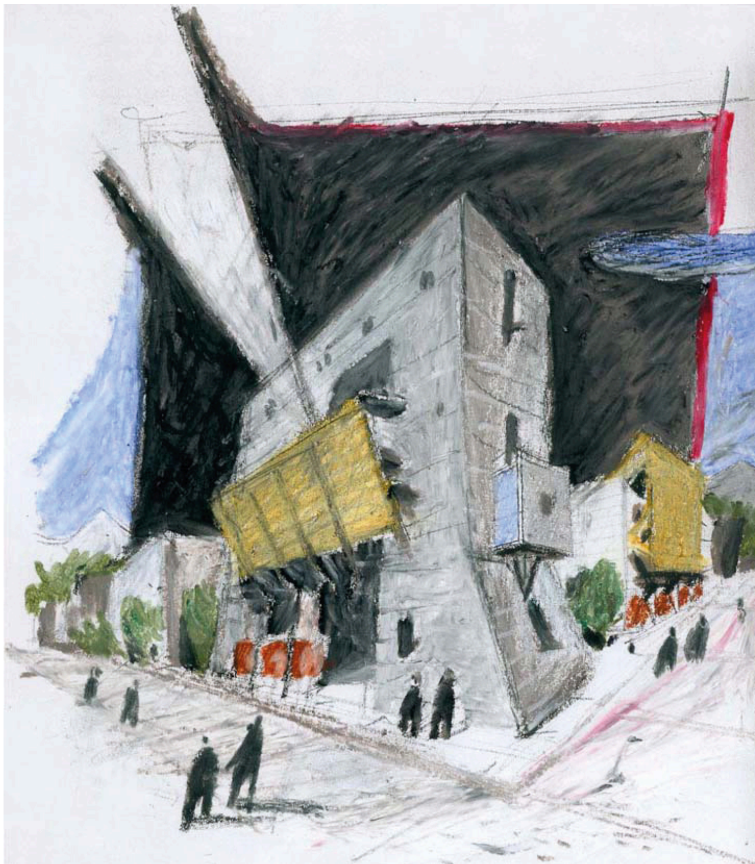
Τάσης Παπαϊωάννου, Δημαρχείο Μεσολογγίου, 2003