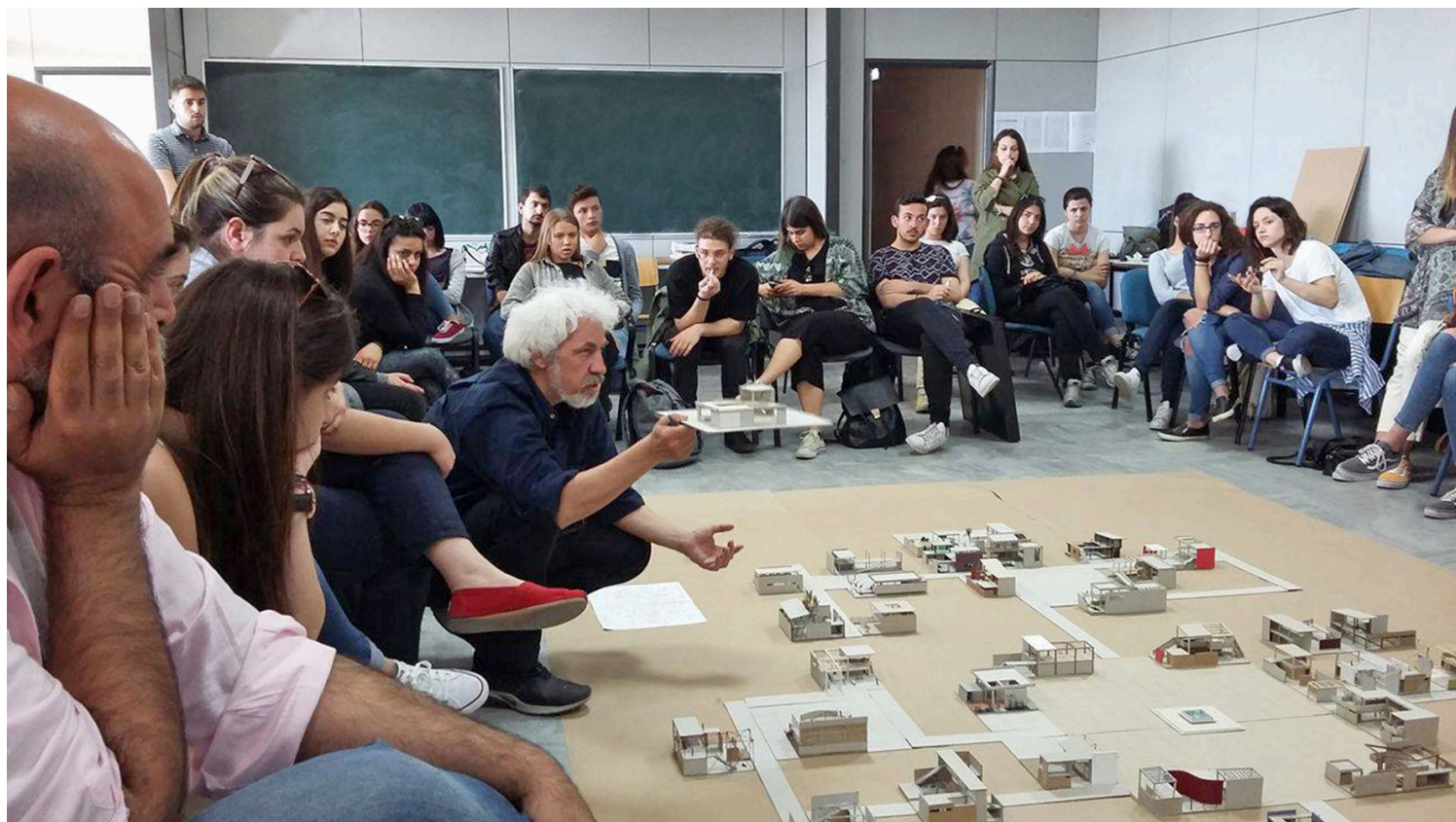
Η «τελετουργία της διδασκαλίας» των αρχιτεκτονικών συνθέσεων στο Τμήμα Αρχιτεκτόνων της Ξάνθης.