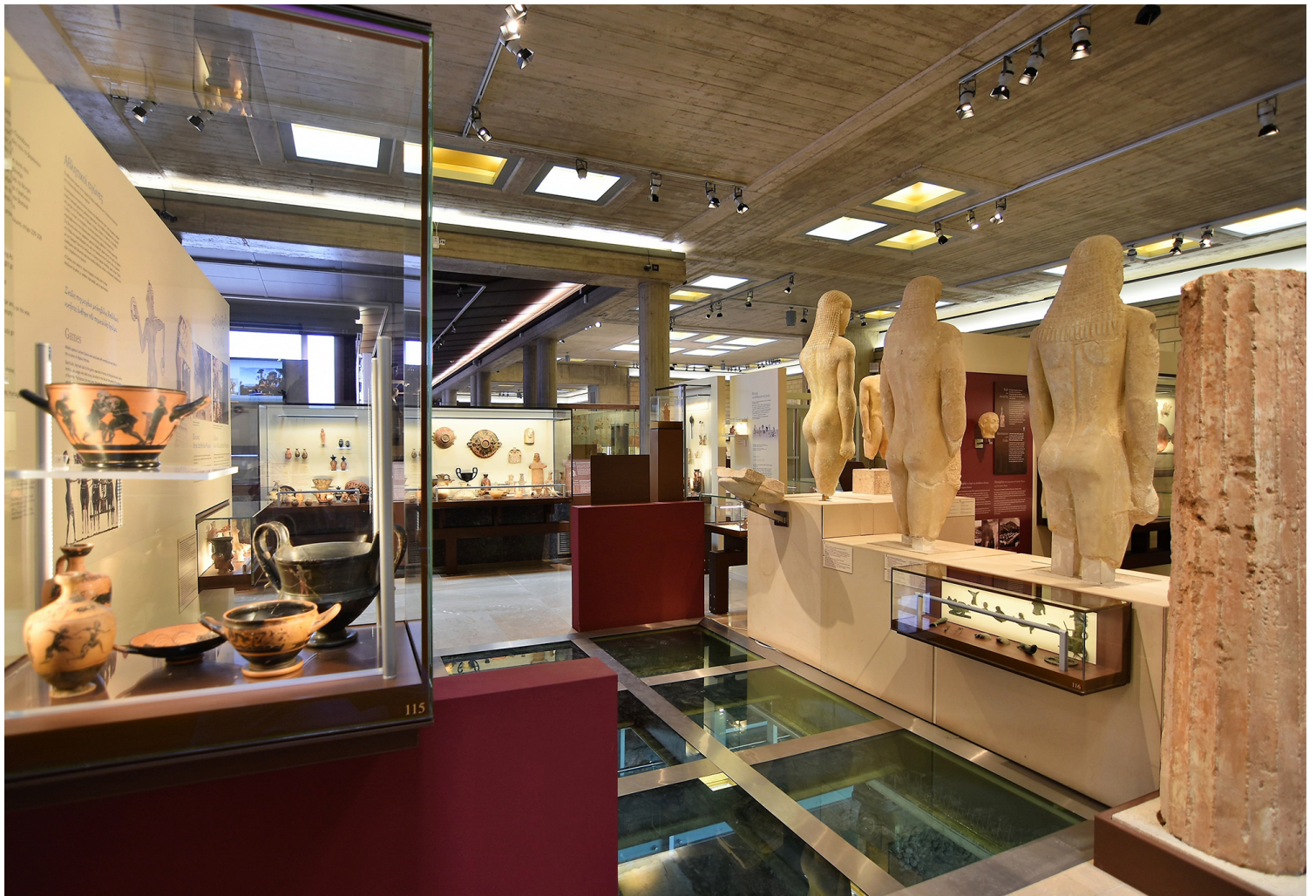
Μ. Σουβατζίδης, Νέο Αρχαιολογικό Μουσείο Θεσσλονίκης