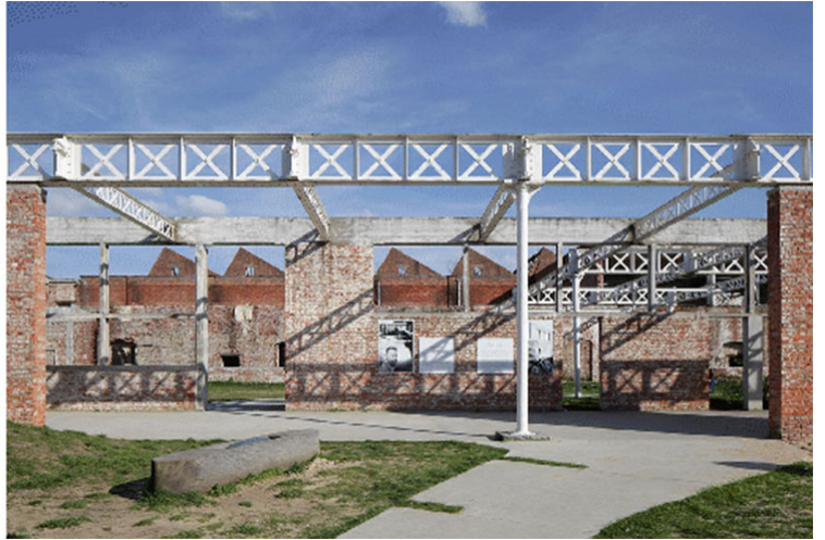
Μετατροπή παλαιού βιομηχανικού συγκροτήματος σε πάρκο, Βέλγιο.