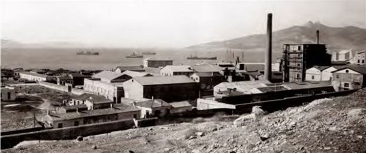
Βιομηχανικό τοπίο Ελευσίνας.

Σκοπός της συγκεκριμένης έρευνας είναι η διερεύνηση των παραγόντων που επηρεάζουν τη διαδικασία της λήψης των αποφάσεων για την ανάπλαση των βιομηχανικών κατάλοιπων. Στο τέταρτο κεφάλαιο παρουσιάζονται τα συμπεράσματα της μελέτης, καθώς η επιτυχία της επανάχρησης των βιομηχανικών κελυφών βασίζεται στον σωστό συνδυασμό των αξιών που το διέπουν, του ιδιαίτερου χαρακτήρα και πνεύματος του τόπου όπου αυτά βρίσκονται και της προσεκτικής διαχείρισης του υπάρχοντος εξοπλισμού. Τα τρία αυτά στοιχεία συνθέτουν ένα μοναδικό πλέγμα, που καθοδηγεί τη διαδικασία λήψης των αποφάσεων επανάχρησης, προκειμένου να εξασφαλιστεί η βέλτιστη ανάδειξη της βιομηχανικής ιστορίας του κτηρίου και η ταυτόχρονη ένταξη των νέων χρήσεων.