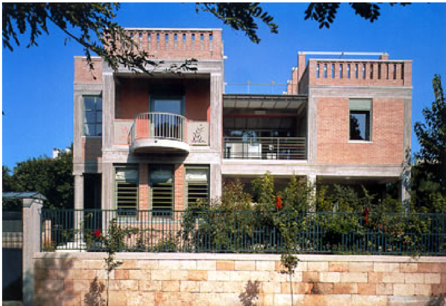
Η όψη της κατοικίας Βέτα στη Φιλοθέη προς τον δρόμο, Κυριάκος Κρόκος