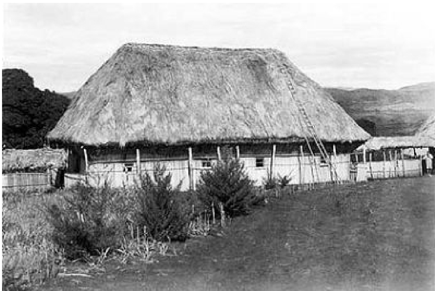
Κατοικία στην Banso από το βιβλίο “L’Africain” του J.M.G. Le Clezio

Με αντίστοιχο τρόπο, στην αρχιτεκτονική, το έργο συλλαμβάνεται σε έναν δεδομένο τόπο, στον οποίο αναπόφευκτα οφείλει τα ιδιαίτερα χαρακτηριστικά του, όπως το παιδί στον γονέα. Ο τόπος, σαφώς, θέτει παραμέτρους που δεν μπορούν να αγνοηθούν και μάλιστα κατευθύνουν τον αρχιτεκτονικό σχεδιασμό, “επιβάλλοντας” ορισμένες βασικές αρχές. Οι αρχές αυτές μπορεί να απορρέουν από παράγοντες όπως οι κλιματολογικές, οι κοινωνικές, οι πολιτικές συνθήκες, τα ήθη και τα έθιμα, αλλά και το παρελθόν ενός τόπου. Την ίδια στιγμή, όμως, που όλες αυτές οι παράμετροι οριοθετούν, παρέχουν και την ελευθερία διαφορετικής ερμηνείας τους από τον κάθε δημιουργό. Αυτό συνεπάγεται ότι η αναγνώριση της παρουσίας τους και η αποδοχή της δύναμης που ασκούν σε κάθε μελλοντικό δημιούργημα, δεν αποκλείει τους ποικίλους τρόπους ανάγνωσής τους.