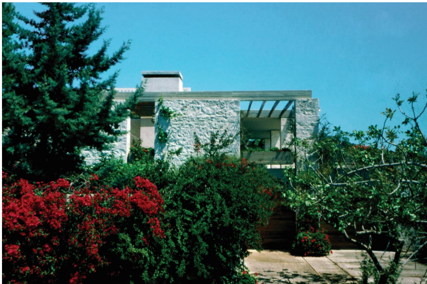
Δυτική όψη της κατοικίας στην Περιβόλα Αίγινας, Κωνσταντίνος Δεκαβάλλας