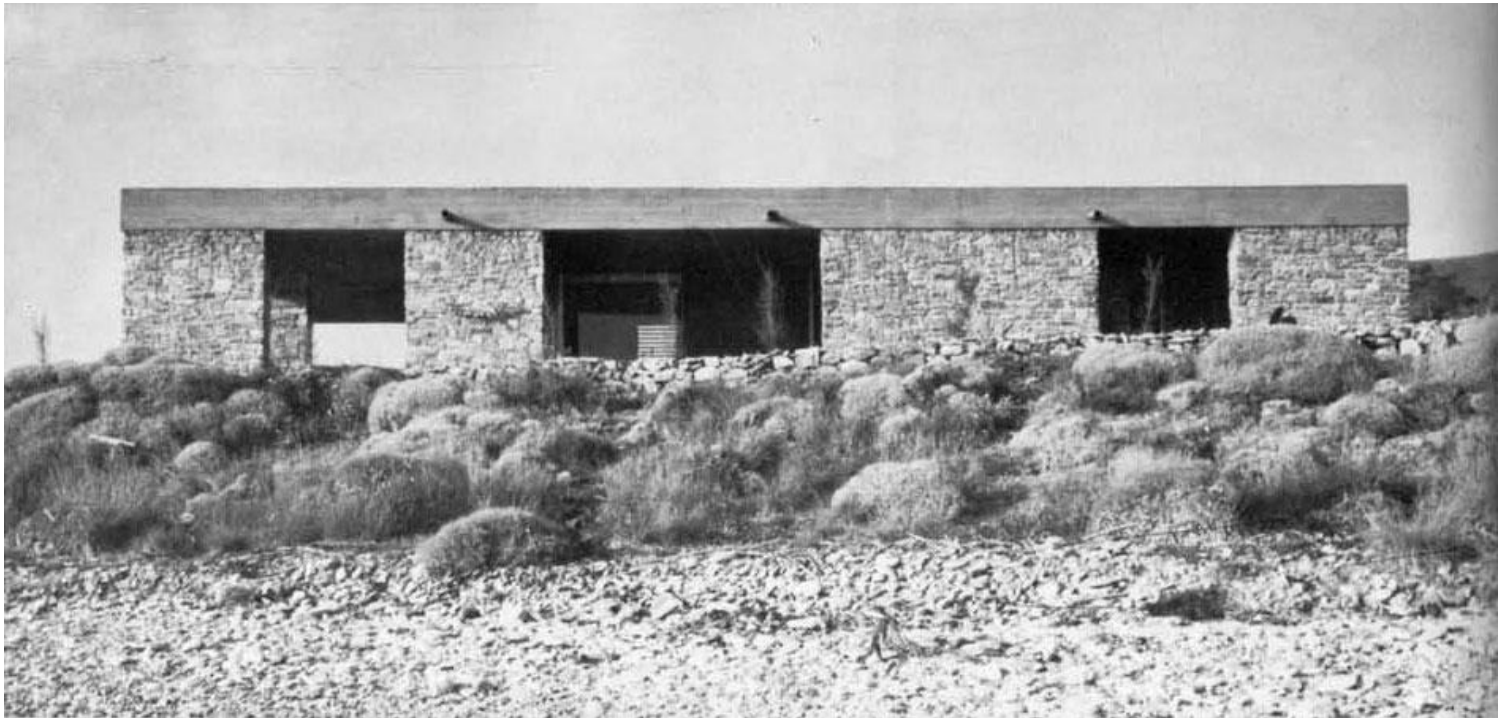
Εξοχική κατοικία στην Ανάβυσσο, Άρης Κωνσταντινίδης, 1961-1962