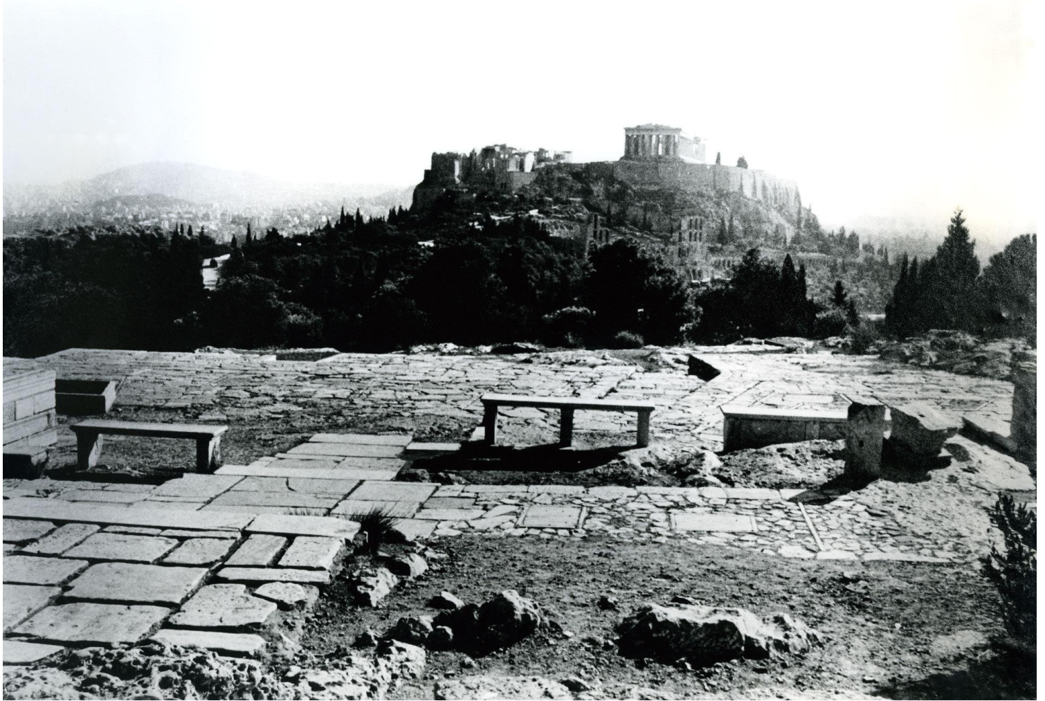
Διαμόρφωση του αρχαιολογικού περί την Ακρόπολη χώρου και του λόφου Φιλοπάππου, Αθήνα, Δημήτρης Πικιώνης, 1954-1957

Η επιλογή και αντιπαραβολή των τριών δημιουργών έγινε με κριτήριο τη σχετικά παράλληλη χρονικά δράση τους στον χώρο της αρχιτεκτονικής, από τη δεκαετία του '60 και μετά, σε μια περίοδο που η ελληνική αρχιτεκτονική βρίσκεται στο μεταίχμιο παράδοσης και μοντερνισμού. Και στις τρεις περιπτώσεις, κοινή κατεύθυνση υπήρξε η συμπίεση των δύο παραπάνω τάσεων, με έμφαση τόσο στη μελέτη και ένταξη στον σχεδιασμό των στοιχείων του ελληνικού τόπου και της παράδοσης, όσο και στις οργανωτικές αρχές και τεχνολογίες που εισήγαγε το μοντέρνο κίνημα. Κατόπιν μελέτης του αρχιτεκτονικού, αλλά και του συγγραφικού έργου των αρχιτεκτόνων, διαπιστώθηκε σε κάθε περίπτωση ο εστιασμός σε διαφορετικά σημεία του ελληνικού τόπου και της παράδοσης που τον διέπει, με αποτέλεσμα να πρόκειται για τρεις ξεχωριστές αντιπροσωπευτικές ερμηνείες του τόπου, με κοινή βάση.