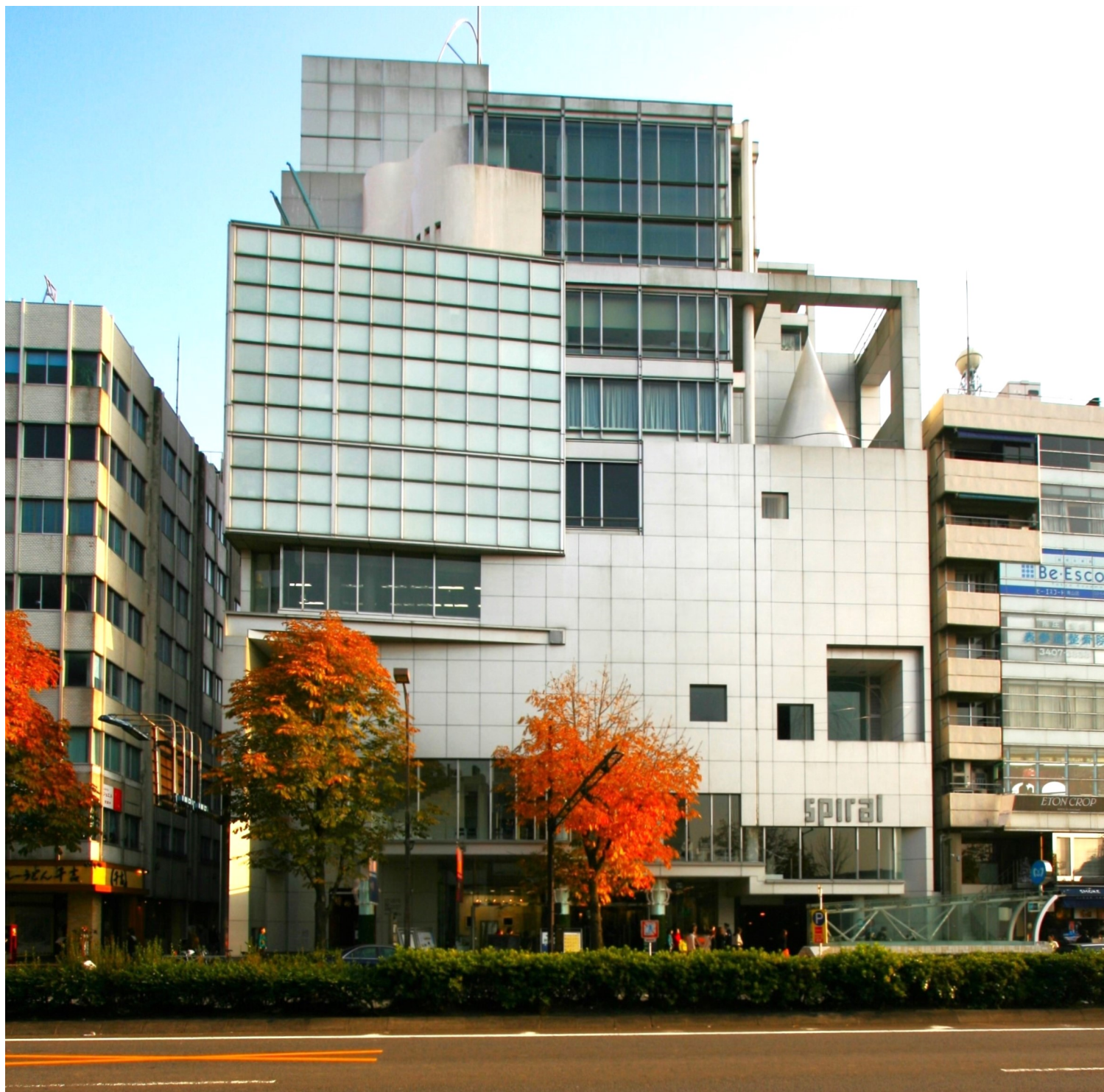
Κτίριο πολιτισμού Σπράλ, Τόκιο, 1984