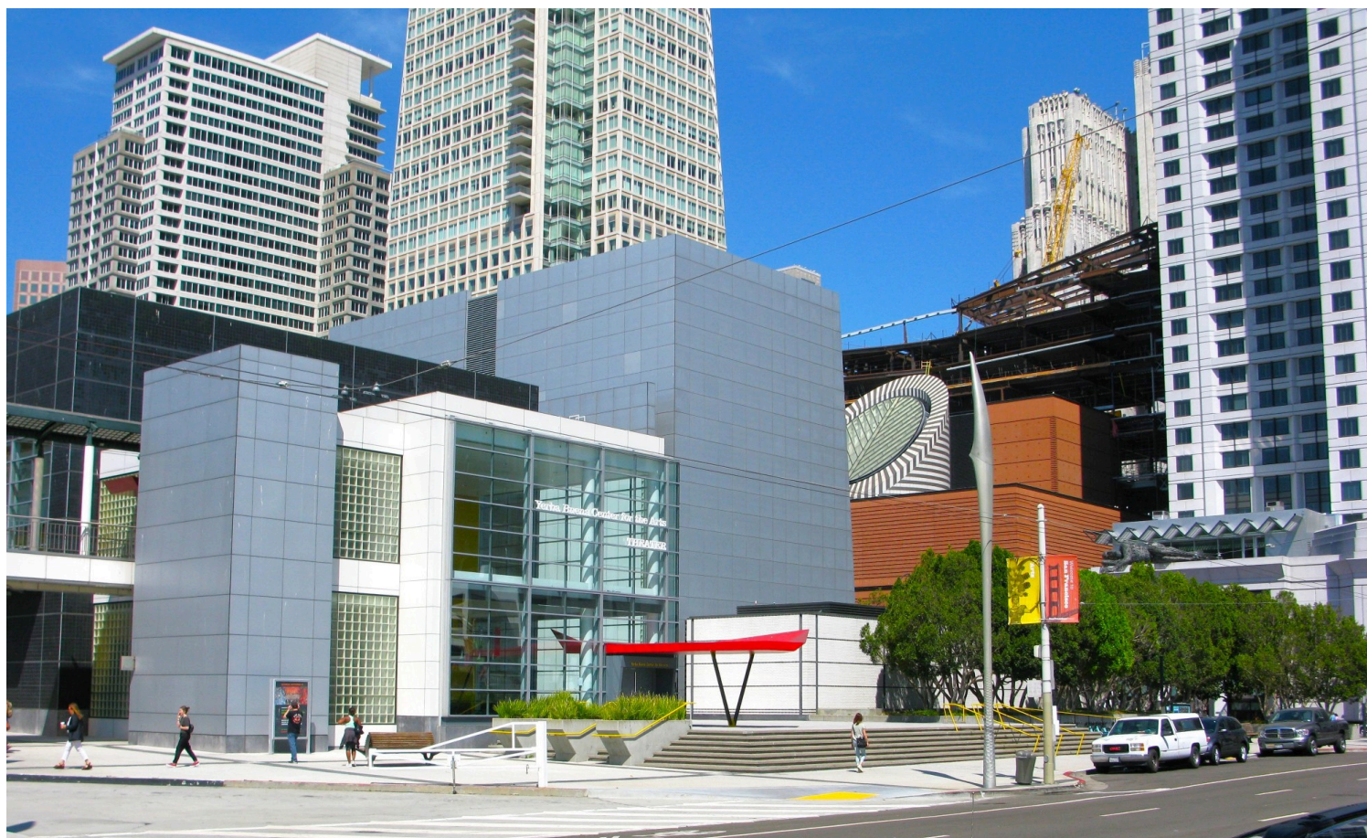
Yerba Buena Center for the Arts, Σαν Φρανσίσκο, 1993. Δεξιά διακρίνεται το Μουσείο Μοντέρνας Τέχνης, έργο του Μάριο Μπότα