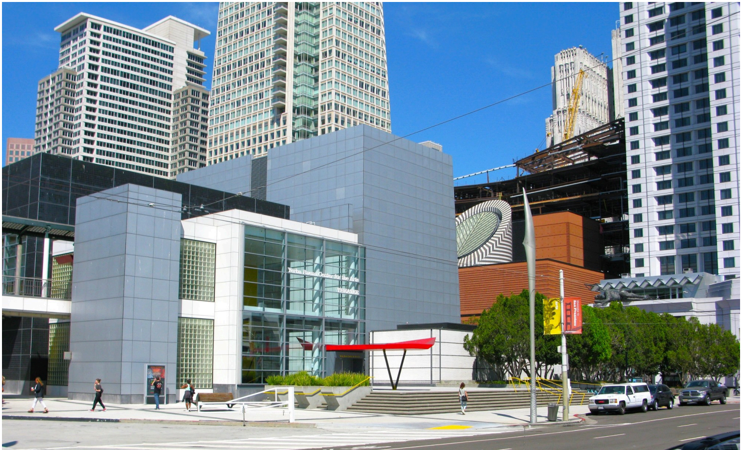
Yerba Buena Center for the Arts, Σαν Φρανσίσκο, 1993. Δεξιά διακρίνεται το Μουσείο Μοντέρνας Τέχνης, έργο του Μάριο Μπότα