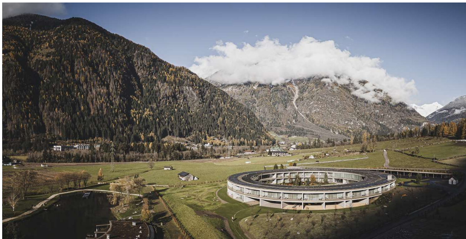
Κάμπο Τούρες, Νότιο Τιρόλο, Ιταλία. Το νέο ριζόρτ «OLM Nature Escape Eco-Aparthotel» είναι έργο του γραφείου Andreas Gruber Architects