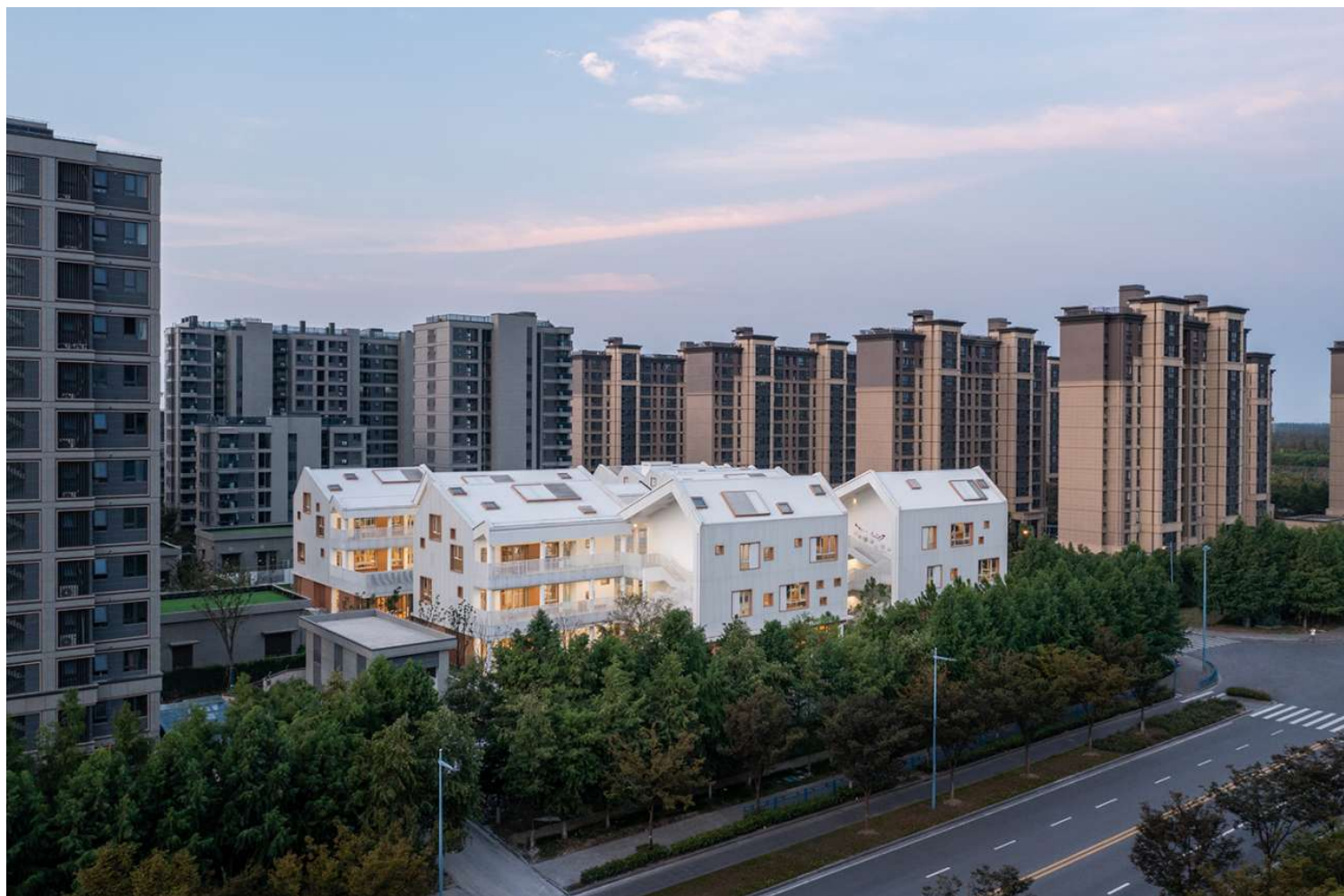
Σαγκάη, Κίνα. Παιδικός σταθμός «Shanghai Blue Bay», από το γραφείο East China Architectural Design and Research institute | Studio Dingshun