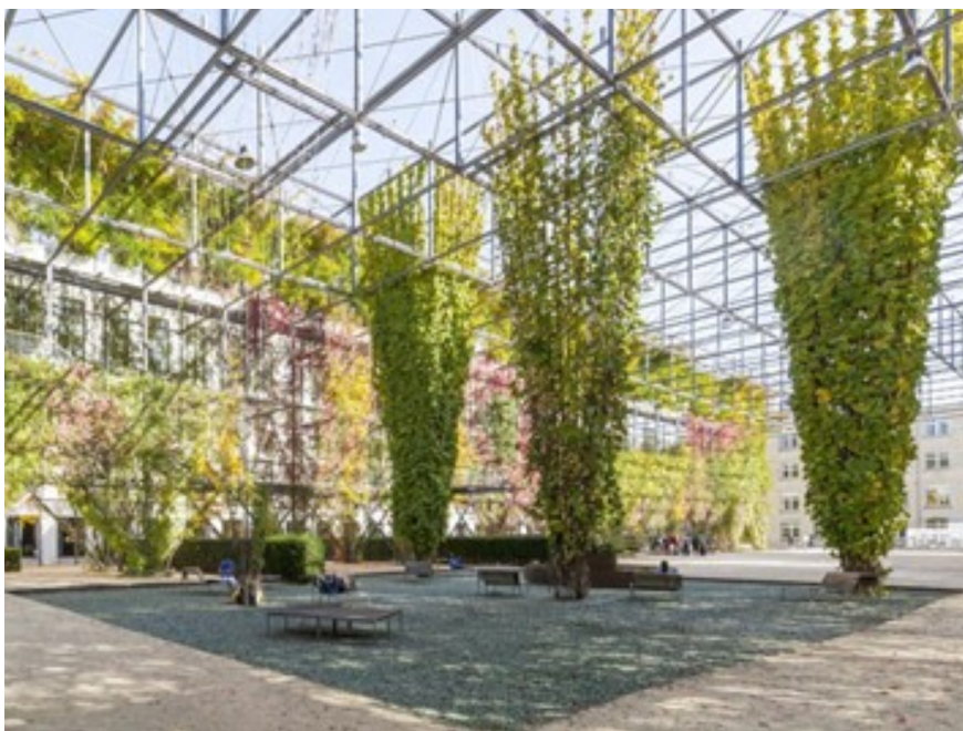
3.6 Burckhardt+Partner σε συνεργασία με τον Raderschall (2002): πρώην Μηχανουργείο στο Oerlikon - Ζυρίχη - MFO ( zuerich.com , τελευταία επίσκεψη: 4-6-2023)

Στη θέση του πρώην μηχανουργείου Maschinenfabrik Oerlikon (MFO) στη Ζυρίχη, κατασκευάστηκε ένας τύπος πάρκου, καλυμμένου από μεταλλική κατασκευή διπλού πλέγματος που περιβάλλεται από αναρριχητικά φυτά. Περιβάλλεται από πολυτελή φυτά που υποστηρίζονται από καλώδια. Τα σκαλοπάτια και τα προεξέχοντα μπαλκόνια προσκαλούν τους περαστικούς να περπατήσουν στην πολυβραβευμένη κατασκευή και να παραμείνουν για λίγο. Το καλοκαίρι, η εγκατάσταση χρησιμοποιείται συχνά για διάφορες πολιτιστικές εκδηλώσεις, όπως προβολή ταινιών ή φεστιβάλ όλων των ειδών 11 .