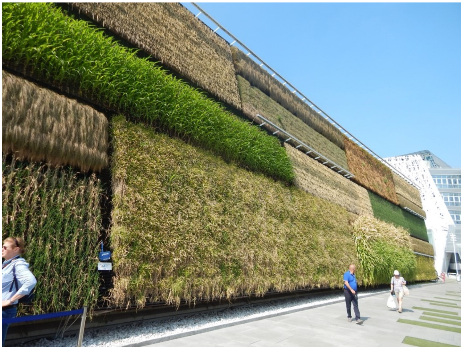
3.3 David Knafo (2015) | Ο τοίχος καλλιεργήσιμων τμημάτων που κάλυπτε το περίπτερο του Ισραήλ στην EXPO 2015 “Feeding the Planet, Energy for Life”- Milano (προσωπικό αρχείο)