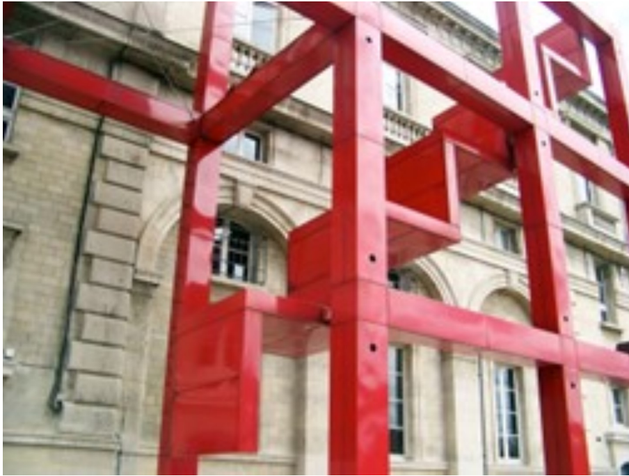
3.5 B. Tschumi (1982-1998): Parc de la Villette, Paris ( se.pinterest.com , τελευταία επίσκεψη: 17-7-2024)

Πρόσφατα (2019) πραγματοποιήθηκε στο Kanal Centre-Pompidou στις Βρυξέλλες, μια έκθεση 9 που εξερευνά νέα αρχιτεκτονικά σχήματα που σχετίζονται με Follies. Πέρα από τις ιστορικές αναδρομές, μέσα από το πολυπληθές σύνολο έργων που παρουσιάζονται, αυτή η έκθεση αποκαλύπτει την επικαιρότητα του θέματος. Το Miscellaneous Follies εκφράζει το συνεχές ενδιαφέρον των επιμελητών της έκθεσης για την ταξινόμηση 10 .