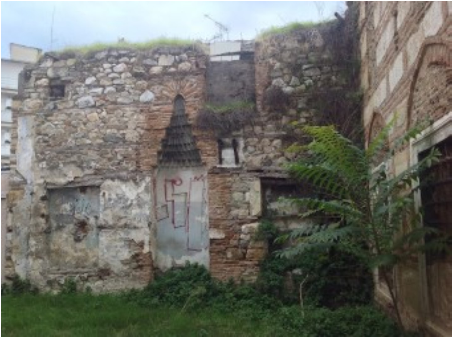
1.1 Τέμενος «Μπαϊρακλή τζαμί» (google.com)

Ο κενός χώρος που προκύπτει από την κατεδάφιση του κτηρίου έχει λιγότερο ή περισσότερο εφήμερο χαρακτήρα και διατηρείται μέχρι την ανέγερση νέας οικοδομής.