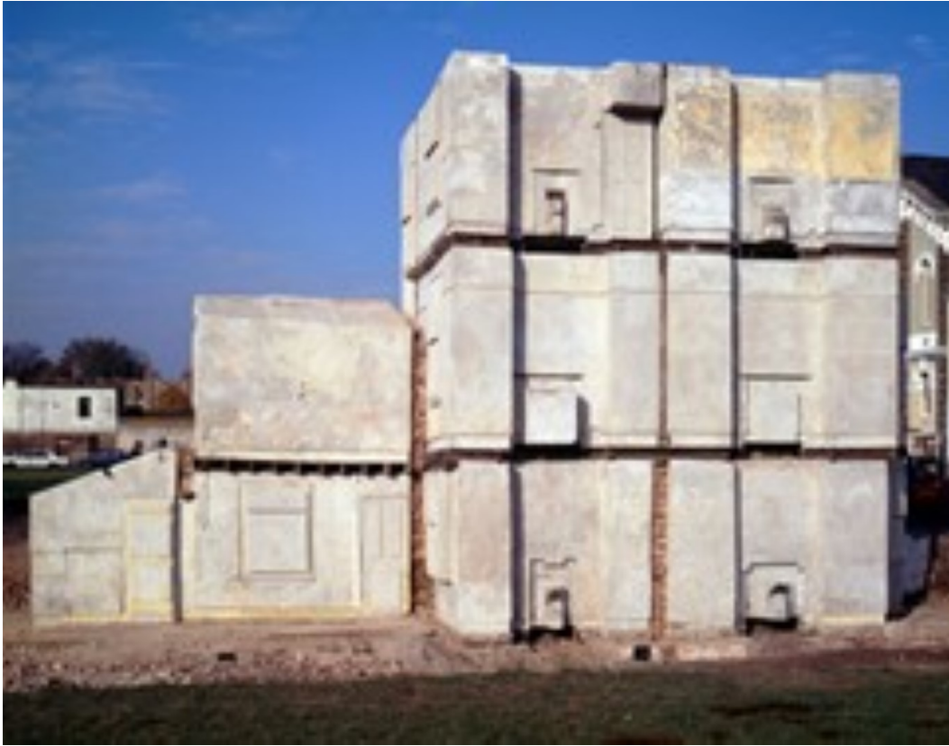
1.2 Rachel Whiteread (1993): House ( frieze.com , τελευταία επίσκεψη: 17-7-2024)

κατεδαφιστεί νωρίτερα από το Tower Hamlets London Borough Council). Το έργο προκάλεσε ανάμεικτες αντιδράσεις, κερδίζοντας τόσο το βραβείο Turner για την καλύτερη νεαρή Βρετανίδα καλλιτέχνη το 1993 (ήταν η πρώτη γυναίκα που κέρδισε βραβείο Turner), όσο και το βραβείο τέχνης K Foundation για τη χειρότερη Βρετανίδα καλλιτέχνη. Η κατασκευαστική εταιρεία κατεδάφισε το έργο House στις 11 Ιανουαρίου 1994 και η ίδια η απόφαση κατεδάφισης προκάλεσε διαφωνίες και διαμάχες 1 .