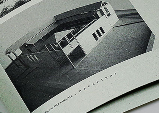
Edificio in Spain