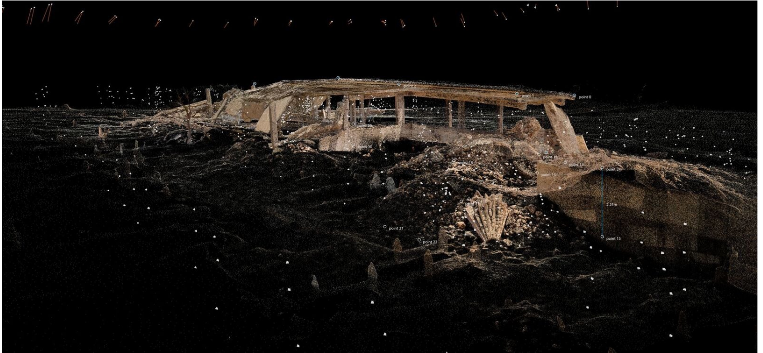
Η καταστροφή της Κληρονομιάς των Yazidi: Φωτογραμμετρία του ναού του Sheikh Mand. Credit: Forensic Architecture, 2018

πρόσωπα που προσφέρουν μια εμπειρική, βιωματική προσέγγιση της υπόθεσης. Πολλές φορές δεν μπορούμε να πάμε στα μέρη τα οποία μελετάμε, οπότε το να βρίσκεσαι σε επαφή με κάποιον που είναι από εκεί και έχει βιώσει τον τόπο, σου λύνει πολλά προβλήματα, πάρα πολύ γρήγορα. Αυτό είναι πολύ σημαντικό, ιδιαίτερα όταν προσπαθείς να αναλύσεις συστημική βία, δηλαδή μια βία που δεν είναι της στιγμής αλλά διαρκεί καιρό και ασκείται οργανωμένα από οποιοδήποτε σύστημα καταπίεσης. Τα διάφορα μοντέλα καταγραφής στα οποία βασίζονται διάφορες ΜΚΟ αλλά και εμείς, στηρίζονται σε μεγάλο βαθμό σε μαρτυρίες. Φυσικά, τα θέματα χώρου και χρόνου δεν είναι τόσο ακριβή σε μια τέτοια καταγραφή, οπότε εμείς συμπληρώνουμε την ανθρώπινη φωνή με μια αρχιτεκτονική ανάλυση που συνθέτει τα βιωματικά στοιχεία με τα τεχνικά.