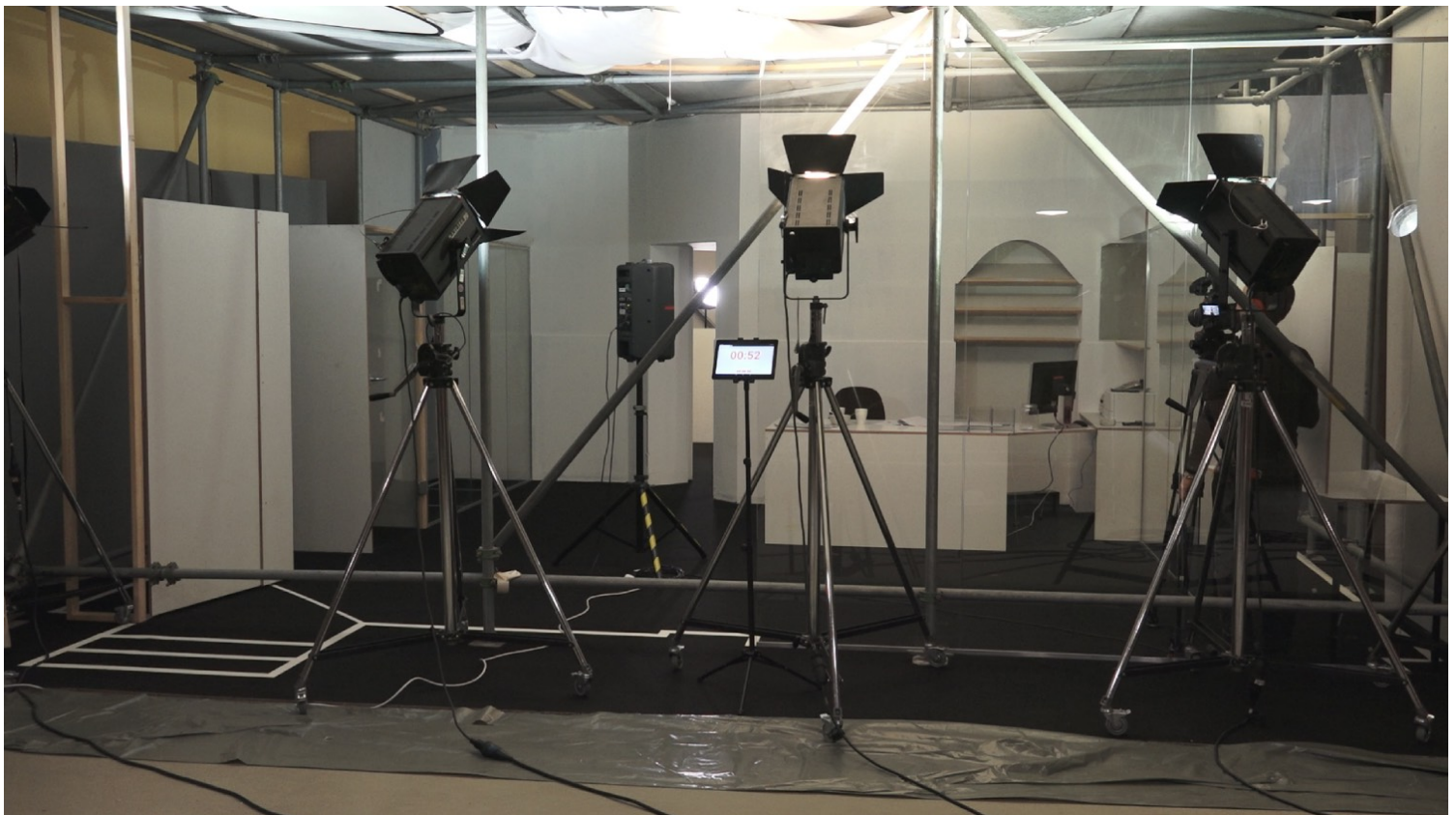
Η δολοφονία του Halit Yozgat: Ανακατασκευή του internet café του Halit Yozgat στο House of World Cultures (HKW) στο Βερολίνο, 6-11 Μαρτίου 2017. Image: Forensic Architecture, 2017