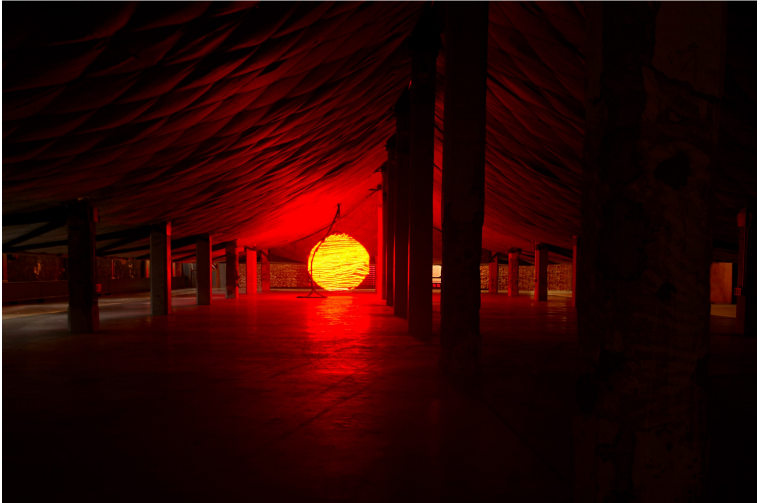
Matadero, Madrid, 2021

Όλα τα παραπάνω χαρακτηριστικά και εμμονές μπορούν να ανιχνευθούν σε πολλά από τα επόμενα έργα του. Πιο συγκεκριμένα, τον περασμένο Οκτώβρη ο Σαντομά δημιούργησε μια εγκατάσταση στον εργοστασιακό χώρο του Matadero της Μαδρίτης, υπό τον τίτλο “pista de baile” . Ουσιαστικά μετασκέυασε ολοκληρωτικά τον χώρο σε ένα multimedia πάρτι. Η εγκατάσταση ήταν σε συνεργασία με τον Simon και το studio ProtoPixel , ενώ τέλος στην εγκατάσταση συμμετείχαν χορευτές σύγχρονου χορού της ομάδας Ciudad Bilar Exagerar . Η εγκατάσταση θέτει το ερώτημα αν μια κατασκευή σαν αυτή μπορεί να είναι αρχιτεκτονική, εφόσον στεγάζεται μέσα σε κάτι ήδη αρχιτεκτονημένο, ή αν τελικά είναι ένα διευρυμένο αντικείμενο design εντός του οποίου συμβαίνουν γεγονότα. Μπορεί τελικά ο κατασκευασμένος χώρος να είναι αντικείμενο; Μπορεί να είναι οικοσύστημα;