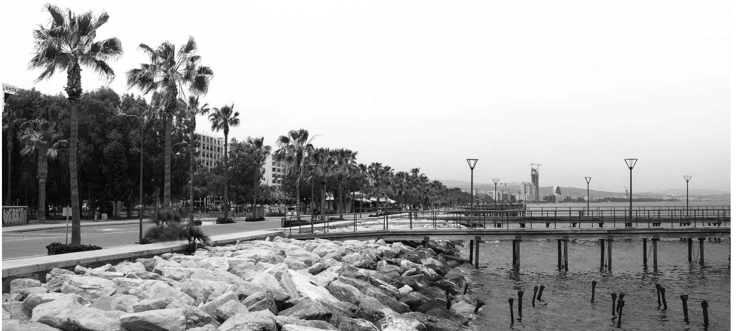
Εικόνα 1: Η υφιστάμενη εικόνα της Επαρχίας Λεμεσού.

Η αστική ανάπτυξη άλλαξε τη μορφή και την κλίμακά της. Στο πλαίσιο της διεθνοποίησης των οικονομικών δραστηριοτήτων, τα οικονομικά κέντρα προσείλκυσαν μεγάλα έργα αστικών αναπλάσεων, με σκοπό την ενίσχυση της συμβολικής εικόνας της πόλης και τη δημιουργία ενός επενδυτικά ελκυστικού σε παγκόσμιο επίπεδο αστικού περιβάλλοντος. Αναδύθηκε, έτσι, ένα νέο διεθνές πρότυπο που αποτυπώνει τη σχέση της αστικής οικονομικής ανάπτυξης με το αστικό τοπίο, καθιστώντας τόν αστικό και αρχιτεκτονικό σχεδιασμό, μέσο προσέλκυσης του κεφαλαίου. Η παρούσα ερευνητική εργασία πραγματεύεται τις μεγάλες αστικές αναπλάσεις στη σύγχρονη πολεοδομική πρακτική και το πώς εκφράζονται στο παράκτιο μέτωπο της Λεμεσού, βάσει ευρωπαϊκών προγραμμάτων και ιδιωτικών επενδύσεων.