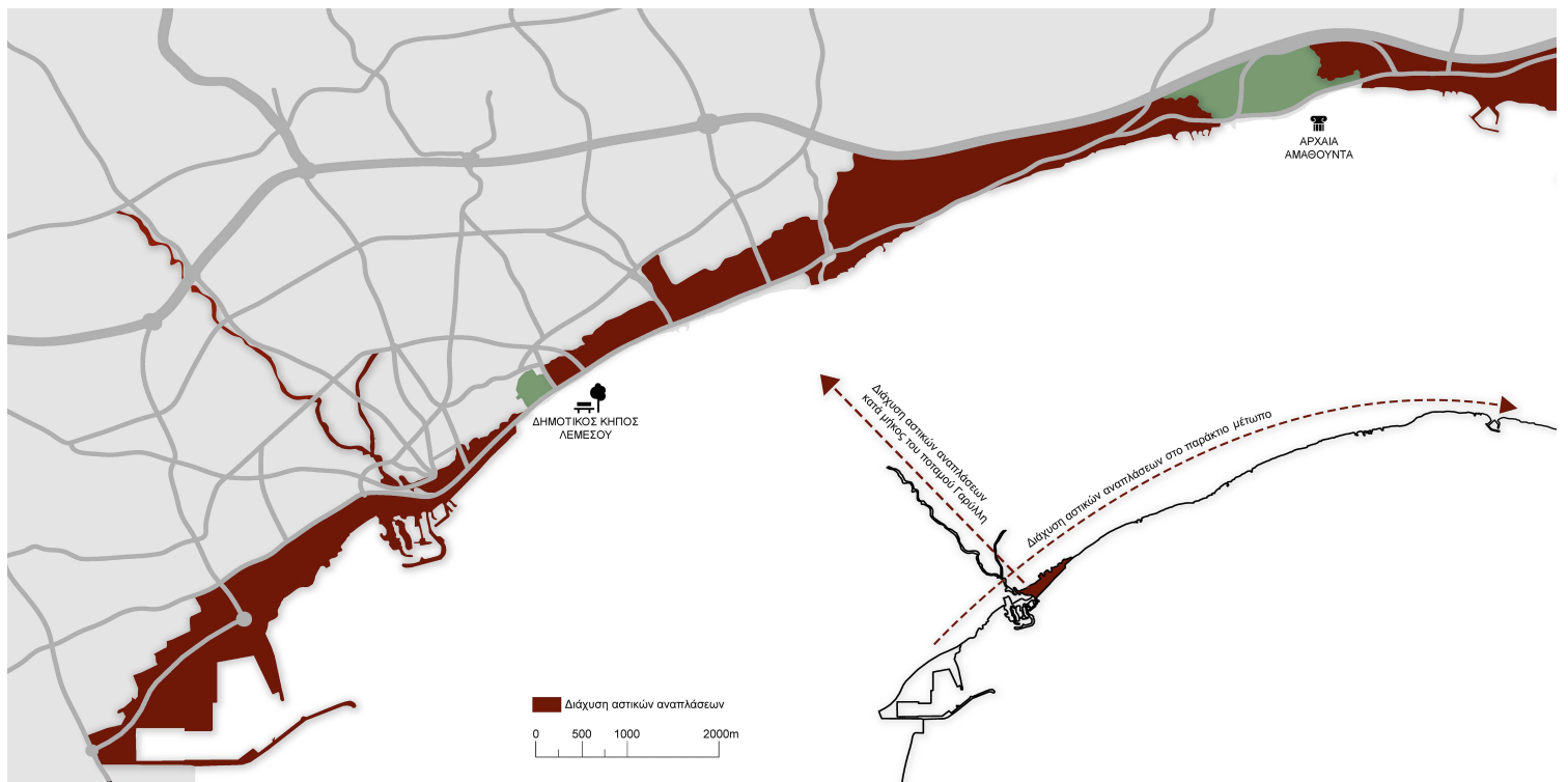
Εικόνα 3: Χάρτης διάχυσης αστικών αναπλάσεων (Πηγή: Δήμος Λεμεσού, 2020 - Ιδία Επεξεργασία).

Σε τρίτο επίπεδο, εμβαθύνουμε στην κοινωνικοοικονομική κατάσταση της Επαρχίας Λεμεσού, μέσα από την ιστορική και πολεοδομική της εξέλιξη και μέσα από στατιστικά στοιχεία. Η εικόνα της Επαρχίας παρουσιάζει ανάκαμψη από την οικονομική κρίση των προηγούμενων χρόνων, αφού διαδραματίζει σημαντικό ρόλο ως πυλώνας οικονομικής ανάπτυξης του νησιού. Το λιμάνι της Επαρχίας Λεμεσού αποτελεί το κεντρικό λιμάνι της χώρας από το 1974 και μετά, γεγονός που, σε συνάρτηση με τη γεωστρατηγική της θέση, την καθιστά διεθνές επιχειρηματικό και ναυτιλιακό κέντρο. Διερευνήσαμε το χαρτογραφικό υλικό, δηλαδή τις επιτρεπόμενες χρήσεις γης, τις πολεοδομικές ζώνες και τα κίνητρα που δίνονται στο Τοπικό Σχέδιο Λεμεσού, καθώς και τα διατηρητέα κτήρια που εμφανίζονται στο Σχέδιο Περιοχής Κέντρου, που αφορά το ιστορικό κέντρο. Αναλύθηκαν οι τροποποιήσεις που πραγματοποιήθηκαν στο υφιστάμενο ΤΣΛ, ως απόρροια ενός ευέλικτου αστικού σχεδιασμού, με στόχο την ανέγερση έργων και την προσέλκυση ξένου κεφαλαίου.