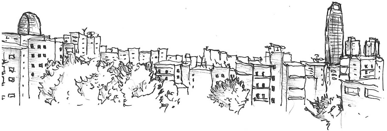
Εικόνα 4: Αποψη της υφιστάμενης κατάστασης μέσα από την πόλη.

Σε τέταρτο και τελευταίο επίπεδο, αναλύσαμε τα έργα που υλοποιήθηκαν βάσει ευρωπαϊκών πολιτικών, κατά την προηγούμενη, την υφιστάμενη και την επερχόμενη προγραμματική περίοδο. Επίσης, αναλύσαμε την αρχή της διαδικασίας των μεγάλων αστικών αναπλάσεων, με την εμφάνιση του πρώτου ψηλού κτηρίου, που αποτέλεσε το έναυσμα για την υιοθέτηση του νέου αναπτυξιακού προτύπου στον Δήμο Λεμεσού, καθώς και την κοινωνικοοικονομική κατάσταση της περιόδου. Ακολούθως, διερευνήσαμε την επιλογή της χωροθέτησης των ψηλών κτηρίων στον Δήμο, παρατηρώντας την ένταση που παρουσιάζει το φαινόμενο κυρίως επί του παράκτιου μετώπου. Διακρίναμε τις χωροκοινωνικές επιπτώσεις και ασυνέχειες των αστικών αναπλάσεων στα χαμηλά οικονομικά στρώματα, και την κυριαρχία του ιδιωτικού τομέα στην πολεοδομική πρακτική στο σύνολο του Δήμου, και κατ' επέκταση της Επαρχίας.