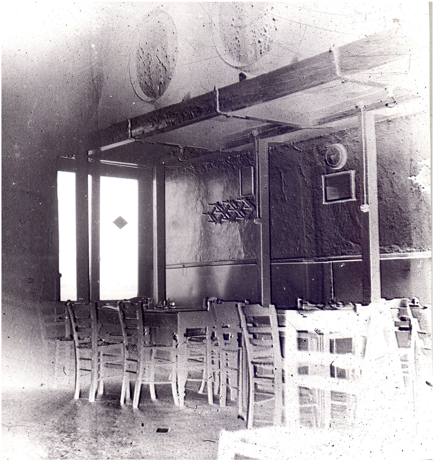
Η ψαροταβέρνα του Σαβούρα, σκοτεινή, με τα κρασοβάρελά της. Στην απέναντι πλευρά προς την έξοδο ήταν η μαντεμένα εστία που ψήνονταν τα θαλασσινά.