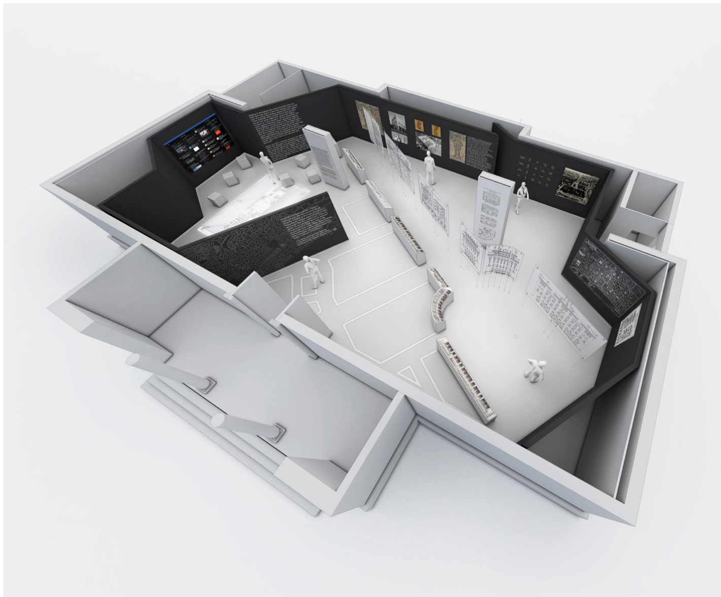
Ενδεικτική γενική διάταξη περιπτέρου στη Βενετία