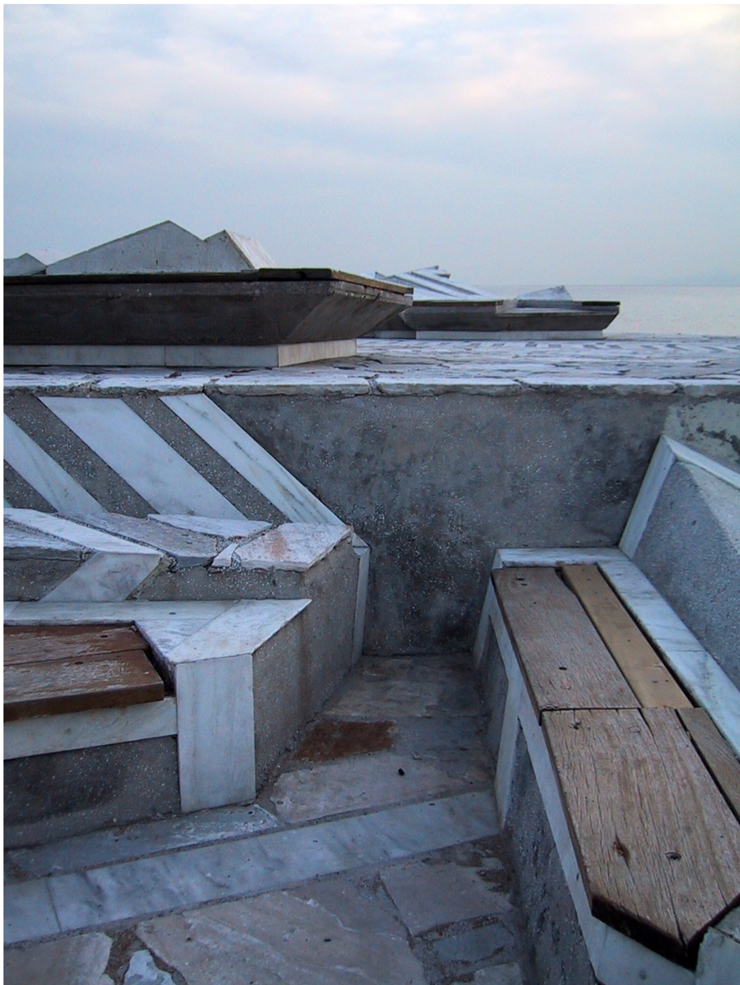
Δεκέμβριος 2007