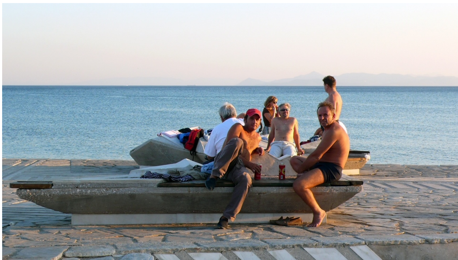
Φωτογραφία: Μανώλης Ηλιάκης, Αύγουστος 2008

Οι επισκέπτριες / επισκέπτες θα μπορούσαν να θυμηθούν τη μυθική μορφή της Αμφιτρίτης και να φανταστούν τον Ποσειδώνα να μεταβάλλει με την τρίαινά του τον παφλασμό των κυμάτων και τον ουρανό. Το αέναα μεταβαλλόμενο φυσικό τοπίο είναι μέρος των διαμορφώσεων και τις κάνουν να μην φαίνονται ποτέ ίδιες. Αναδιπλώνουν τις ιδιαίτερες ποιότητες των υφών και των χρωμάτων που αποκτούν μέσα στη μέρα και στις διαφορετικές εποχές.