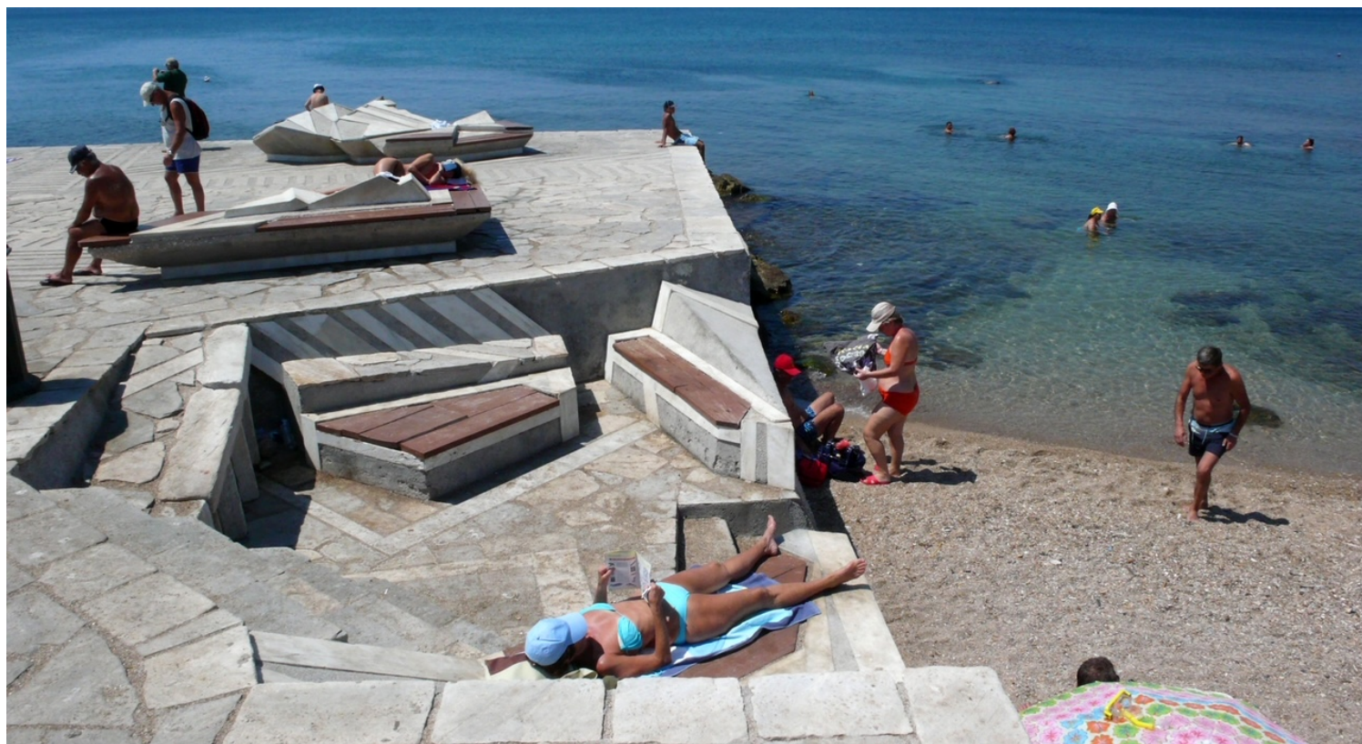
Ιούλιος 2007