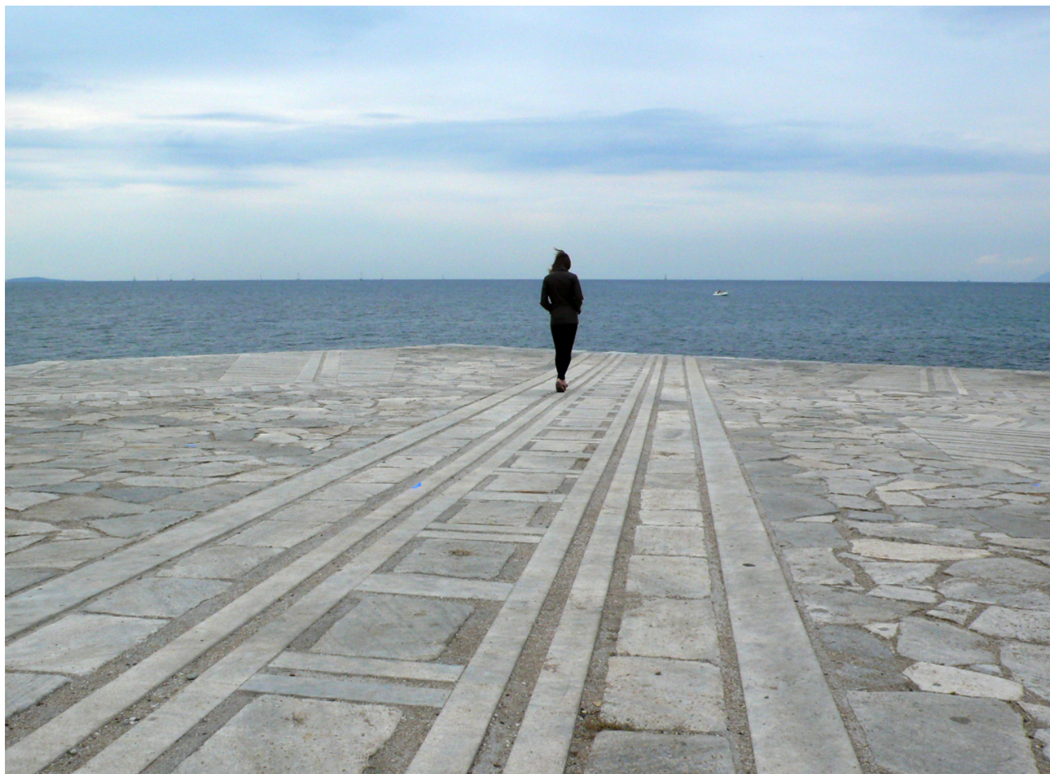
Σκηνή από τη βίντεο-εγκατάσταση «in between», 2008. Performer: Ιωάννα Τουμπακάρη