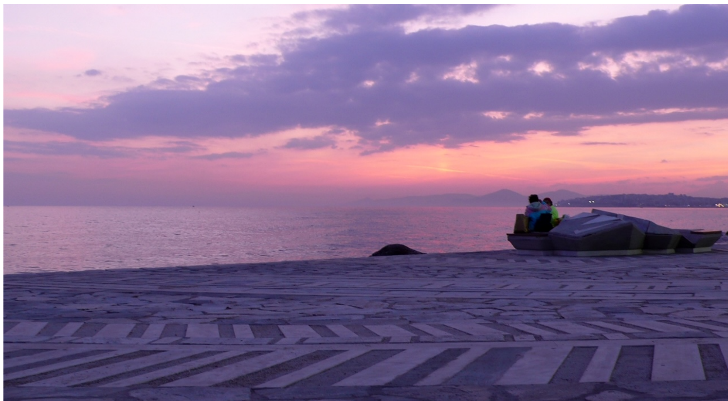
Φωτογραφία: Μανώλης Ηλιάκης, Μάιος 2009

Η αρμονική συνύπαρξη της τέχνης με το τοπίο (φυσικό - ανθρωπογενές) και τον άνθρωπο απασχολεί τη Νέλλα Γκόλαντα σε όλα της τα έργα. Στη Γλυπτή Προκουμαία Φλοίσβου το καταφέρνει αυτό με έναν συγκινητικό τρόπο. Ο άνθρωπος γίνεται μέρος της τέχνης της, μιας και αυτή έχει εφαρμοσμένο ή αρχιτεκτονικό χαρακτήρα.