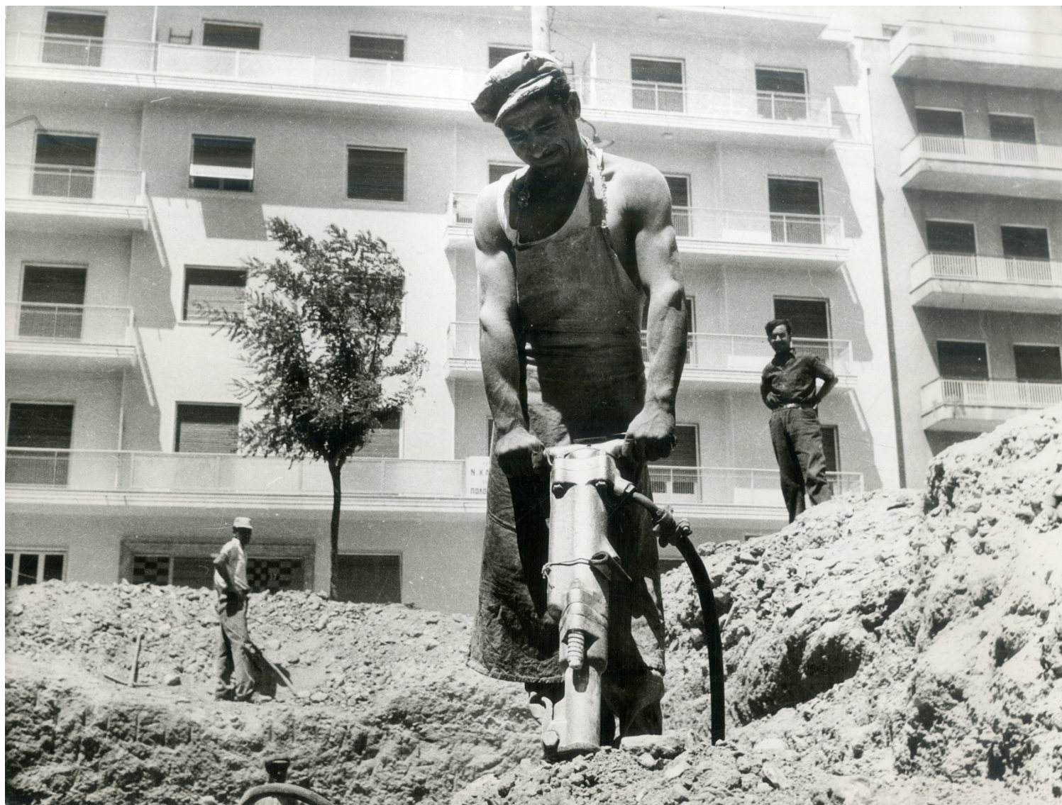
Εικ.1. Κτίστες εργαζόμενοι στην ανέγερση πολυκατοικίας. Αθήνα, αρχές της δεκαετίας του 1950.