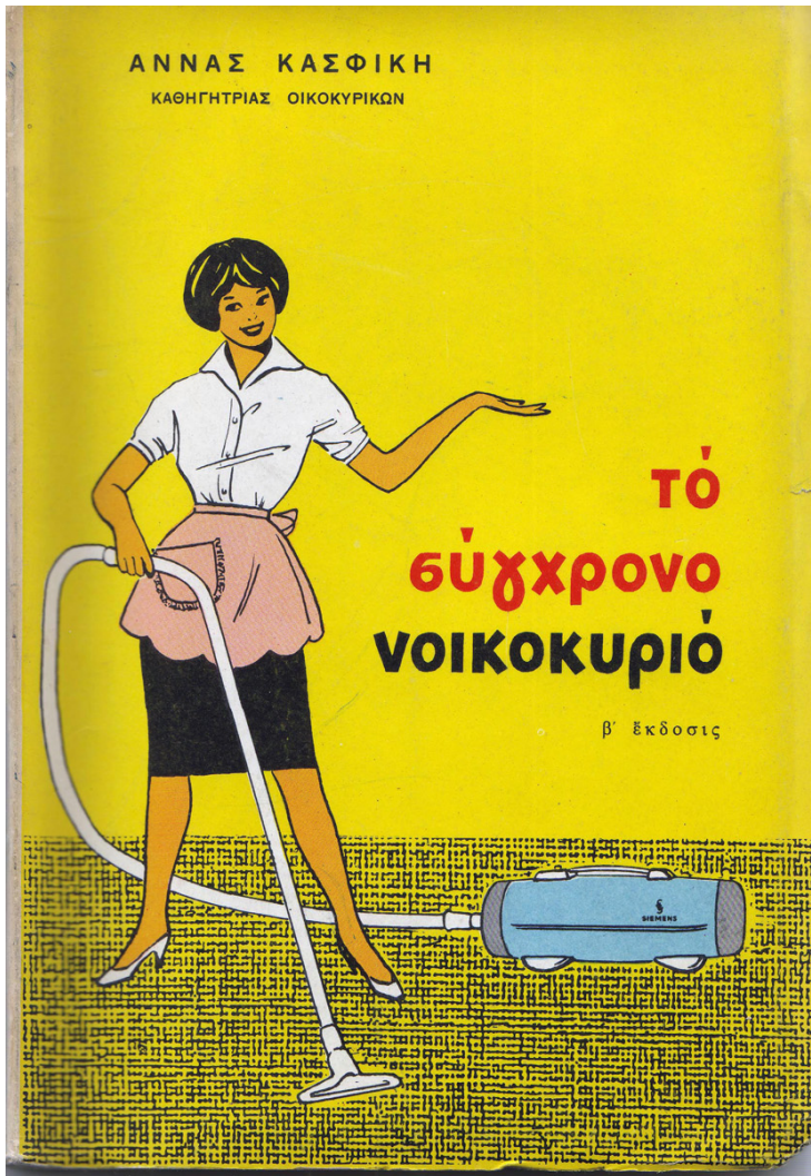
Εικ. 2. Εξώφυλλο και σελίδα από Το σύγχρονο νοικοκυριό της Άννας Κασφίκη, καθηγήτριας οικοκυρικών (1958).

εμπειροτεχνίτες του μεσοπολέμου και στη συνέχεια στους υπομηχανικούς τον κύριο ρόλο στη μεγάλη ανοικοδόμηση. Η εμπειρική διάδοση των κατασκευαστικών γνώσεων και η γενικότερη κυριαρχία της προφορικής κουλτούρας που χαρακτήριζε τον νέο αθηναϊκό πληθυσμό καθώς κατέφθανε μαζικά από την ύπαιθρο, συνέβαλαν στον εκτοπισμό των αρχιτεκτόνων, μηχανικών και πολεοδόμων από τους μηχανισμούς παραγωγής της ελληνικής πόλης. Η προσέγγιση της Θεοχαροπούλου οδηγεί σε ιδιαίτερα ενδιαφέροντα συμπεράσματα τα οποία δεν περιορίζονται στην κατανόηση των συνθηκών δημιουργίας κι εξάπλωσης της πολυκατοικίας της αντιπαροχής. Η ιστορία των "κτιστών" και των "νοικοκυρών" βοηθά τον αναγνώστη να κατανοήσει όχι μόνο τα αίτια της δυσλειτουργίας της πολεοδομίας στην Αθήνα αλλά και ορισμένες κρίσιμες στιγμές της ελληνικής ιστορίας του 20ου αιώνα.