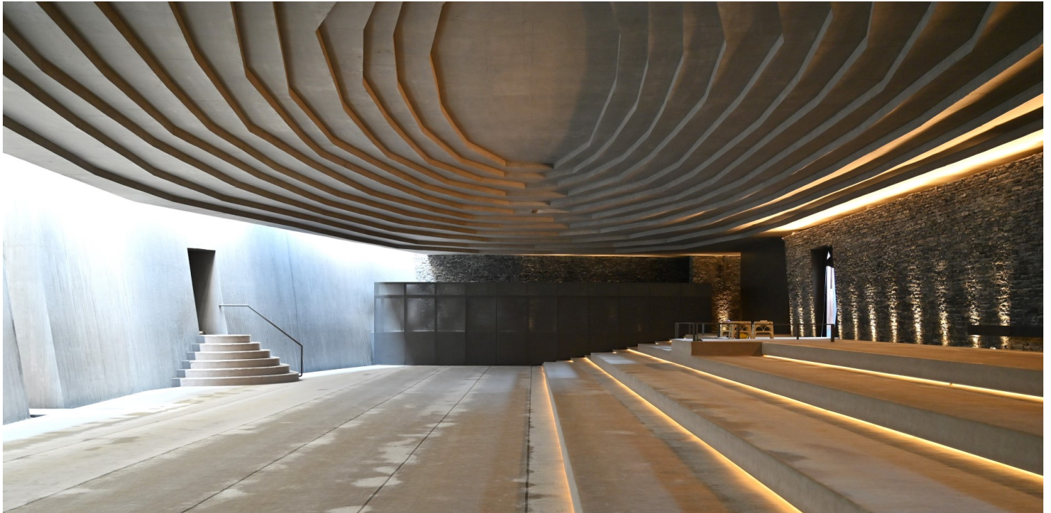
Emre Arolat, Το τζαμί στο Sancaklar, 2012. Είσοδος στο τέμενος και εσωτερικό.

εκκλησία είναι λίγο σαν να επανασχεδιάζεις τη θρησκεία, σαν να επαναπροσδιορίζεις την ουσία της». Ο ίδιος ο Arolat με διαβεβαίωσε ότι, αν το 2012 ήταν ακόμη δυνατή στην Τουρκία η υλοποίηση ενός τζαμιού όπως αυτό, τούτο σήμερα θα έβρισκε μεγαλύτερες αντιστάσεις λόγω του αυξανόμενου ισλαμικού φονταμενταλισμού.