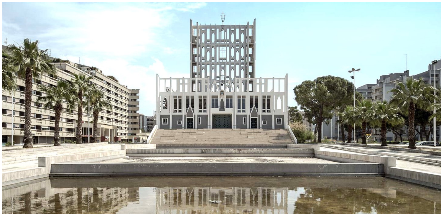
Gio Ponti, Καθεδρικός της Μεγάλης Μητέρας του Θεού, Τάραντας, 1967-70.