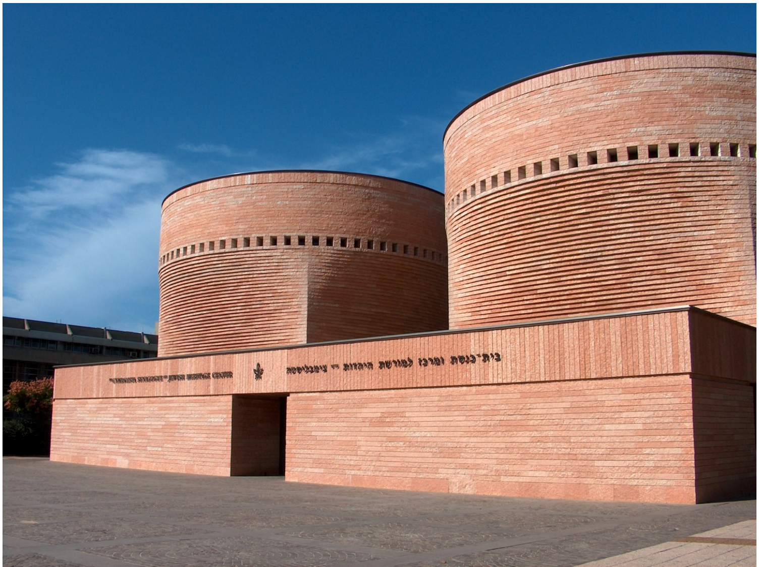
Mario Botta, Συναγωγή στο Τελ Αβίβ, 1998.

Στο περιβάλλον ωστόσο της ορθόδοξης εκκλησίας, τα πράγματα είναι πολύ διαφορετικά. Επαναλαμβάνεται έως τις μέρες μας ένας μιμητικός (και δομικά σκηνογραφικός) τύπος κτιριακού κελύφους, που υποτίθεται ότι ανταποκρίνεται σε δεδομένα πρότυπα, παρά το γεγονός ότι στη διάρκεια των αιώνων η βυζαντινή ναοδομία είχε πειραματικό χαρακτήρα και επεξεργαζόταν μεγάλη ποικιλία χωρικών και μορφοπλαστικών λύσεων, ενώ δεχόταν ξένες επιρροές. Το πρόβλημα είναι σύνθετο από θεολογική άποψη και από εκείνη του λειτουργικού τυπικού. Δεν πρόκειται όμως μόνο γι' αυτό. Σχετίζεται με μια στάση αμυντικής εσωστρέφειας, με ένα οντολογικό ζήτημα αυτόνομης ύπαρξης της ορθόδοξης εκκλησίας στον σύγχρονο κόσμο. Έχει να κάνει, για να συνοψίσουμε σύμφωνα με τον Χρήστο Γιανναρά, με τη διατήρηση της ιστορικής αντιπαλότητας δύο κοσμοθεωριών: του «ελληνικού κοινωνιοκεντρικού» και του «μεταρωμαϊκού ατομοκεντρικού παραδείγματος». Ο ίδιος, ωστόσο, εντίμως αναγνώριζε ότι «τον λατρευτικό χώρο τον διαμορφώνει το “νόημα” των τελουμένων στη λατρεία». Θα ήταν ίσως καιρός να ανοίξει μια συζήτηση για τον επαναπροσδιορισμό του αρχιτεκτονικού χώρου της ορθόδοξης λατρείας γιατί, όπως έλεγε ο Φώτης Κόντογλου, «η στείρα αντιγραφή είναι ασέβεια».