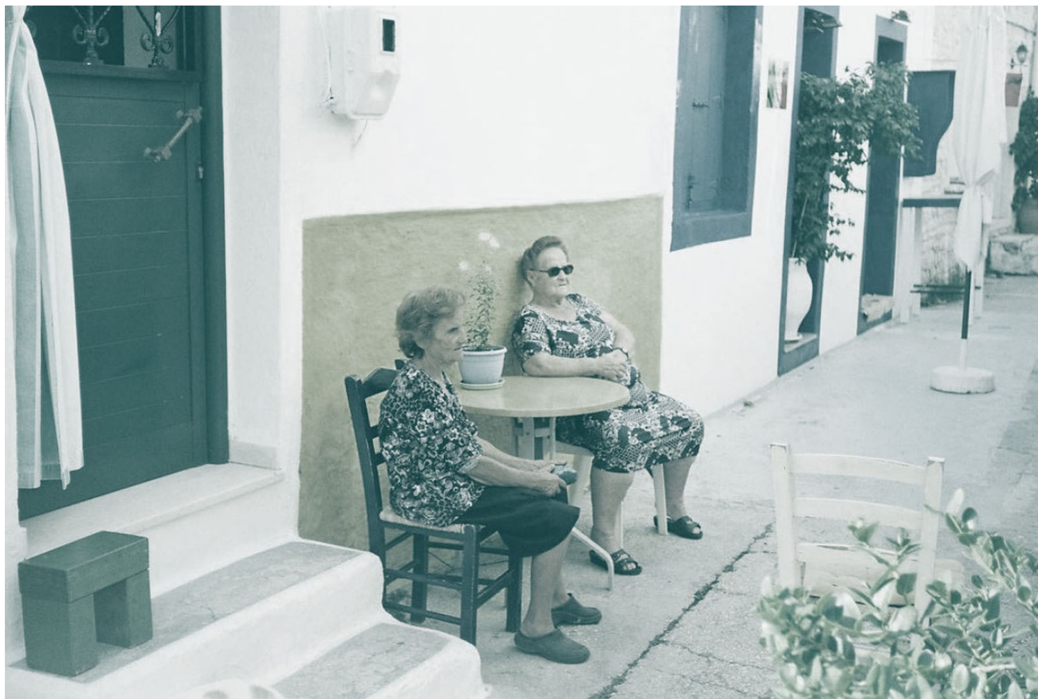
Ενδιάμεσος χώρος προς αξιοποίηση | Ηρώ Γκριμπίζη