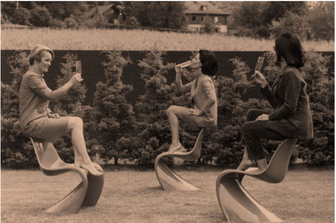
Panton chair, στατικός έλεγχος