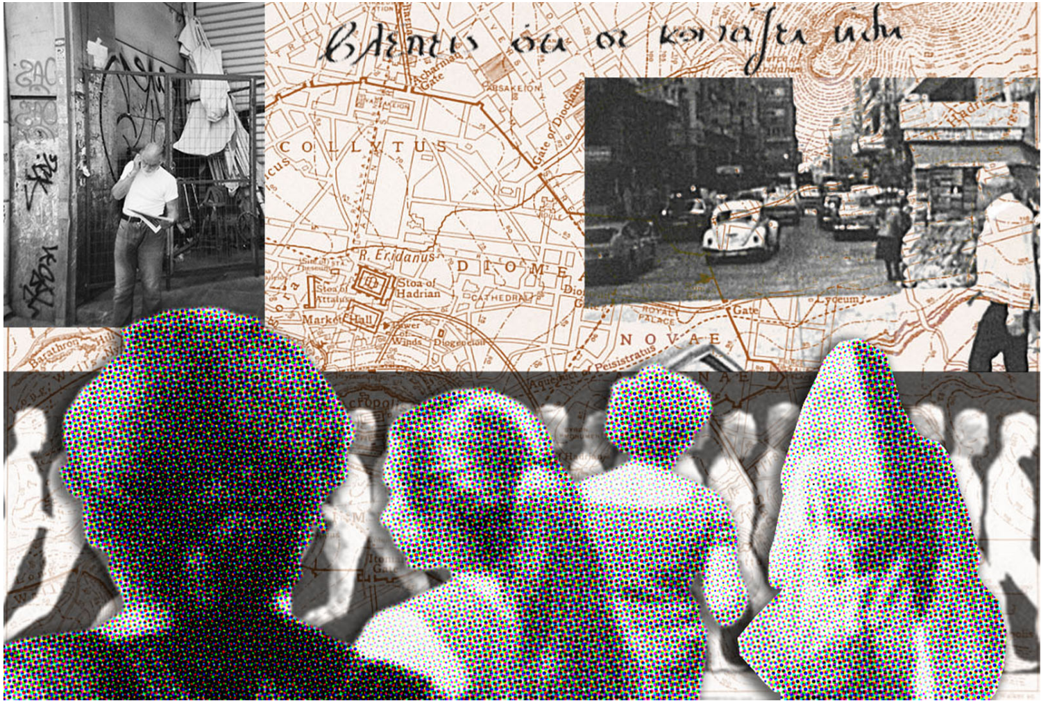
The practise of walking | Κολάζ από προσωπικό αρχείο

πλαστικές καρέκλες αποτελούν μικρά θραύσματα που σχεδόν περνούν απαρατήρητα και όμως πολλαπλασιάζονται καθημερινά και συγκροτούν εφήμερα σκηνικά στους δρόμους της πόλης.