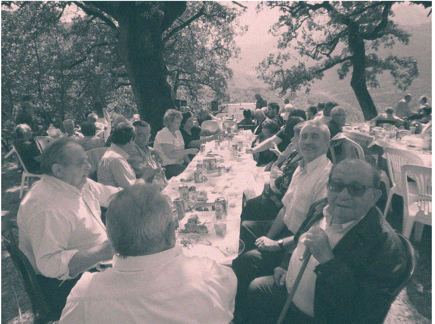
Η συμποσιακή φύση της κατανάλωσης στο πανηγύρι

Στα πλαίσια μιας προσπάθειας εντοπισμού και μελέτης στοιχείων της υλικής κουλτούρας, αναλύονται οι σημασιολογικές προεκτάσεις της πλαστικής καρέκλας. Περνώντας στη μικροκλίμακα του αντικειμένου, η πλαστική μονομπλόκ καρέκλα συνδυάζει το καθημερινό, το ανώνυμο, το ευτελές και το λαϊκό στοιχείο. Επιζητώντας μια προσέγγιση του πνεύματος της σύγχρονης ελληνικής πόλης, με τις αντιφάσεις της, τα ετερόνυμα στοιχεία που διαπλέκονται, συνδέονται και απωθούνται, στοιχεία ενός παραδοσιακού παρελθόντος και ενός πιο σύγχρονου παγκοσμιοποιημένου παρόντος, στην πλαστική καρέκλα εντοπίζονται όλα αυτά τα στοιχεία του σύγχρονου υλικού πολιτισμού. Ακόμα, το ενδιαφέρον επικεντρώνεται στις χρήσεις της, επίσημες και ανεπίσημες-ανώνυμες, και στη δευτερεύουσα παραγωγή που κρύβεται στη διαδικασία αξιοποίησης του προϊόντος. Οι ανώνυμες, αυθόρμητες εκδηλώσεις του κοινού συνιστούν μια μορφή άτυπης αντίστασης στους εδραιωμένους θεσμούς της πόλης και εκφράζουν τη μικρο-πολιτική της καθημερινότητας. Έτσι, επιδιώκεται μια προσπάθεια αναγνώρισης της πλούσιας στρωματογραφίας αυτών των τόσο ταπεινών γεγονότων της πόλης. Με εστίαση στο έργο του M. de Certeau, αναλύονται οι επιτελεστικές πράξεις και πρακτικές της καθημερινής ζωής, οι οποίες λαμβάνουν χώρα στον δημόσιο χώρο και επαναπροσδιορίζουν τη σχέση του κοινωνικού συνόλου με αυτόν.