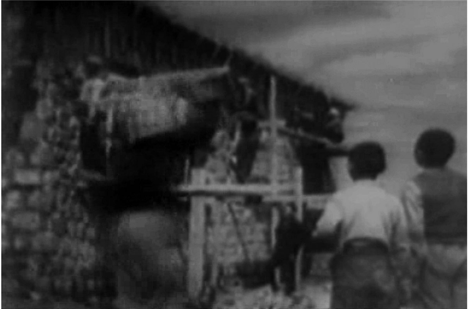
(Εικ.1) Ανοικοδόμηση αγροτικών οικισμών. Απόσπασμα από το φιλμ The Marshall Plan at Work in Greece , 1950

αγροτικών οικισμών. Ο εκφωνητής πληροφορεί σχετικά: «δεν υπάρχει τίποτα πιο θηριώδες από τον ανταρτοπόλεμο και τον Εμφύλιο». Τα χωριά είναι καμένα και πλήρως γκρεμισμένα, μας λέει ο εκφωνητής και επαληθεύουν τα σχετικά πλάνα. Αλλά, «οι οικογένειες έχουν ακόμα ελπίδα και κουράγιο και ακόμα και με τα γυμνά τους χέρια κοπιάζουν για αυτά που επιθυμούν» -το τέλος του χάους για μια «αξιοπρεπή [decent] ειρηνική ζωή». Και στο επόμενο πλάνο (μετά το οποίο η μουσική γίνεται εύθυμη, σχεδόν πανηγυρική), ένα κλιμάκιο ειδικών του σχεδίου Marshall, καταφθάνει με τα σχέδια ανά χείρας. Στους κατοίκους των κατεστραμμένων ελληνικών χωριών, που είναι, επισημαίνει με έμφαση ο εκφωνητής, έτοιμοι να ξαναχτίσουν οι ίδιοι τα σπίτια τους, παρέχονται δωρεάν οικοδομικά υλικά που δεν μπορούν να εξασφαλιστούν από τις τοπικές αγορές (εικ.1). «Ακόμα και τα παιδιά», κλείνει η αφήγηση, «έχουν επιστρατευθεί για να βοηθήσουν να ξαναχτιστούν τα σχολεία τους». 2