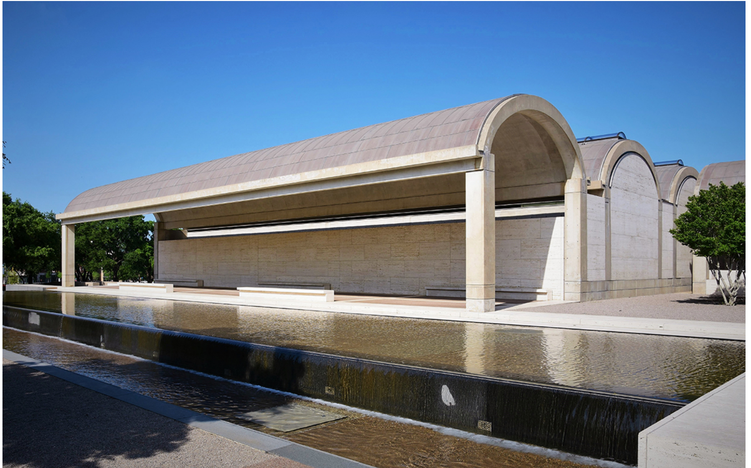
Louis Kahn, Μουσείο Kimbell στο Fort Worth, Τέξας, 1966-1972