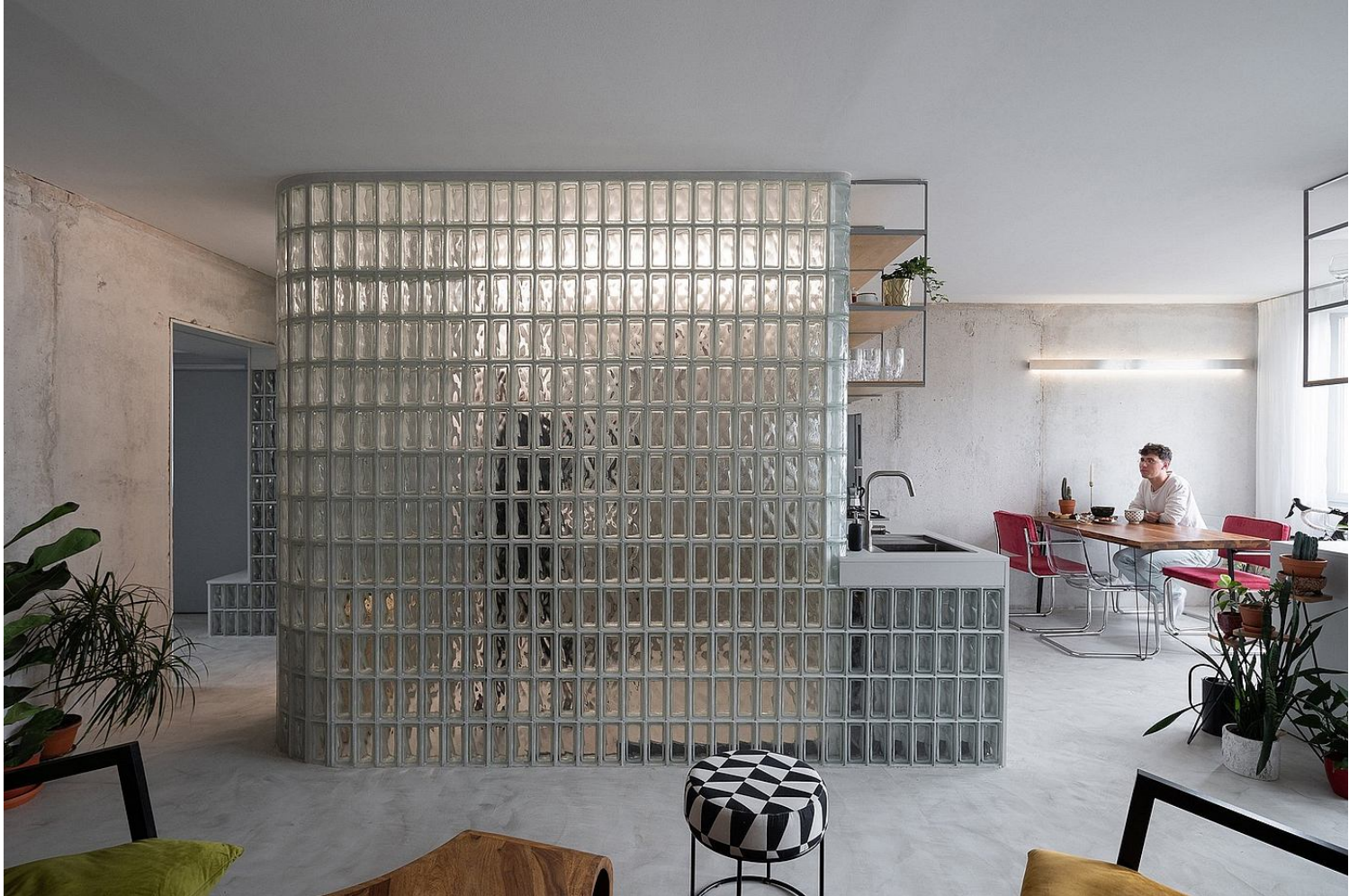
Apartment with Glass Block Walls in Prague, Czech Republic, showcases the impressive talents of Papundekl Architekti

Ας επαναπροσδιορίσουμε την έννοια του αρχιτεκτονικού χωρίσματος. Ναι, θέλουμε απομόνωση και ησυχία, αλλά αυτό μπορεί να επιτευχθεί με πολλούς τρόπους πέρα από τον συμβατικό τοίχο ή τη γυψοσανίδα. Το υαλότουβλο , ένα πολύ αγαπημένο υλικό, έχει μεγάλη εφαρμογή το τελευταίο διάστημα ως διαχωριστικό χώρων. Με πολύ μεγάλη αποδοτικότητα σε ηχοαπορρόφηση και ηχομόνωση, προσφέρει την ίδια λειτουργικότητα με έναν συμβατικό τοίχο, δημιουργώντας όμως παράλληλα και μια ζωντανή ευήλια όψη. Πέρα από το υαλότουβλο, βλέπουμε επίσης και μεγάλη εφαρμογή σε γυάλινα πάνελ, κουρτίνες, διάτρητες επιφάνειες και γενικά πειραματισμό σε υλικότητες και υφές στον τομέα των χωρισμάτων.