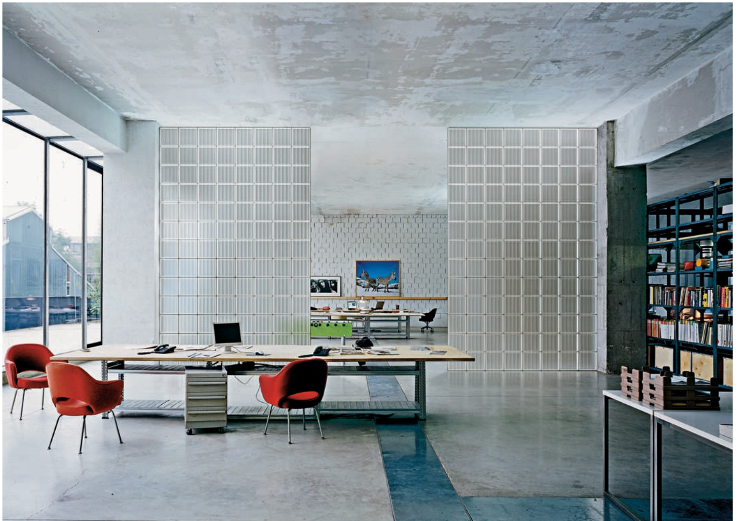
Office interior with glass brick walls