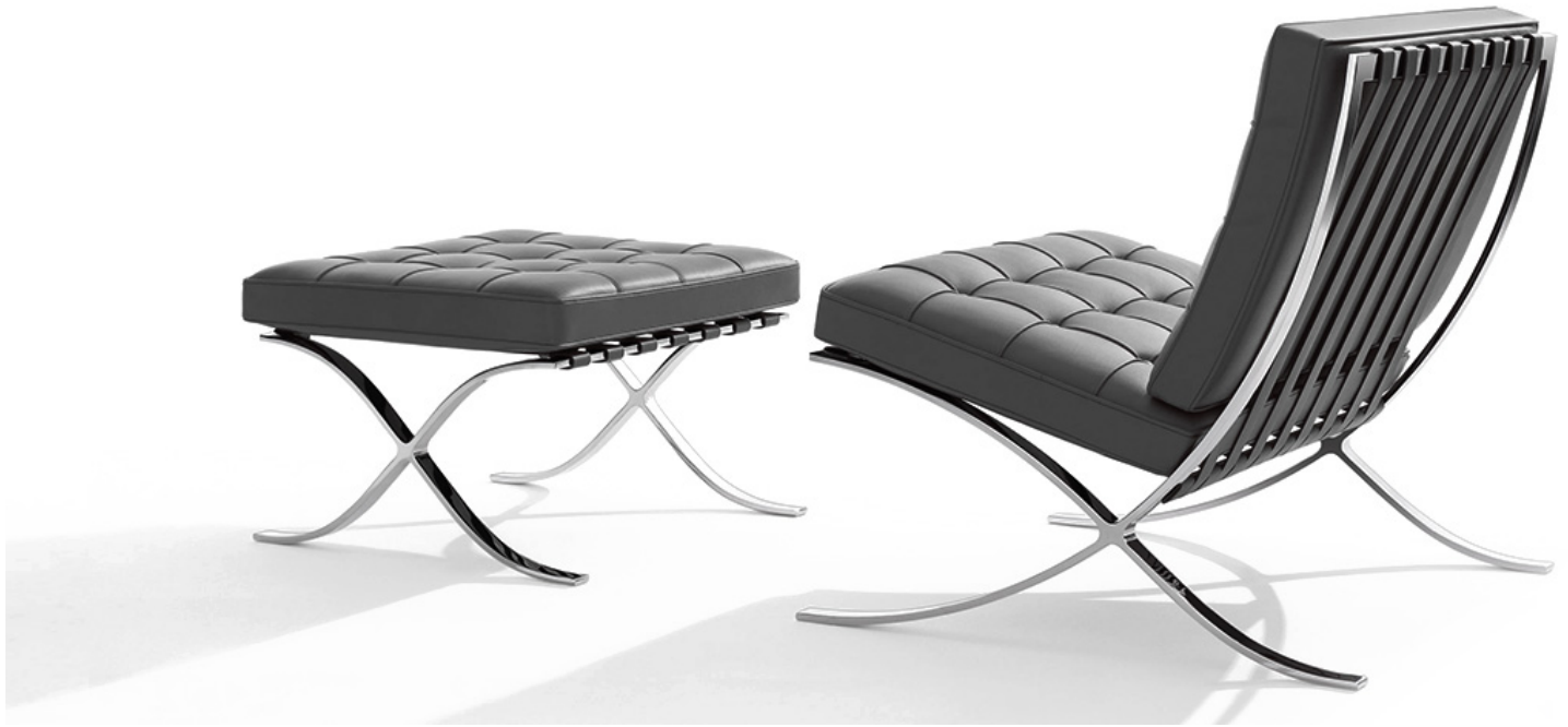
Bauhaus πολυθρόνα με υποπόδιο