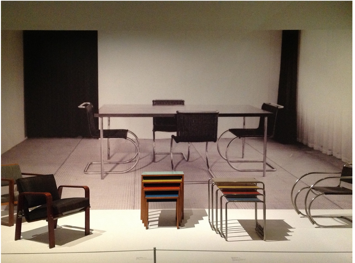
Έκθεση bauhaus επίπλων

Είναι καιρός να αφήσουμε πίσω την έντονη διαμερισμάτωση και τα υπερφορτωμένα εσωτερικά χώρων. Ενιαίοι χώροι με καθαρές γραμμές, μεγάλα ανοίγματα και χώροι που είναι πολυμορφικοί και πολυχρηστικοί. Σπίτια loft, ενιαίοι χώροι, σαλόνια που είναι και υπνοδωμάτιο και μπάνιο και βιβλιοθήκη. Γιατί όχι; Είναι καιρός να ρίξουμε τους τοίχους της αθηναϊκής κατοικίας και να δημιουργήσουμε ενιαίους, φωτεινούς, δημιουργικούς χώρους. Ένας καναπές, ένα τραπέζι, ένα φυτό, ένα χαλί και ένα κρεβάτι, δε χρειάζονται παραπάνω. Άσε επίσης τα δοκάρια και τα υποστύλωμα να φανούν, και σε περίπτωση που δεν είναι ωραία, μάλλον είναι κάποιου άλλου το λάθος και όχι δικό σου. Οι ψευδοροφές και οι κρυφοί φωτισμοί δε χρειάζεται να είναι παντού, αρκούν στο μπάνιο και την κουζίνα.