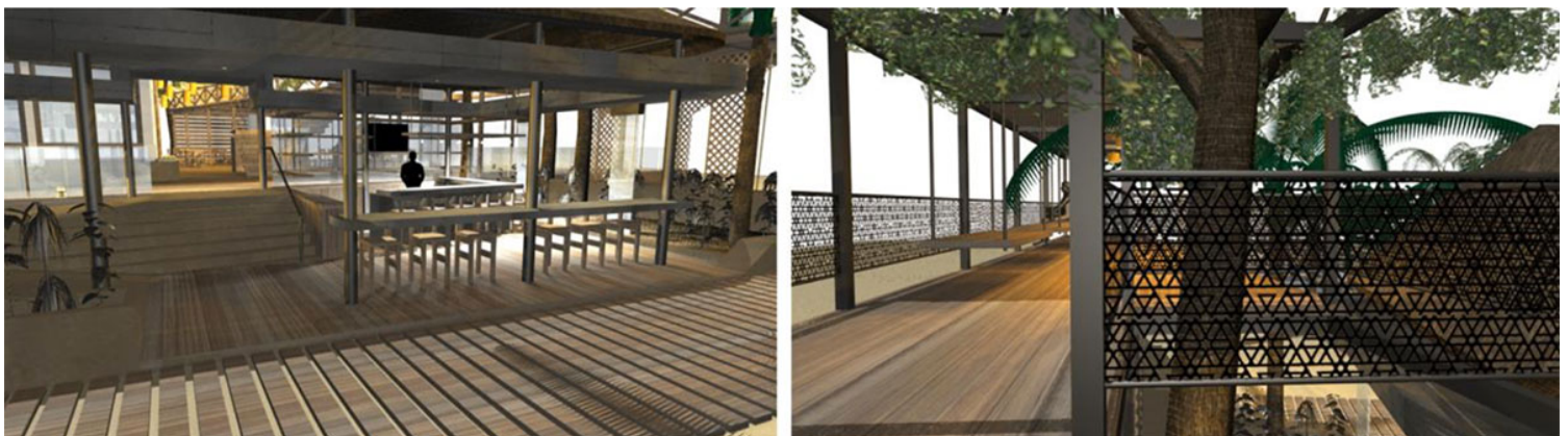
Εικ. 14. Φωτορεαλιστική απεικόνιση αρχικής πρότασης για bar-lounge του Sunset Bungalows (Μάρτιος 2014) Εικ. 15. Φωτορεαλιστική απεικόνιση αρχικής πρότασης για καθιστικό παρατήρησης ηλιοβασιλέματος του Sunset Bungalows (Μάρτιος 2014)

Για τους επόμενους μήνες πίσω στην Σουηδία, μαζί με τη διπλωματική, φέραμε εις πέρας και τη μελέτη εφαρμογής για το πρώτο αληθινό μας έργο, βασιζόμενες στο λόγο ενός αγνώστου που βρισκόταν στην άλλη άκρη της γης και που είχαμε συναντήσει μόνο δύο φορές στη ζωή μας.