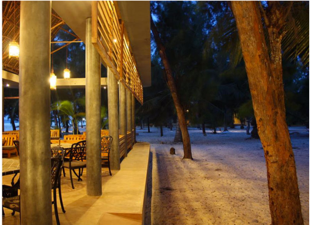
Εικ. 25, 26. Το bar-lounge ολοκληρωμένο (Δεκέμβριος 2014)