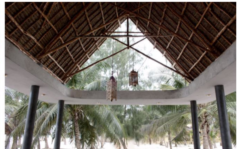
Εικ. 27. Το bar-lounge ολοκληρωμένο (Δεκέμβριος 2014) Εικ. 28. Το bar-lounge ολοκληρωμένο. Η υδρορορή parapata και η οροφή makuti (Δεκέμβριος 2014)