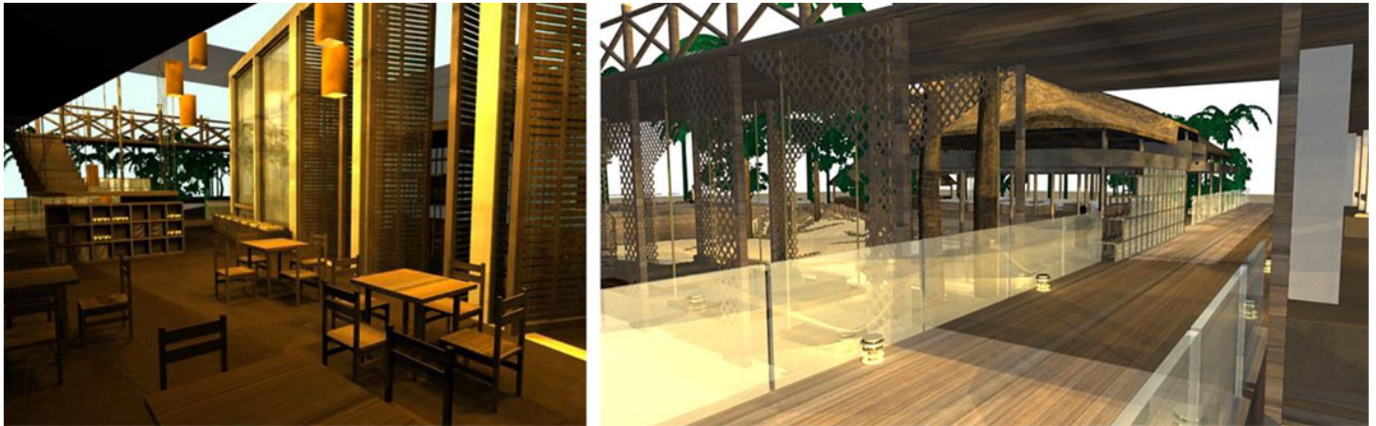
Εικ. 12. Φωτορεαλιστική απεικόνιση αρχικής πρότασης για εστιατόριο του Sunset Bungalows (Μάρτιος 2014) Εικ. 13. Φωτορεαλιστική απεικόνιση αρχικής πρότασης για bar-lounge του Sunset Bungalows (Μάρτιος 2014)