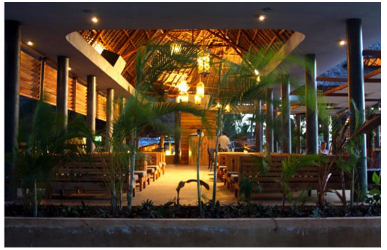
Εικ. 23, 24. Το bar-lounge ολοκληρωμένο (Δεκέμβριος 2014)