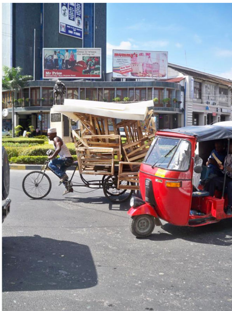
Εικ. 1, 2. Σκηνές από δρόμους του Dar es Salaam (Φεβρουάριος 2013)

Αυτό που μου έκανε πιο μεγάλη εντύπωση ήταν η αίσθηση ότι ο κόσμος που έβλεπα στο δρόμο ήταν σαν να μη ταίριαζε με τα σύγχρονα, μεγαλεπήβολα κτίρια της πόλης. Στα δικά μου μάτια, φαινόταν ότι οι ρυθμοί της ανάπτυξης της πόλης ήταν τόσο ραγδαίοι, ώστε οι άνθρωποί της δεν προλάβαιναν να τους ακολουθήσουν.