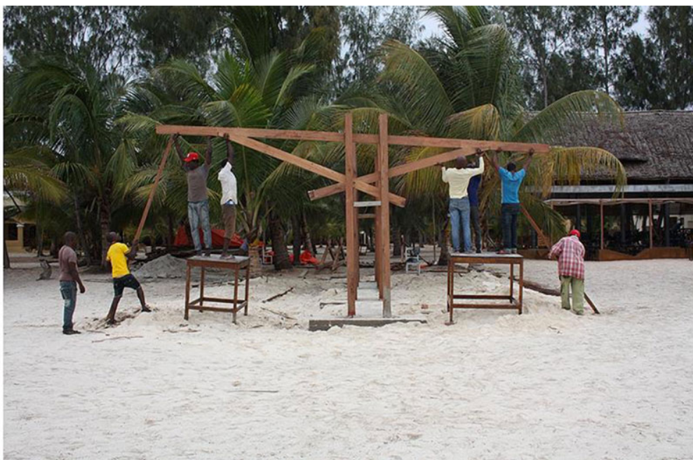
Εικ. 18. Φωτογραφία τραβηγμένη από ξυλουργό μας: κατασκευή υποστυλωμάτων του beach bar (Απρίλιος 2015) Εικ. 19. Συνεργασία για την τοποθέτηση του σκελετού για την κατασκευή του beach bar (Απρίλιος 2015)