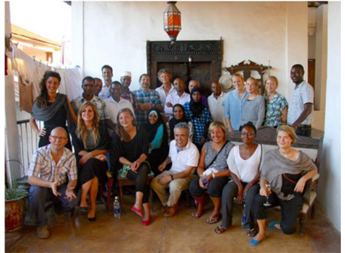
Εικ. 21. Η ομάδα των ξυλουργών μας σε καινούρια συνεργασία Ng'ambo tuitakayo (Ιούνιος 2016) Εικ. 22. Η ομάδα καταγραφής της αρχιτεκτονικής και πολιτιστικής κληρονομιάς της Ng'ambo (Δεκέμβριος 2015)