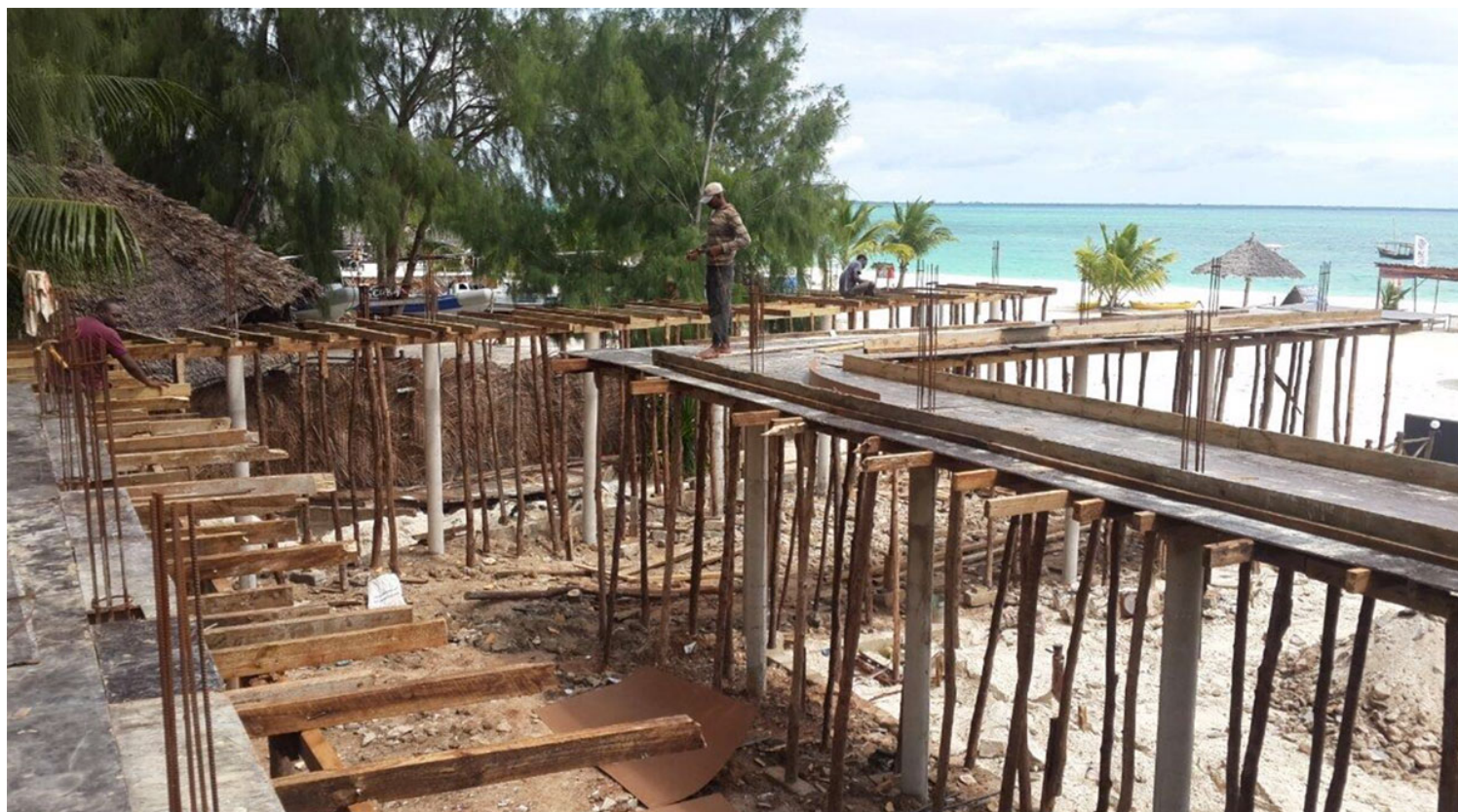
Εικ. 16. Εργασίες ανοικοδόμησης Sunset Bungalows (Ιούνιος 2014)

Η κατασκευή, όπως και ο σχεδιασμός του έργου αυτού, ήταν από την αρχή μια σειρά από επάλληλες συναρπαστικές προκλήσεις. Οι επιθυμίες του πελάτη ήταν φιλόδοξες και απαιτητικές, η τοποθεσία ευαίσθητη, τα μέσα και τα υλικά καινούργια, η γλώσσα άγνωστη, η πορεία τής συνεργασίας μας αβέβαιη, η ιδιότητα, το φύλο, η καταγωγή και η νεαρή ηλικία μας παράγοντες αμφισβήτησης, αλλά πάνω απ' όλα η υπάρχουσα κατάσταση ήταν ήδη υπέροχη.