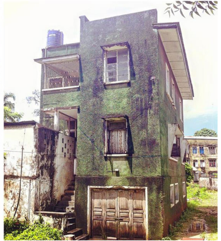
Εικ. 6. Παράδειγμα ζανζιβιανού μοντερνισμού στο Stone Town Εικ. 7. Παράδειγμα ζανζιβιανού μοντερνισμού στο Ng'ambo