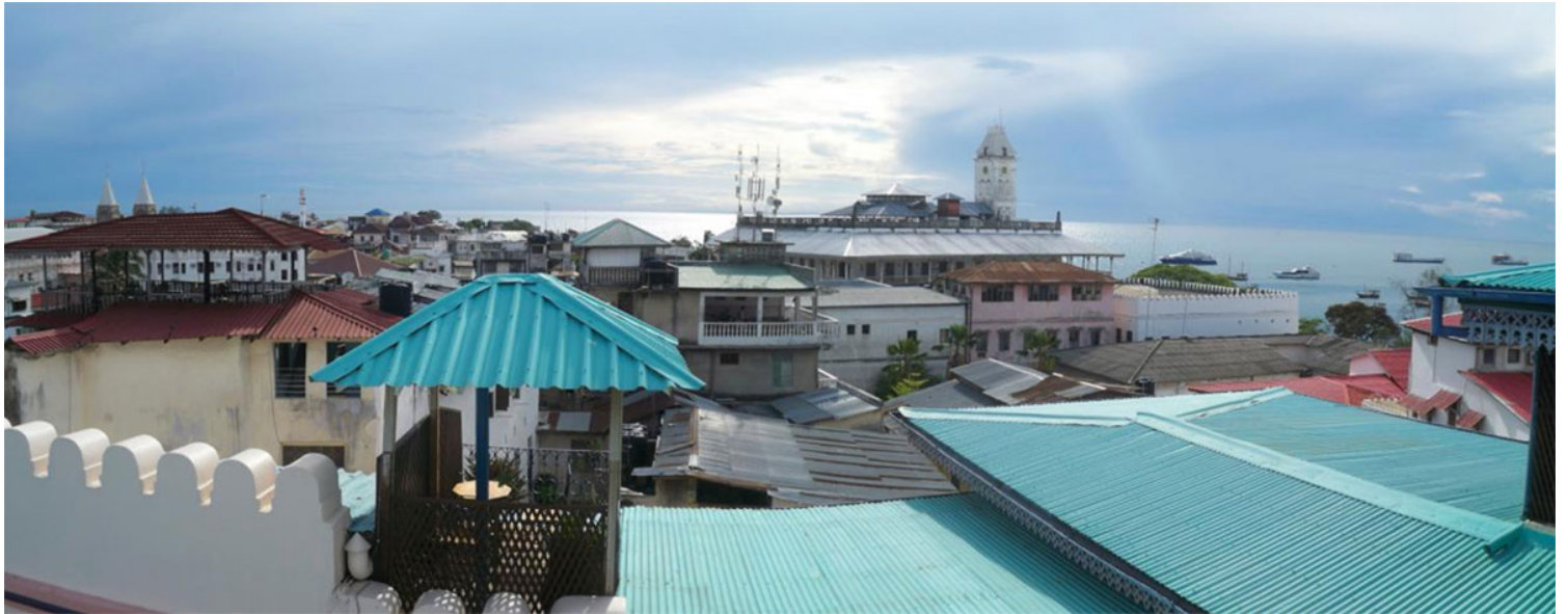
Εικ. 3. Stone Town, πανοραμική φωτογραφία από ταράτσα κτιρίου (Μάρτιος 2013)

Η πρώτη άσκηση που είχαμε να κάνουμε ήταν να ξεχυθούμε για ένα πρωινό στους δρόμους της ιστορικής Stone Town και να επιστρέψουμε με μία ερώτηση. Η παλιά πόλη μου φάνηκε σαν πειρατικός θησαυρός αρχιτεκτονικών θεμάτων. Τα πάντα ήταν ενδιαφέροντα και σημαντικά. Μέχρι και τα καλώδια του ηλεκτρικού ρεύματος! Ω, τόσες ερωτήσεις, αλλά τα κατάφερα να επιστρέψω με μία. Ερχόμενη με παρόμοιες ανησυχίες απ' το παρελθόν, μπόρεσα γρήγορα να διακρίνω τις αυτοσχέδιες παρεμβάσεις των κατοίκων της ιστορικής πόλης. Τελικά, πώς διαχειρίζεσαι την ανάγκη εκσυγχρονισμού μιας ιστορικής πόλης, έχοντας θέσει επίσημα αυστηρούς περιορισμούς διατήρησης της αυθεντικής ιστορικότητάς της;