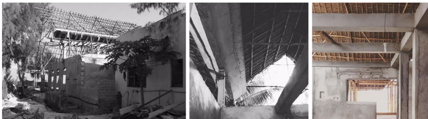
Εικ. 34, 35, 36. Το εστιατόριο υπό κατασκευή (Απρίλιος 2015)