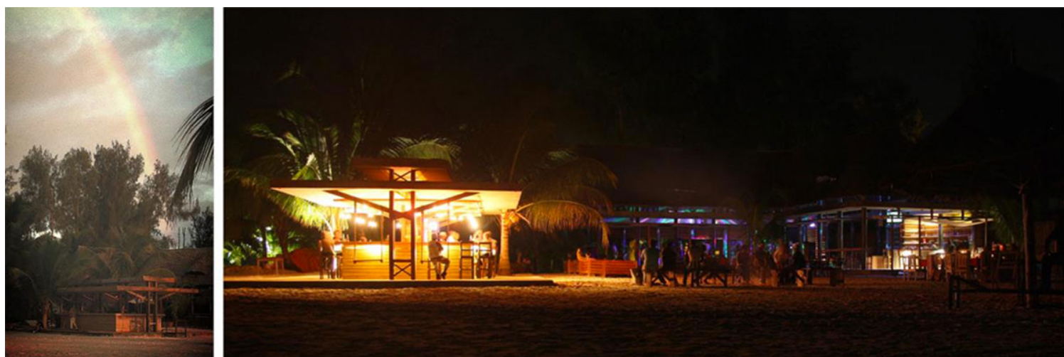
Εικ. 32. Το beach bar υπό κατασκευή (Ιούνιος 2015) Εικ. 33. Το bar-lounge και το beach bar ολοκληρωμένα. Πάρτι εγκαινίων (Μάιος 2015)