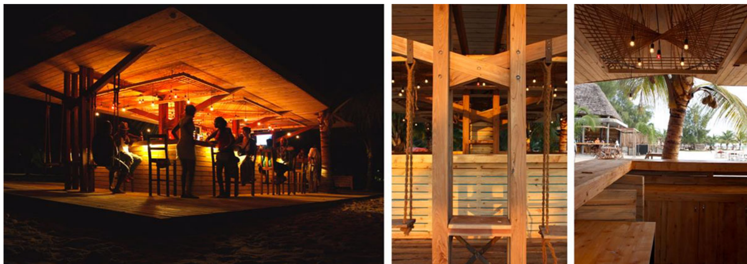
Εικ. 29, 30, 31. Το beach bar ολοκληρωμένο (Μάιος 2015)