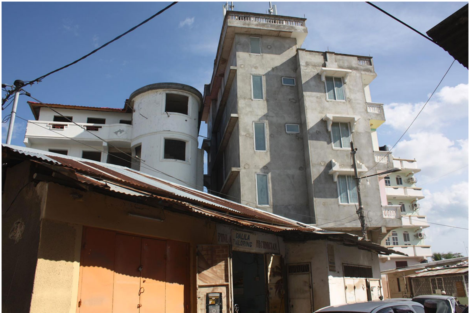
Εικ.10. Προβληματικές σύγχρονης οικοδομικής δραστηριότητας στο Ng'ambo (Νοέμβριος 2013)