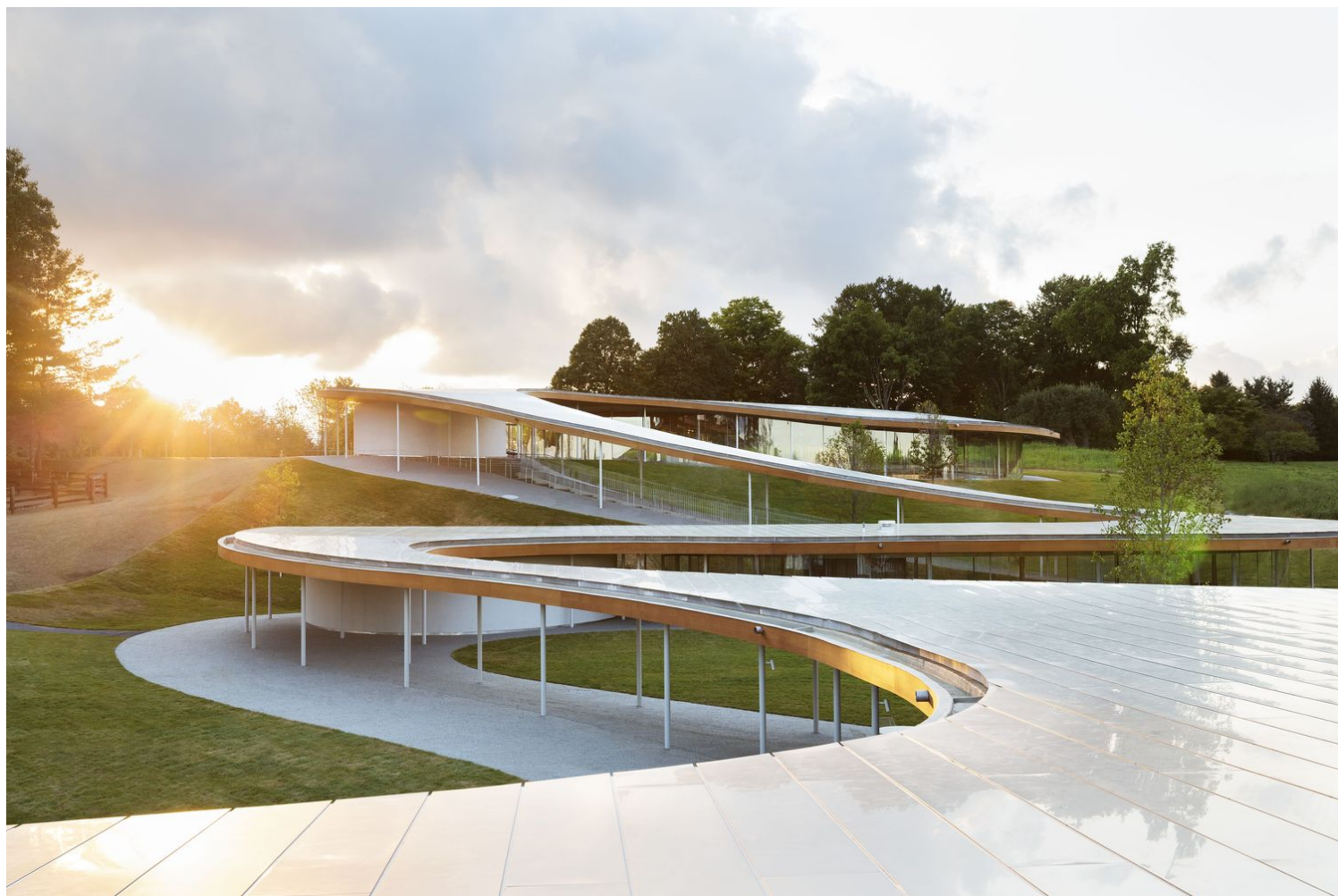
Grace Farms, 2015 | SANAA, Kazuyo Sejima and Ryue Nishizawa

Άλλα σημαντικά έργα από SANAA είναι το O-Museum στο Nagano, το New Urban Campus του Bocconi University στο Μιλάνο κ.α.