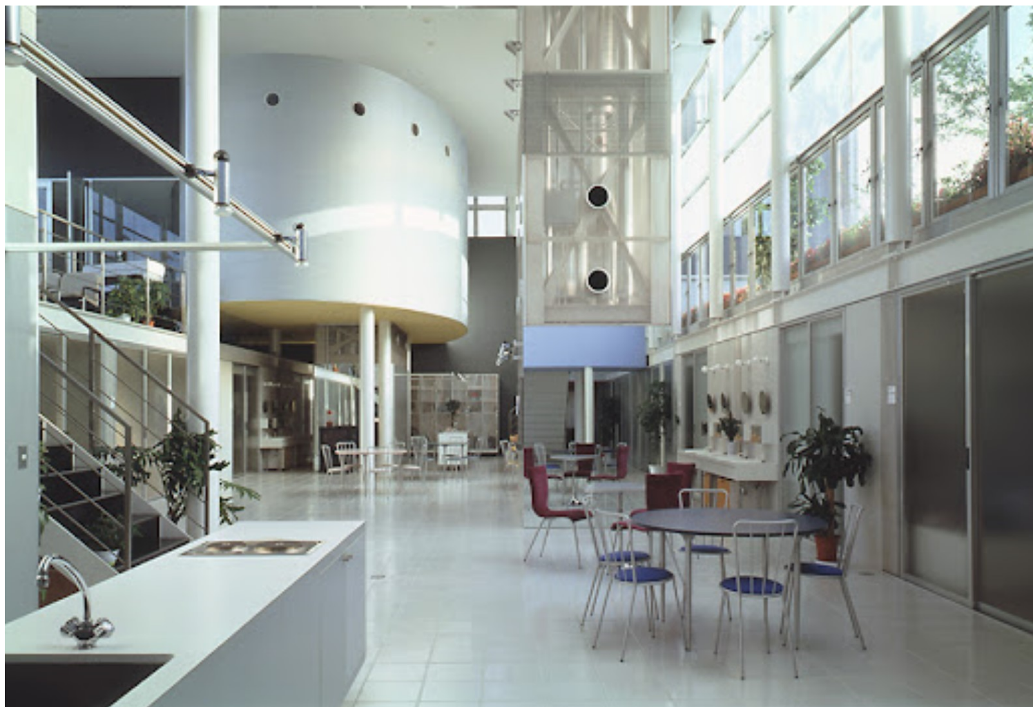
Saishunkan Seiyaku Women's Dormitory, 1991 | Kazuyo Sejima & Associates

Με αναφορές από τον ιαπωνικό μοντερνισμό, με τα έργα του Kiyonori Kikutake (1958) να πρωταγωνιστούν στο φάσμα της φαντασίας της, αποφυτά από τη σχολή Japan Women's University το 1979. Οι αναφορές της εμπλουτίζονται με την πρώτη της εργασιακή εμπειρία στο γραφείο του Kikutake Toyo Ito , όπου και εμφανίζεται στο έργο του Pao I: Dwelling for the Tokyo Nomad Woman (1985). Το 1987 ιδρύει το γραφείο της Kazuyo Sejima & Associates , μέσω του οποίου επικοινωνούσε το όραμά της για απλές κατοικίες από απλά υλικά και αφηρημένες χωρικές διατάξεις. Το 1991 σχεδιάζει τους γυναικείους κοιτώνες της εταιρείας καλλυντικών Saishunkan Seiyaku στο Kumamoto. Η Kazuyo δίνει προτεραιότητα στους κοινόχρηστους χώρους, εμπλουτίζοντάς τους με δραστηριότητες, ξεφεύγοντας από τη συνηθισμένη τυπολογία αντίστοιχων χώρων. Χώροι γεμάτοι φως, με υλικότητες οι οποίες φαντάζαν παράδοξες για την εποχή, αλλά σήμερα εκτιμώνται για τη διορατικότητα και τη διαχρονικότητά τους. Το έργο λαμβάνει ιδιαίτερη δημοσιότητα.