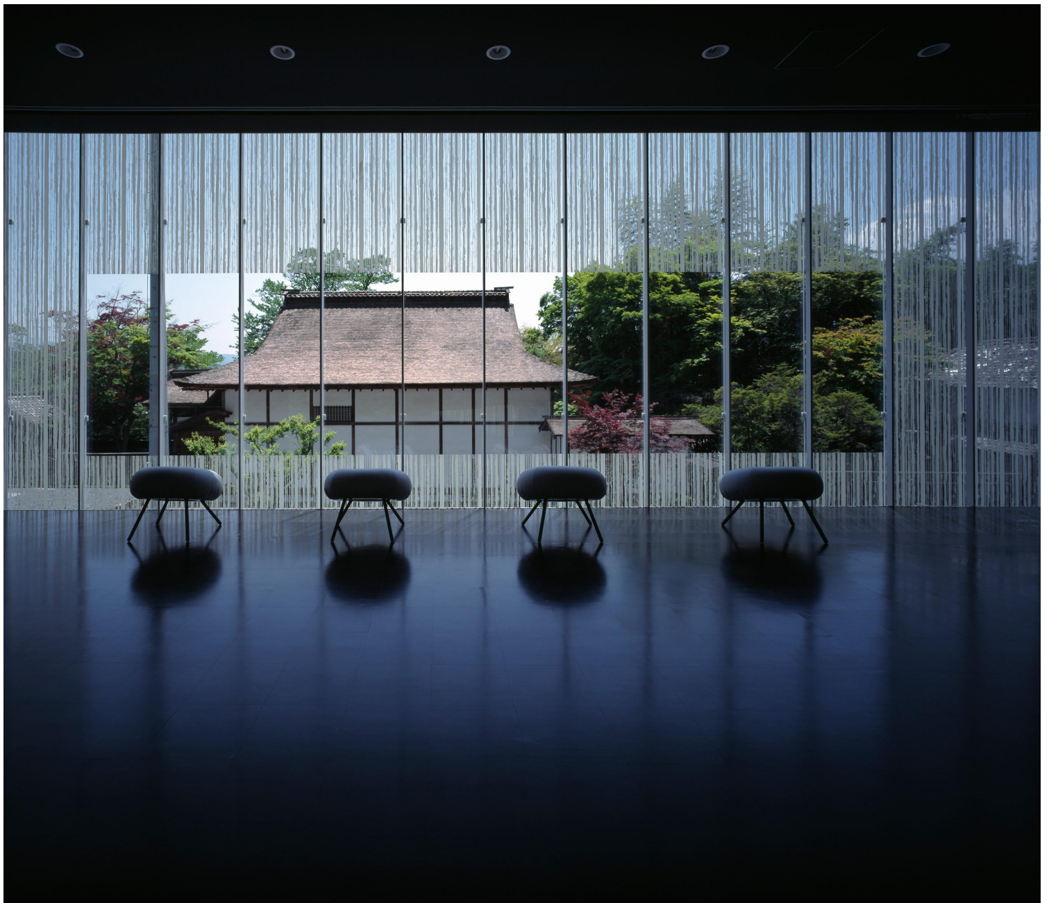
O-Museum, Nagano, 1999 | SANAA, Kazuyo Sejima and Ryue Nishizawa

Το 2010 ως SANAA κερδίζουν βραβείο Pritzker , με την Kazuyo να είναι η δεύτερη γυναίκα που κερδίζει αντίστοιχη διάκριση.