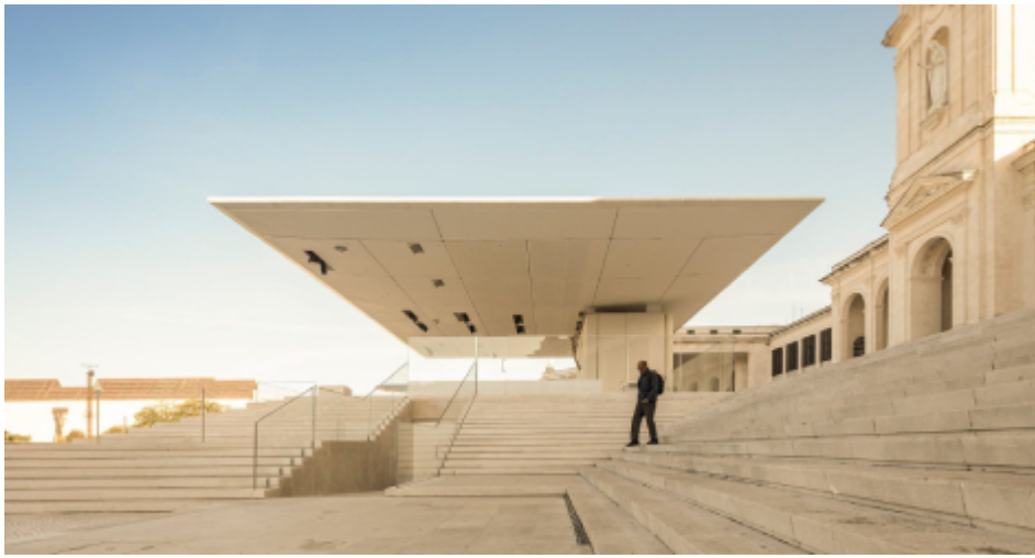
Μιχαήλ Αναστασιάδης: Πειραματισμοί με το φως