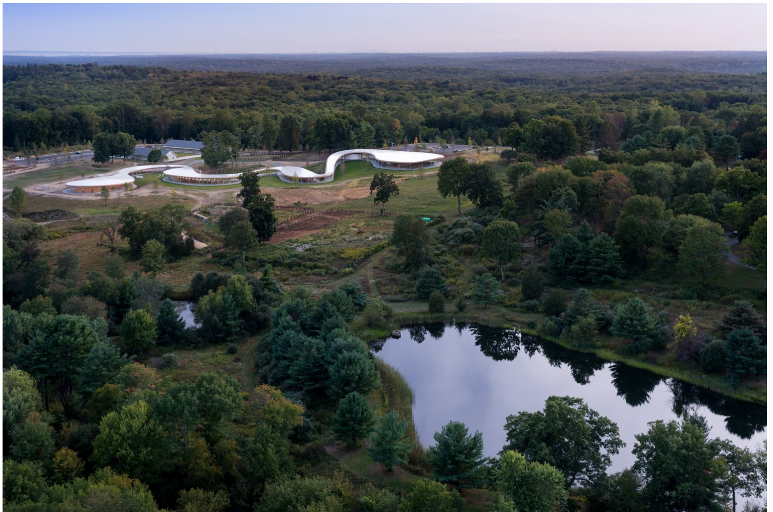
Grace Farms, 2015 | SANAA, Kazuyo Sejima and Ryue Nishizawa

Η SANAA δημιουργεί μια σειρά από δημόσια κτίρια και κτίρια μεγάλης κλίμακας, που μέχρι και σήμερα διακρίνονται για τον σχεδιασμό τους. Κάποια από αυτά είναι το έργο 'Grace Farms' , ένα κοινοτικό κέντρο που φιλοξενεί δραστηριότητες όπως διάφορα είδη καλλιέργειας, τεχνών και αθλητισμού. Με καμπύλες γεωμετρίες που ακολουθούν τις τοπογραφικές, σε καμία θύμηση συμβατικού ορθοκανονικού σχεδιασμού, η SANAA δημιουργεί μια συνομιλία μεταξύ υπαίθριων, ημιυπαίθριων και στεγασμένων χώρων προς εκμετάλλευση της κοινότητας. Η συνομιλία μεταξύ υπαίθριων, ημιυπαίθριων και στεγασμένων λειτουργεί σαν οπτικό παιχνίδι μέσω των διαφανειών και του ελαφρύ σχεδιασμού του στεγάστρου. Οι δραστηριότητες τις οποίες φιλοξενεί έρχονται σε συνομιλία, αντίστοιχα, με την ύπαιθρο, την κοινότητα και τις εν δυνάμει τροπικότητες που μπορούν να φιλοξενηθούν.