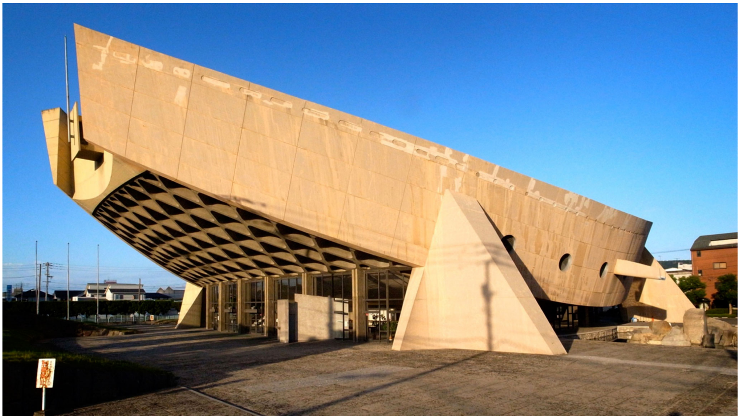
Gymnasium in Leon designed by Kenzo Tange

Ο Kenzō Tange (4 Σεπτεμβρίου 1913 - 22 Μαρτίου 2005) υπήρξε μια από τις πιο σημαντικές φιγούρες στον τομέα της αρχιτεκτονικής, τόσο στην Ιαπωνία όσο και σε όλο τον κόσμο. Διαμόρφωσε, σε μεγάλο βαθμό, την αρχιτεκτονική ιστορία και κουλτούρα της μεταπολεμικής Ιαπωνίας και έκανε την εισαγωγή του στον Μοντερνισμό . Με εξέχοντα αρχιτεκτονικά έργα σε εύρος κλίμακας, ο Tange δε διακρίνεται μόνο για την αρχιτεκτονική του, αλλά και για τη σημαντική του συμβολή στον τομέα της πολεοδομίας . Λαμβάνει στοιχεία από την ιαπωνική παράδοση και τα βάζει στο έργο του, μια πρωτοποριακή κίνηση για την εποχή, καθώς οι μέχρι τότε εφαρμογές του μοντέρνου στην Ασία είχαν έναν μιμητισμό προς τη Δύση. Ο ίδιος όμως δε φοβάται και δημιουργεί ένα κράμα αρχιτεκτονικής και λαογραφίας, ιδιαίτερα σημαντικό και καθοριστικό για τις επόμενες γενιές αρχιτεκτόνων.