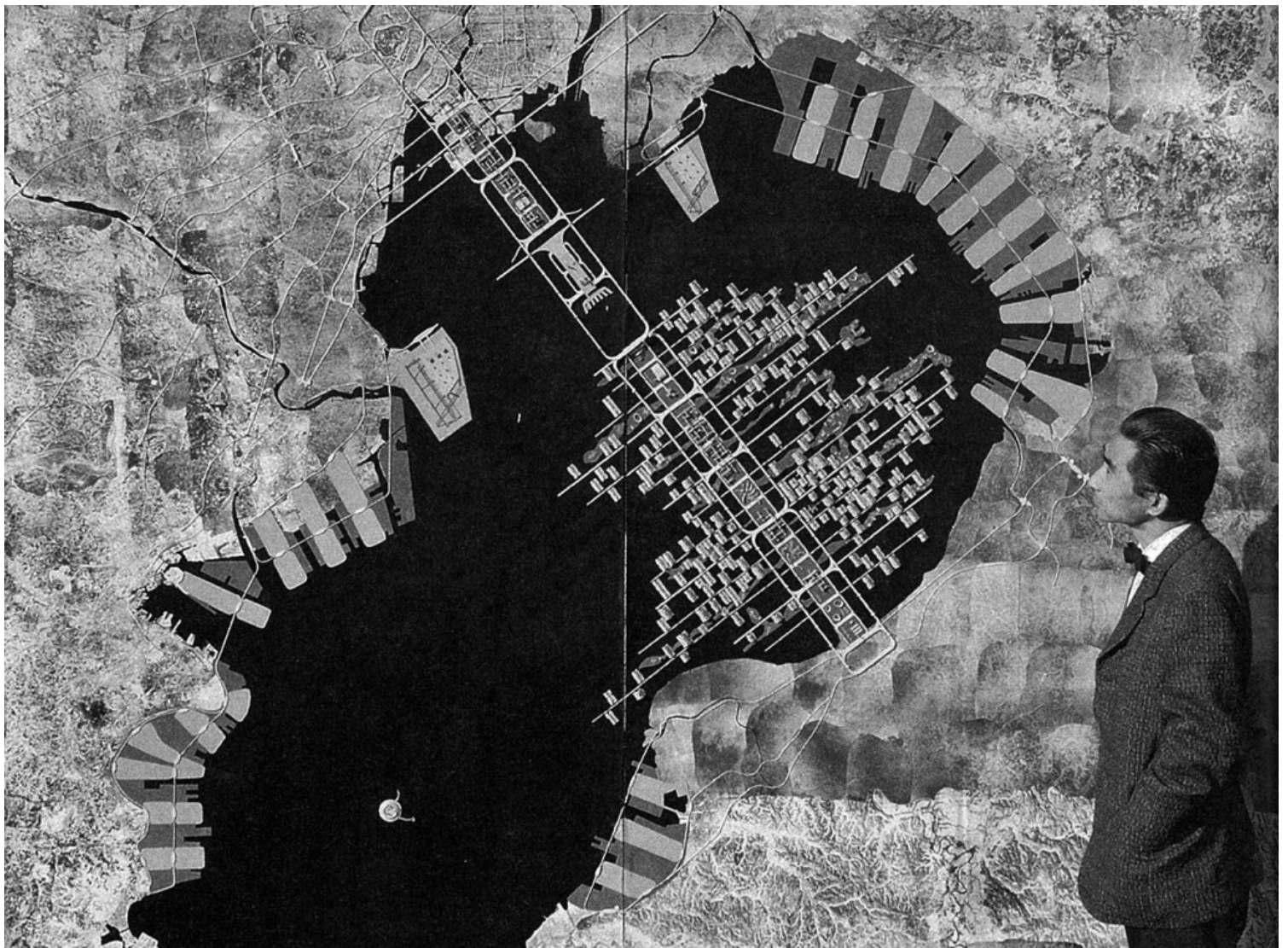
"Tokyo plan 1960" and Kenzo Tange

Αφήνοντας πίσω του πλούσια αρχιτεκτονική ιστορία, ο Kenzō Tange άφησε το στίγμα του στην παγκόσμια αρχιτεκτονική ιστορία και επηρέασε τα τρέχοντα κινήματα της εποχής. Επικοινωνεί τις γνώσεις του και εμπνέει άλλους με τα έργα του. Διαδάσκει στο University of Tokyo και έχει για μαθητές μερικούς από τους αρχιτέκτονες που διαμόρφωσαν τις επόμενες γενεές αρχιτεκτονικής, όπως τον μεταβολιστή Kisho Kurokawa, τον Fumihiko Maki, τον Sachio Otani και τον Arata Isozaki. Το 1987, η διεθνής κοινότητα αναγνωρίζει τη συμβολή του και του απονέμεται βραβείο αρχιτεκτονικής Pritzker.