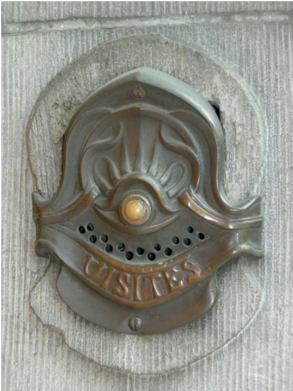
Κουδούνι, Hôtel Solvay (Victor Horta)