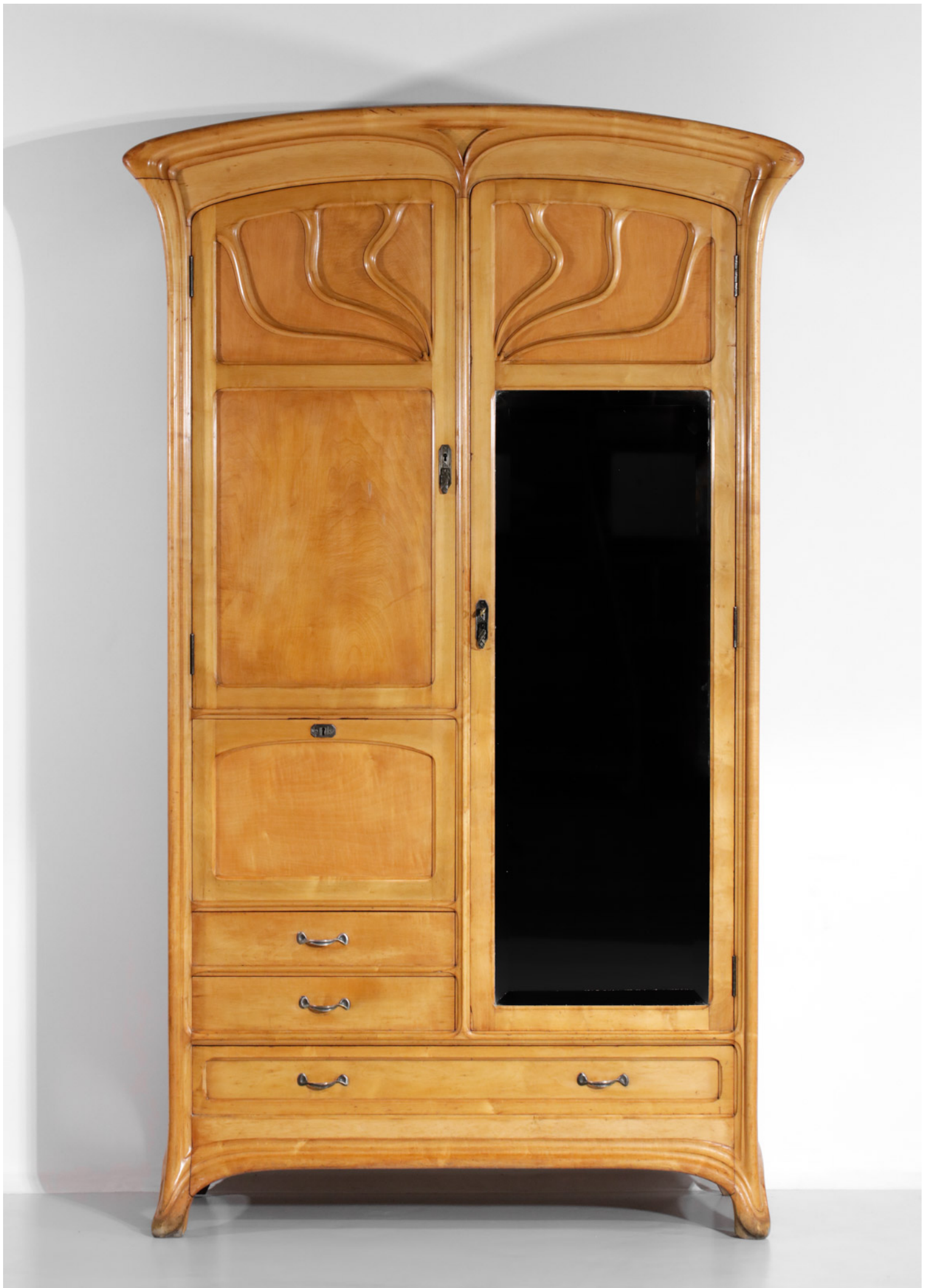
Ντουλάπα (Henry van de Velde, περί το 1920)