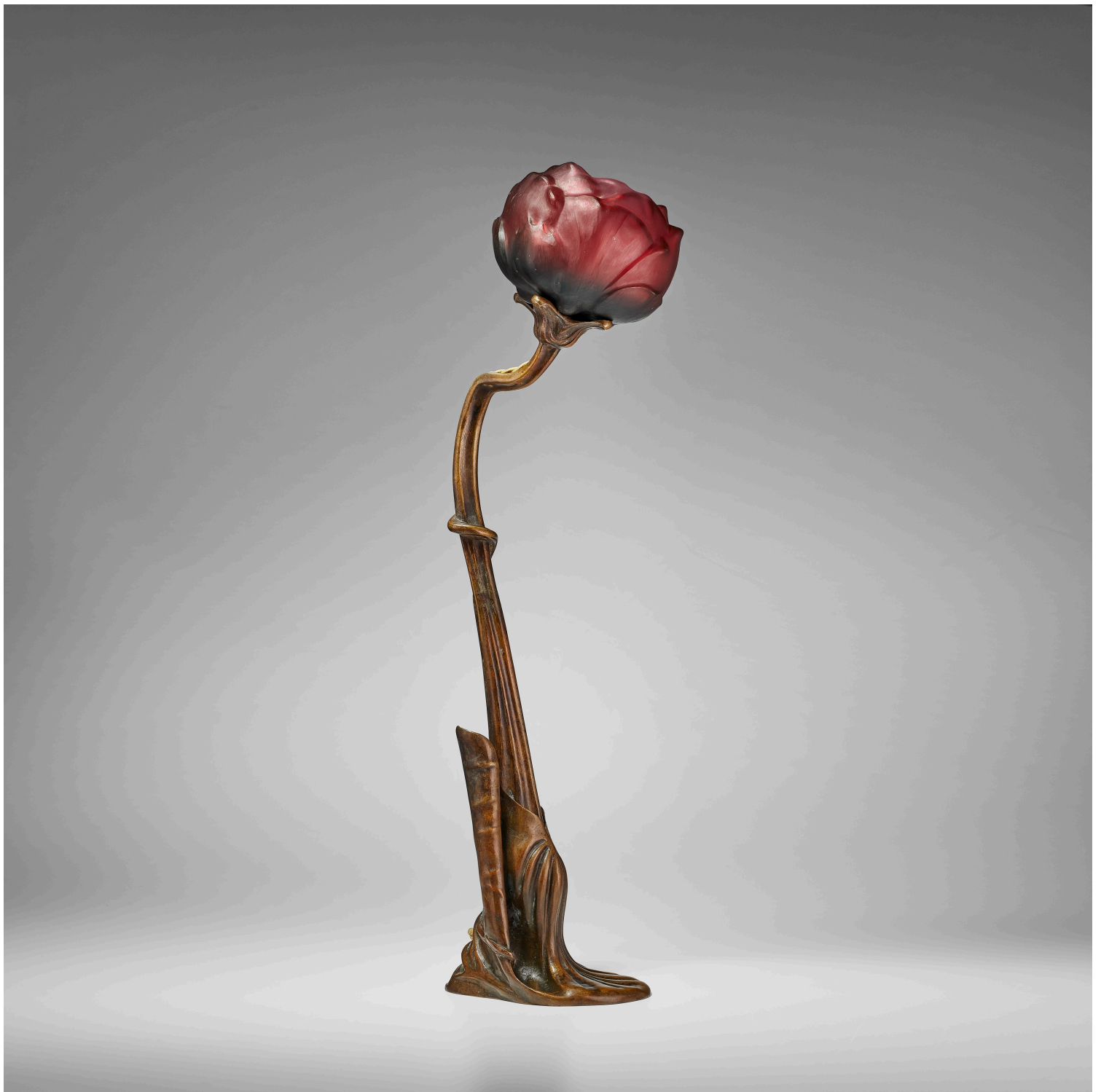
Νέυφαρ, περί το 1900, Nancy, Γαλλία (Louis Majorelle, Daum Frères)