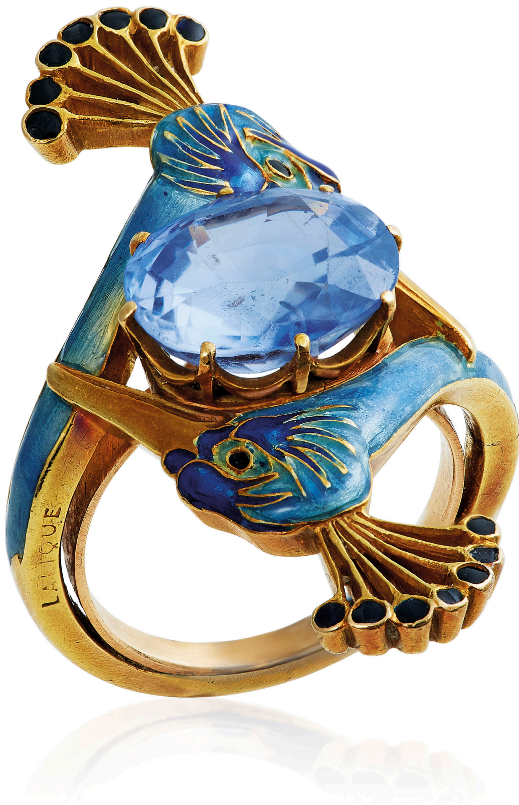
Δαχτυλίδι σε σμάλτο (René Lalique, περ. 1900)