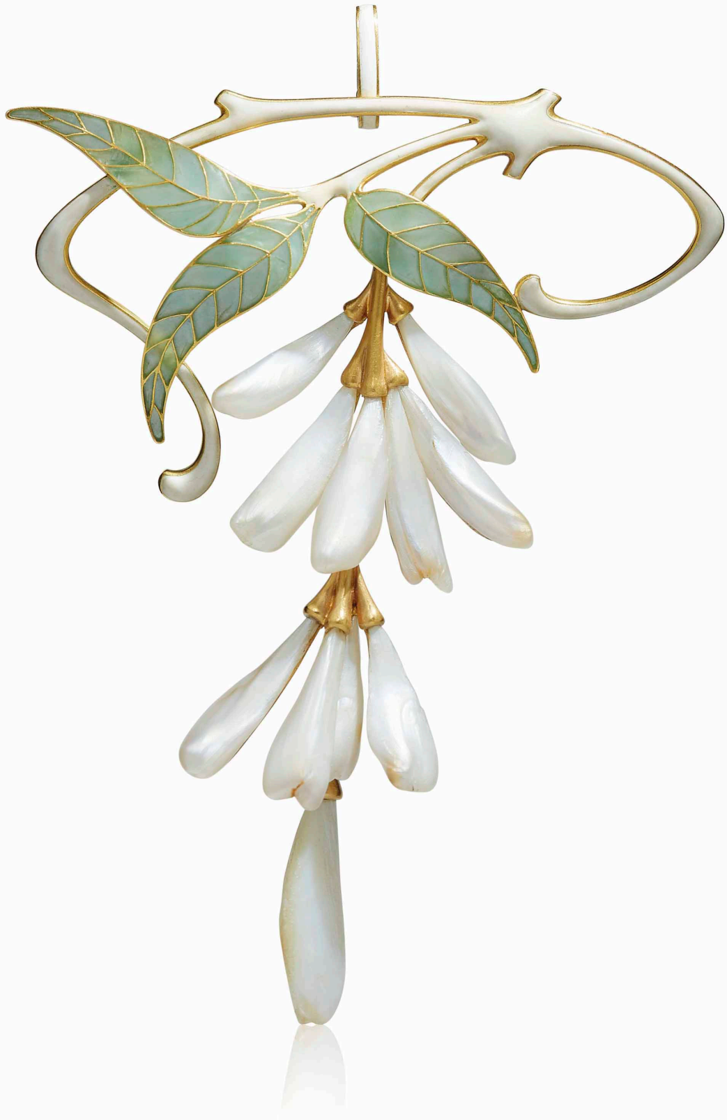
Καρφίτσα (Henry Verver, περ. 1900)