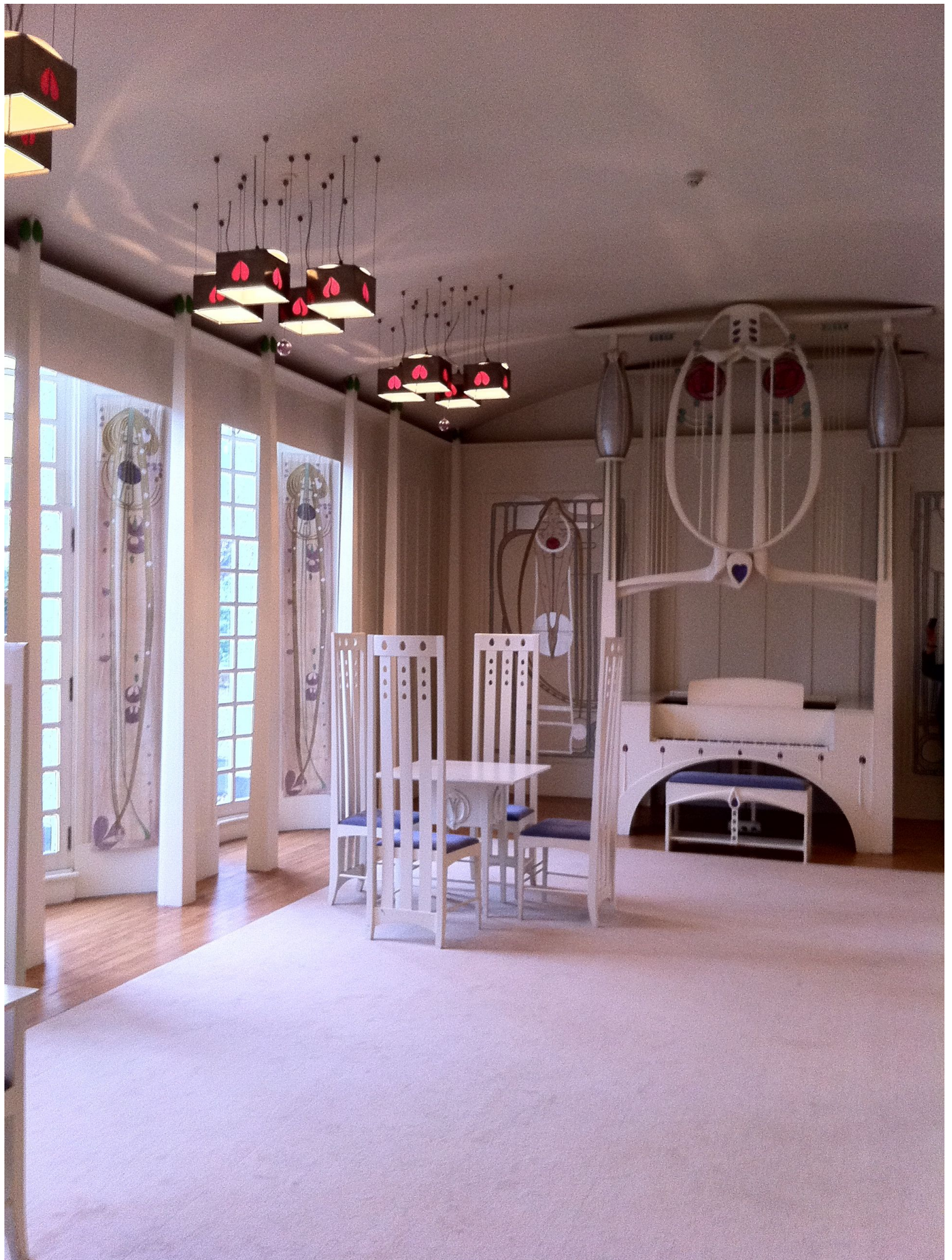
House for An Art Lover (επιμέλεια χώρων C. R. Mackintosh, 1091, εγκαίνια 1996)