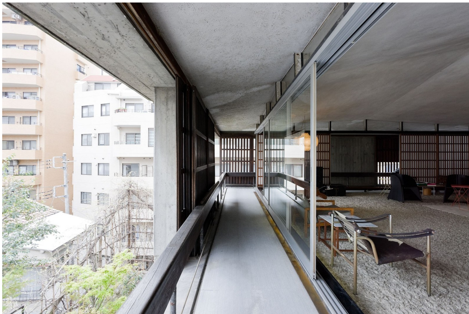
Sky House, Kiyonori Kikutake, 1958, Tokyo Japan

Το πιο αντιπροσωπευτικό δείγμα της θεώρησης του Kikutake σε ατομική κλίμακα είναι η δική του κατοικία, το «Sky House», το οποίο σχεδίασε και ολοκλήρωσε το 1958 στο Τόκιο. Πρόκειται για ένα σπίτι 10×10 μ., στηριγμένο σε τέσσερις ογκώδεις κολώνες ύψους περίπου 6,4 μ., με υπερυψωμένη πλάκα - οροφή και αιωρούμενη λειτουργικότητα μέσω του συστήματος "movenette". Το εμβληματικό χαρακτηριστικό του είναι το ανοιχτό, ευέλικτο διάκενο, μια ενιαία ευρύχωρη κοιλότητα που περιβάλλεται από περιμετρικό διάδρομο (engawa), με δυνατότητα μετακίνησης εγκαταστάσεων όπως κουζίνα και μπάνιο. Κύριο παράδειγμα: η προσθήκη "move-net", ενός παιδικού υπνοδωματίου, που κρεμάστηκε κάτω από την πλάκα, ενώ στη συνέχεια αφαιρέθηκε όταν τα παιδιά μεγάλωσαν. Η κατοικία συνεχίζει, ακόμη και σήμερα, να μετασχηματίζεται με νέες μονάδες ή modulations στη χρήση και λειτουργεί ως μικρογραφικό εργαστήριο της μεταβολιστικής αρχιτεκτονικής.