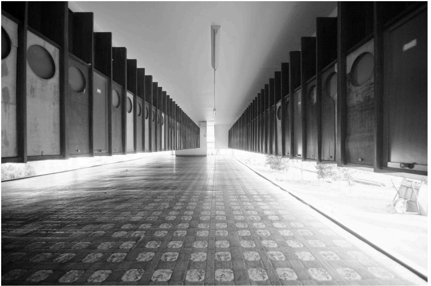
Toku'un-ji Temple Ossuary, Kiyonori Kikutake, 1965

Σε αντίθεση με την κατοικία, το ιερό Ossuary (θάλαμος λειψάνων) του ναού Tokun'uni (1965) αποτελεί ένα μικρό, αλλά πολύ συγκεκριμένο κατασκευαστικό γύρισμα στην προσέγγιση του Kikutake σε δημόσιο/θρησκευτικό πλαίσιο.