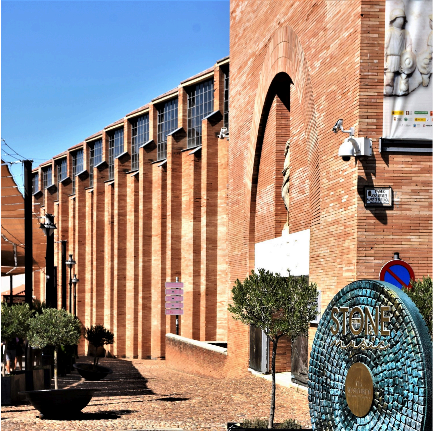
Η όψη της εισόδου του Μουσείου Ρωμαϊκής Τέχνης