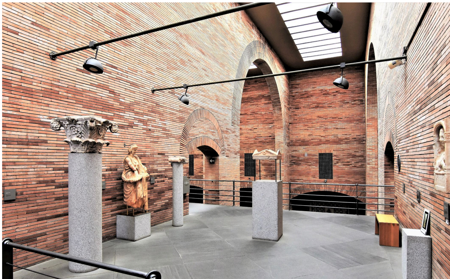
Απόψεις του εσωτερικού του μουσείου