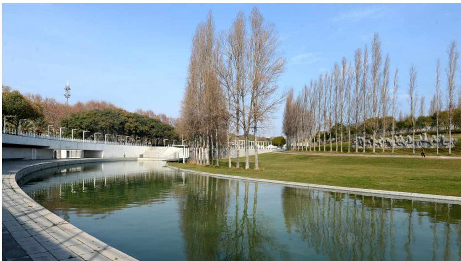
[06. Parc Nus de la Trinidad , Barcelona 1996 Αρχιτέκτονες: M. Battle J. Roig.