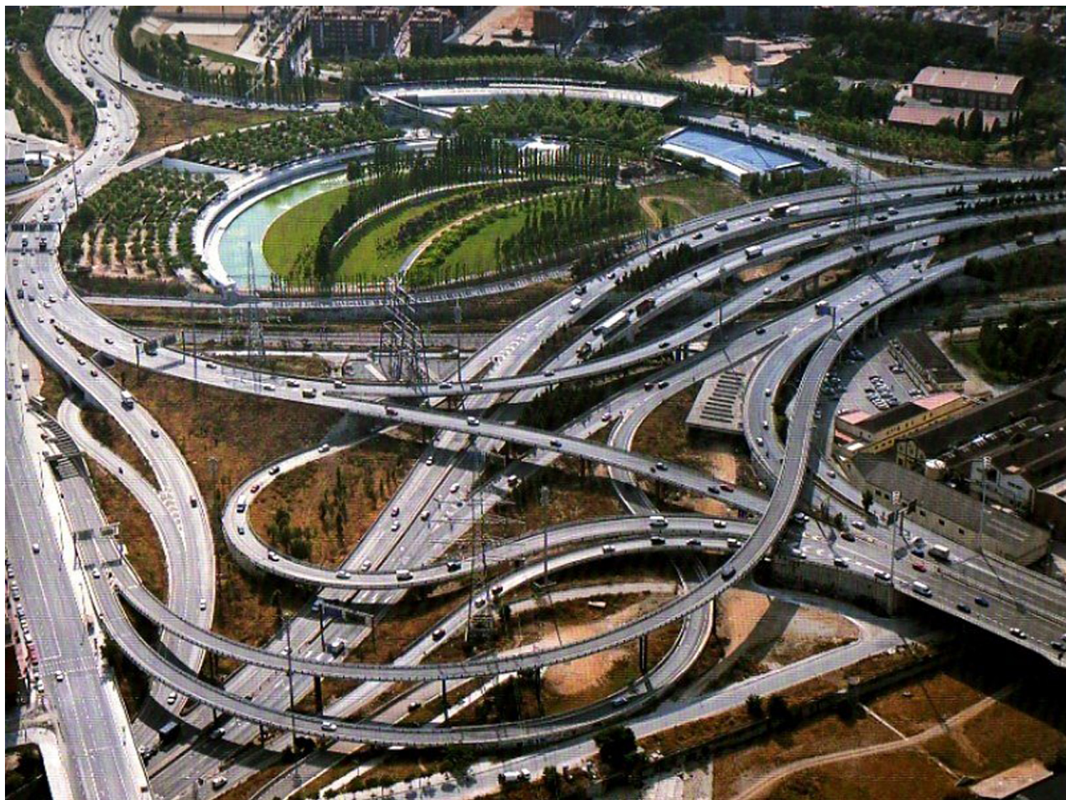
[05. Parc Nus de la Trinidad , Barcelona, Ισπανία 1996 Αρχιτέκτονες: M. Battle J. Roig. ]