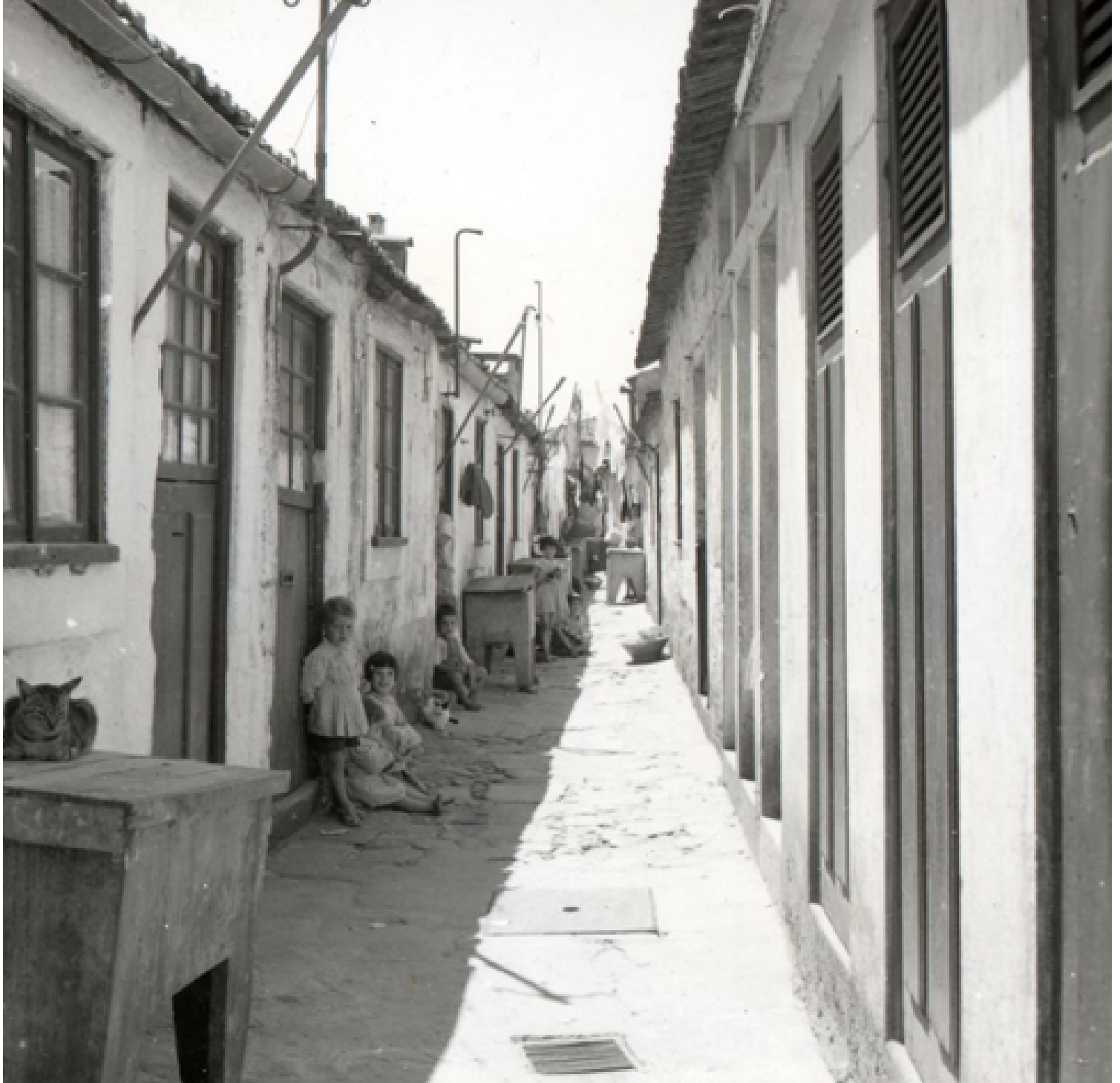
Ilhas (1960)

Πρόκειται για παρατεταγμένες σε σειρά μικροσκοπικές κατοικίες, 15 περίπου τετραγωνικών μέτρων και τριών δωματίων έκαστη. Ονομάστηκαν έτσι, όχι γιατί πρόκειται για τόπους εξωτικής ομορφιάς, διακοπών ή ανάπαυσης, αλλά γιατί στέκουν αθέατες, απομονωμένες σχεδόν από τα βλέμματα και την κοινωνική ζωή της πόλης, στο βάθος του πίσω μέρους οικοπέδων που μέχρι και σήμερα ανήκουν σε εύπορες οικογένειες.