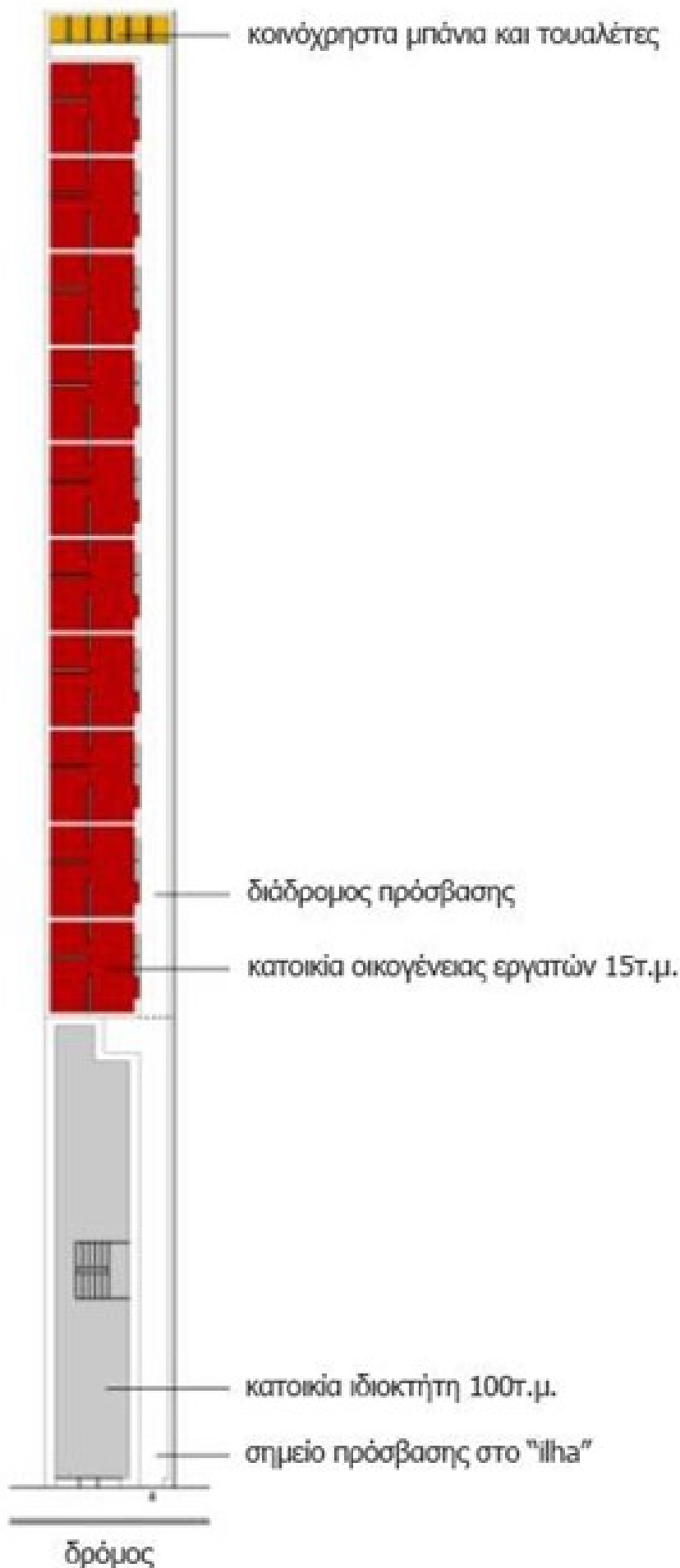
ΔΙΑΓΡΑΜΜΑ ΚΑΤΟΨΗΣ "ίλη" με μια σειρά από σπίτια