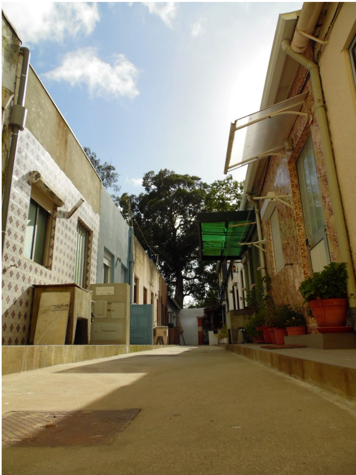
Σημερινή άποψη μιας αυλής των ilhas | Εικόνα: Νάντη Χατζηγεωργίου (προσωπικό αρχείο)