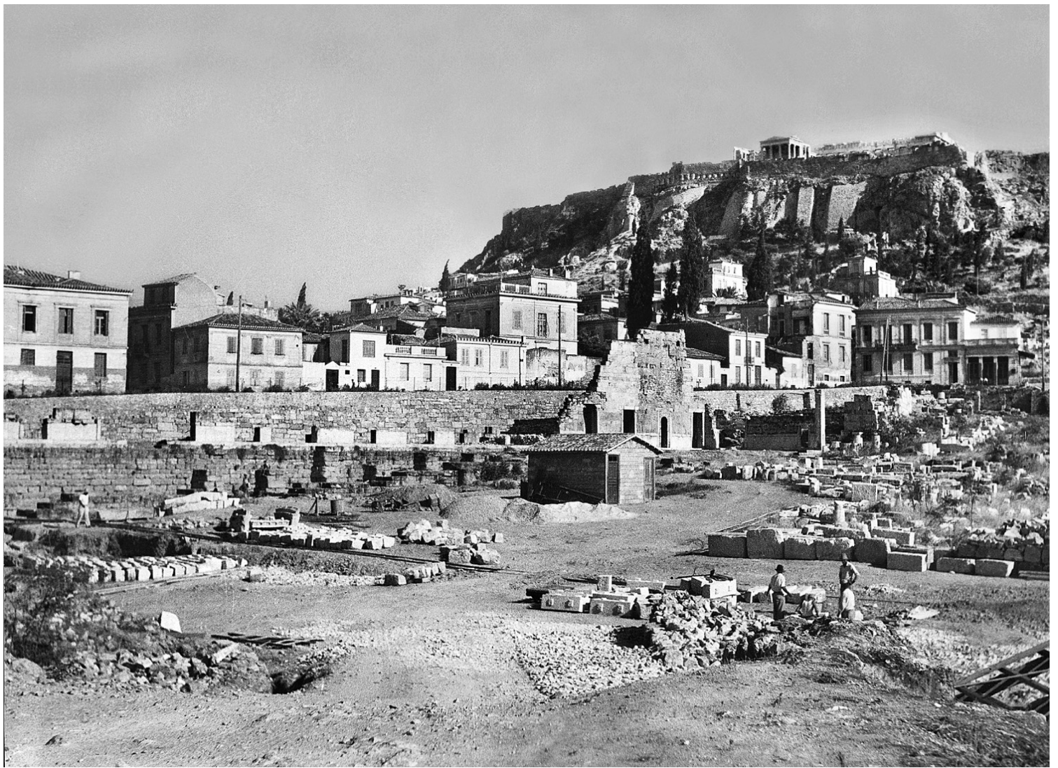
Αποψη των ερειπίων της Στοάς του Αττάλου πριν την ανακατασκευή.