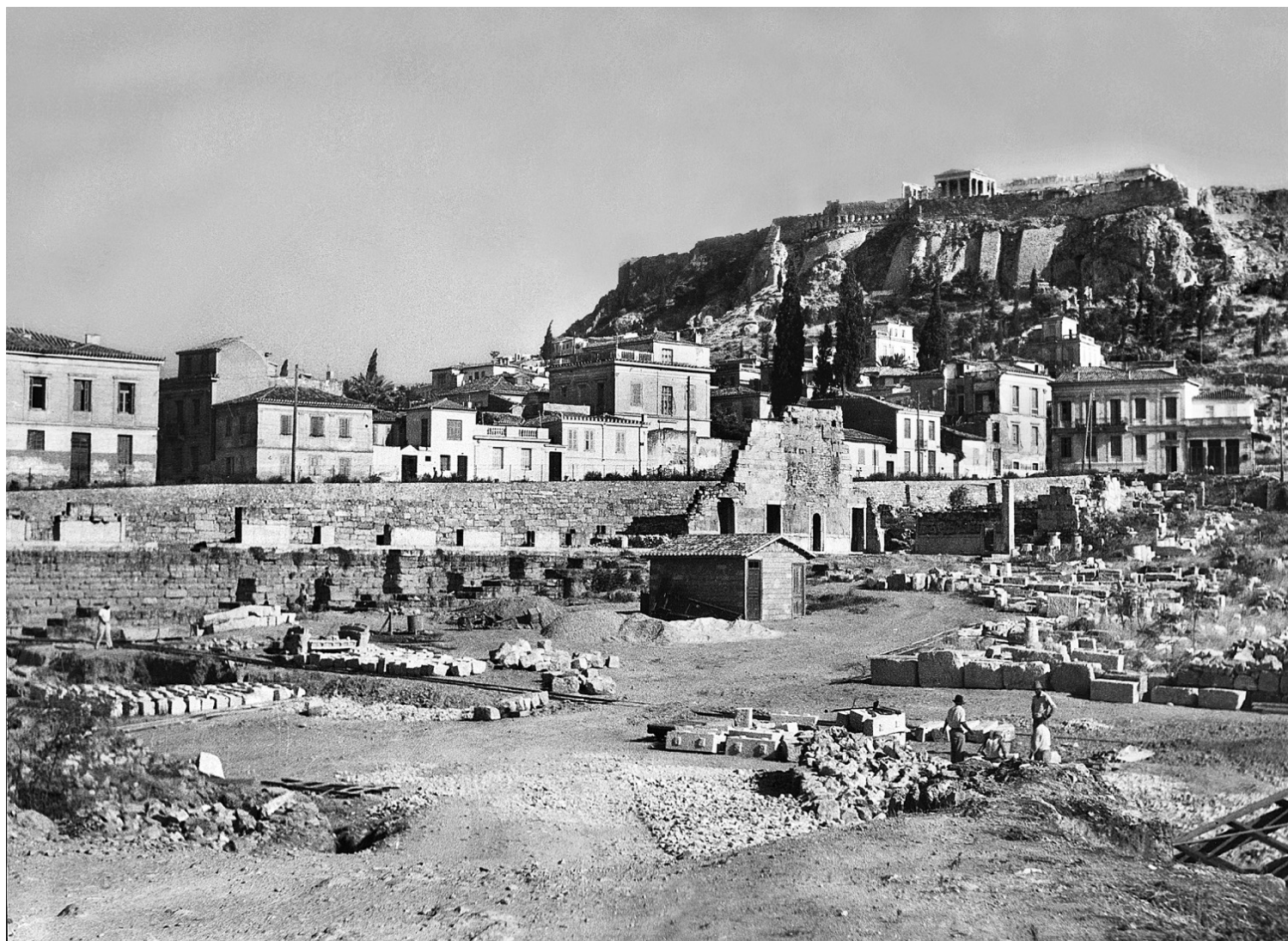
Αποψη των ερειπίων της Στοάς του Αττάλου πριν την ανακατασκευή.