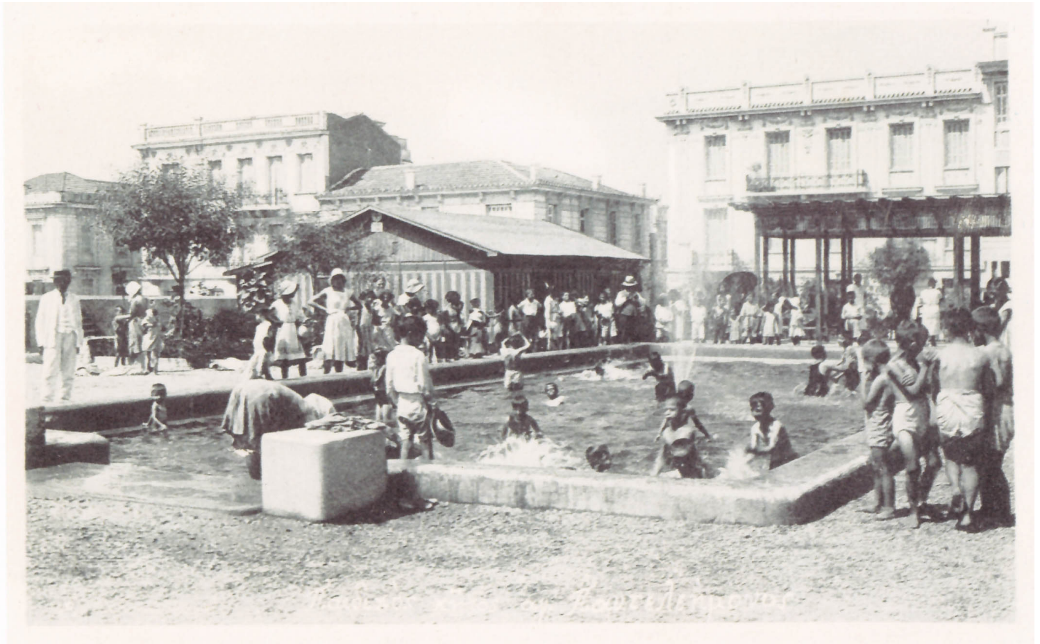
Άποψη 1939. Παιδική πισίνα παραπλεύρως «Αγίου Παντελεήμονα» οδού Αχαρνών.

Αν και σήμερα παρατηρείται μια αδράνεια της «πρωτοβουλίας κατοίκων» και κάθε λογής εθνικιστικής ή και φασιστικής παρέμβασης, αυτό δε σημαίνει ότι το πρόβλημα στην περιοχή έχει παρέλθει. Η έξαρση των ρατσιστικών φαινομένων άλλωστε διαχρονικά εμφανίζεται και ενδυναμώνεται σε περιόδους οικονομικής και κοινωνικής κρίσης, όπου το παρακράτος και οι φασιστικές οργανώσεις μπορούν να δρουν απροκάλυπτα και ανενόχλητα. Η καθημερινότητα όμως των μεταναστών στην περιοχή και η πλειοψηφία των κατοίκων, φαίνεται να αντικρούουν τα επιχειρήματα που υποδεικνύουν τους μετανάστες ως κύριους υπεύθυνους των προβλημάτων της γειτονιάς, καθώς συνεχίζουν να επιλέγουν την περιοχή ως τόπο κατοικίας, γεγονός που υποδηλώνει ένα αίσθημα ασφάλειας, ενώ ταυτόχρονα εξακολουθούν να συμμετέχουν στη δημόσια ζωή και να χρησιμοποιούν τους ελεύθερους χώρους της περιοχής.