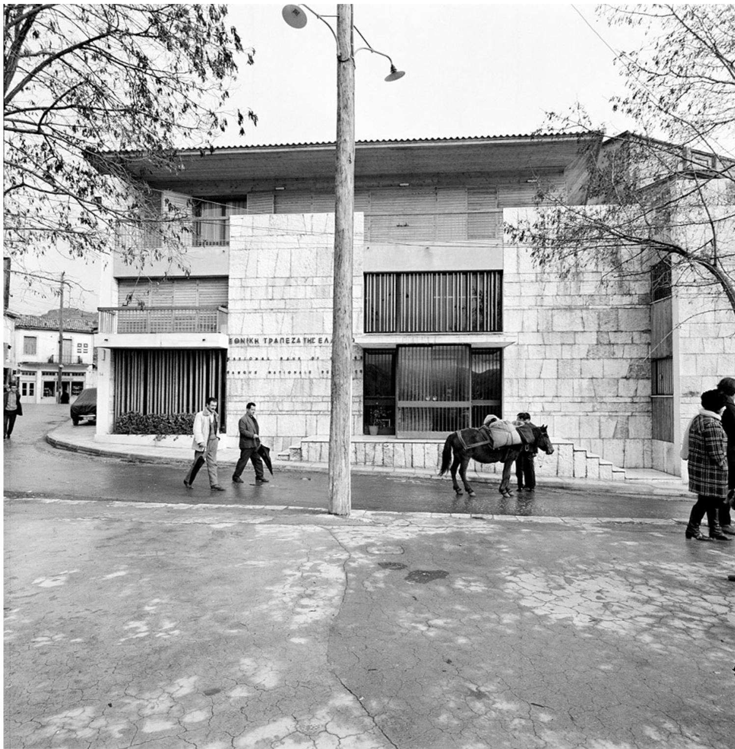
Β. Μπογάκος, Υποκατάστημα ΕΤΕ στη Δημητσάνα, 1966.

Ωστόσο, ακόμη και όταν ο Μπογάκος αναθεωρεί τις επιλογές του, αποδεχόμενος την αναγκαιότητα μιας ιδέας «ένταξης», αποκαλύπτεται μια υψηλών προδιαγραφών σχεδιαστική δεινότητα, όπως στην περίπτωση του υποκαταστήματος της Εθνικής Τράπεζας στη Δημητσάνα (1966): προκύπτει εδώ μια δεξιοτεχνικά ενορχηστρωμένη σύνθεση μεταξύ της ιδέας του μοντέρνου σχεδίου και του χαρακτήρα του ύφους του τόπου, έτσι ώστε το έργο να ξεπερνά τις τυπικές ταξινομήσεις μεταξύ ενός τοπικισμού ή μοντερνισμού περισσότερο ή λιγότερο «κριτικού», και να κατακτά μια πολιτισμική αυτονομία ανάλογη εκείνης δασκάλων όπως π.χ. ο μεταπολεμικός Ignazio Gardella.