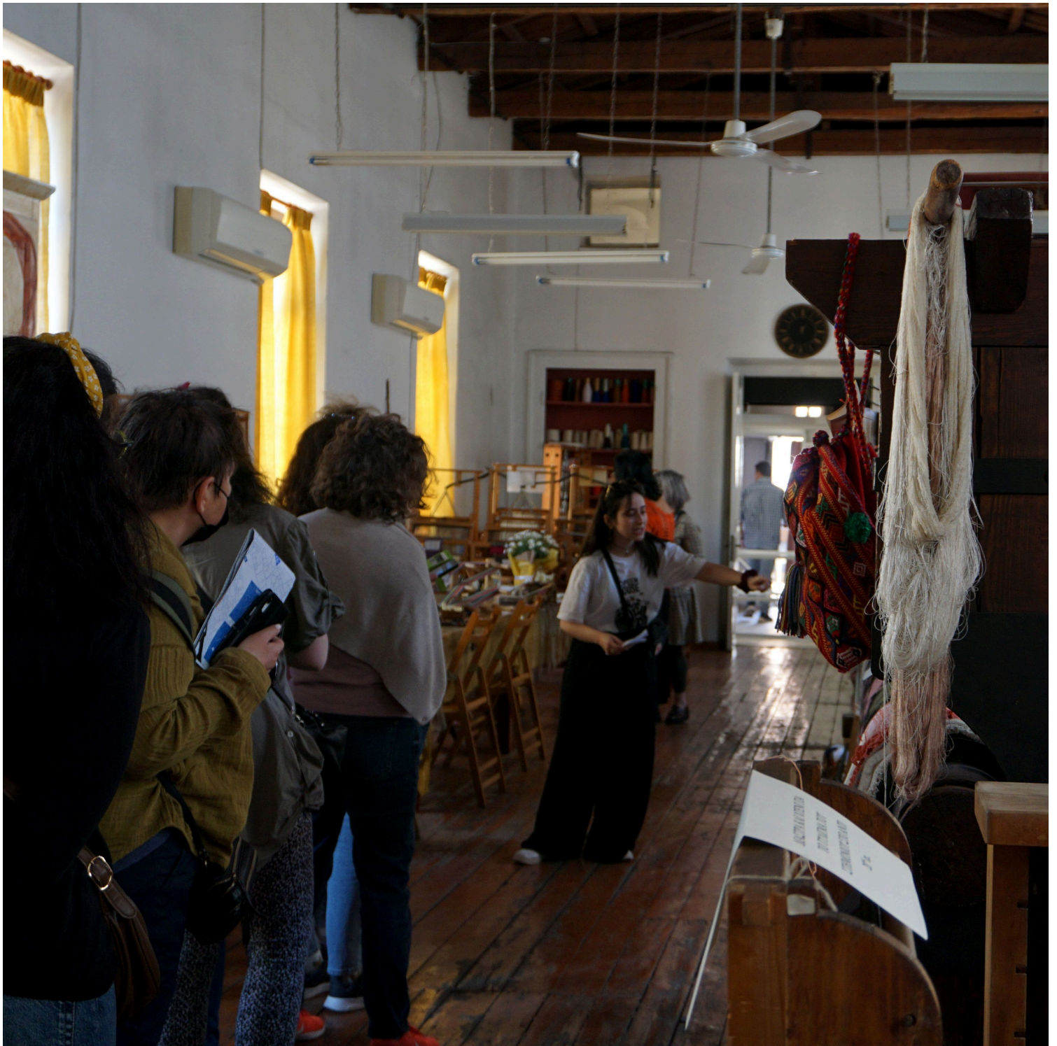
Ιστορικό Ύφαντουργείο SEN