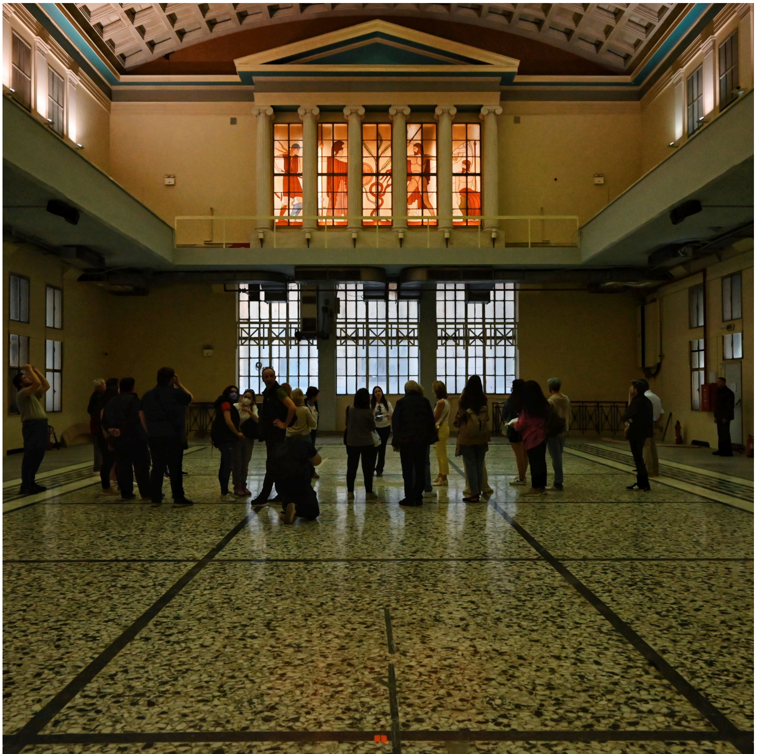
Παλιό Χρηματιστήριο | Nikos Simos