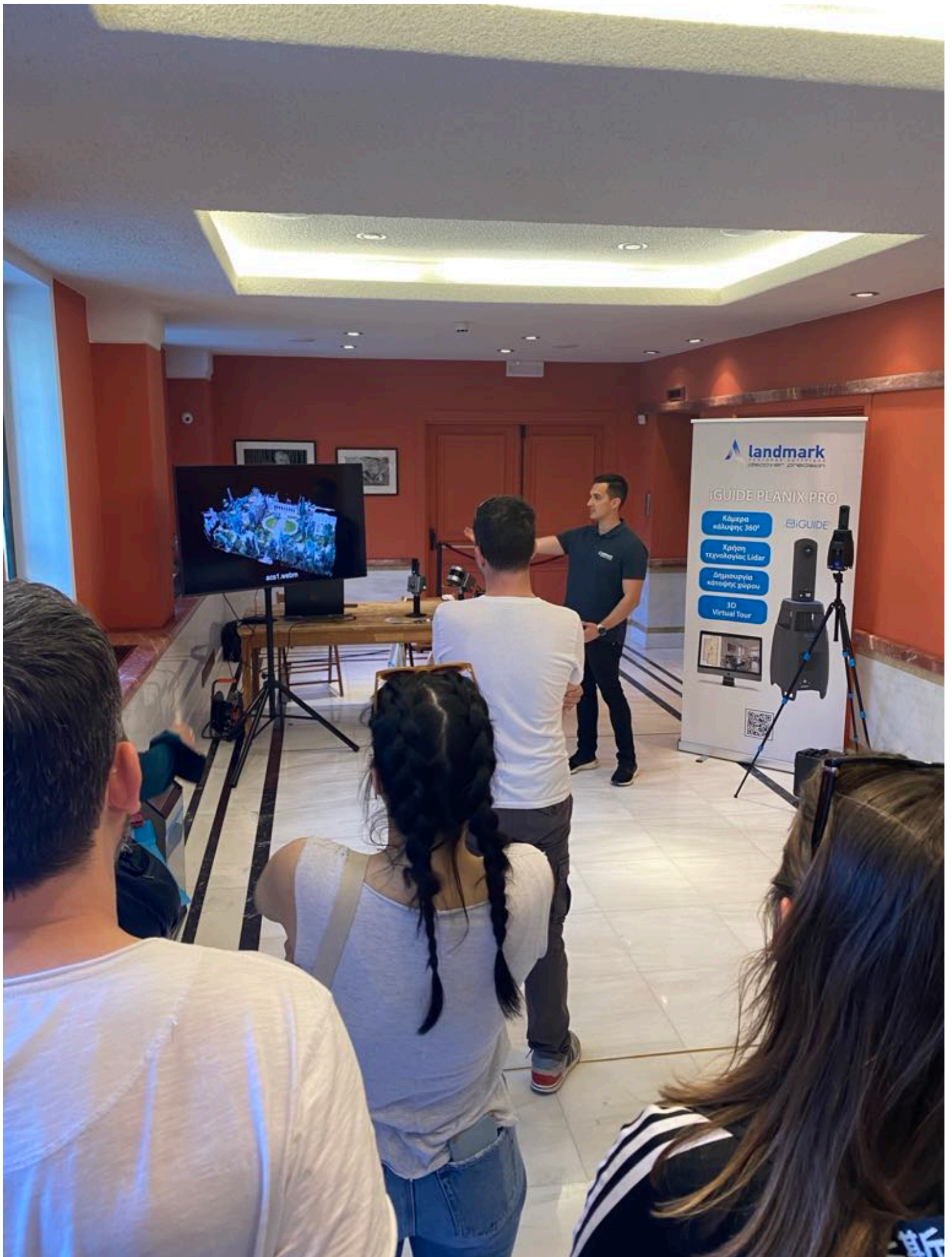
Landmark at American School of Classical Studies