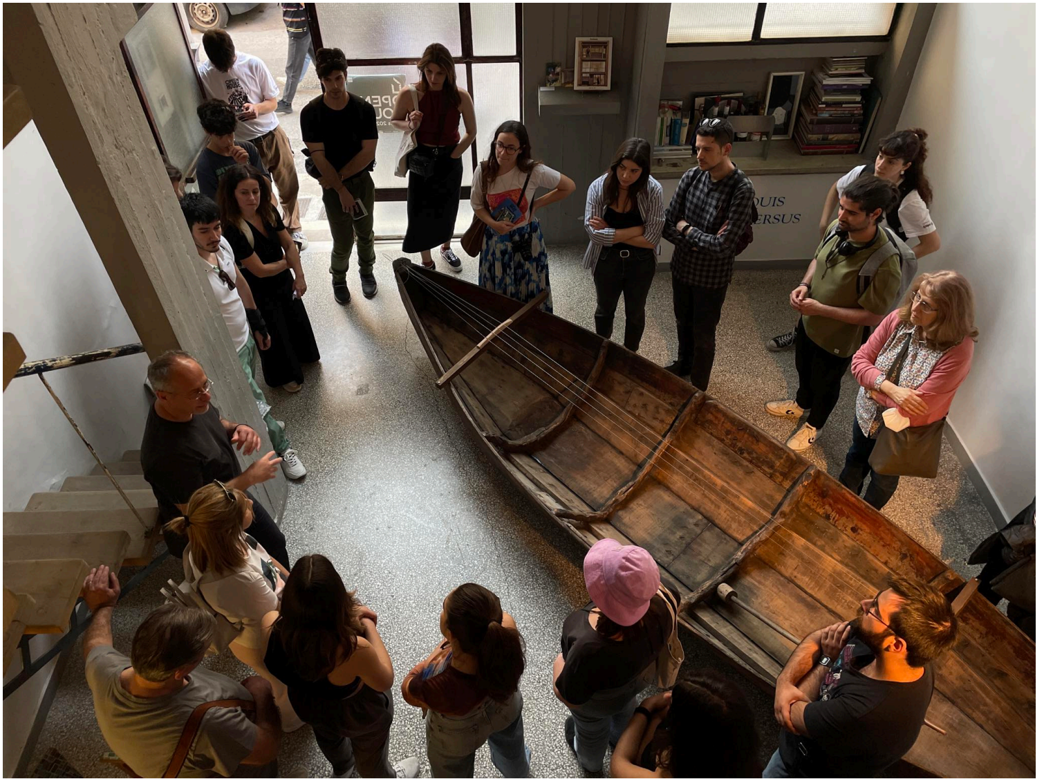
Atelie Odou Kykladon