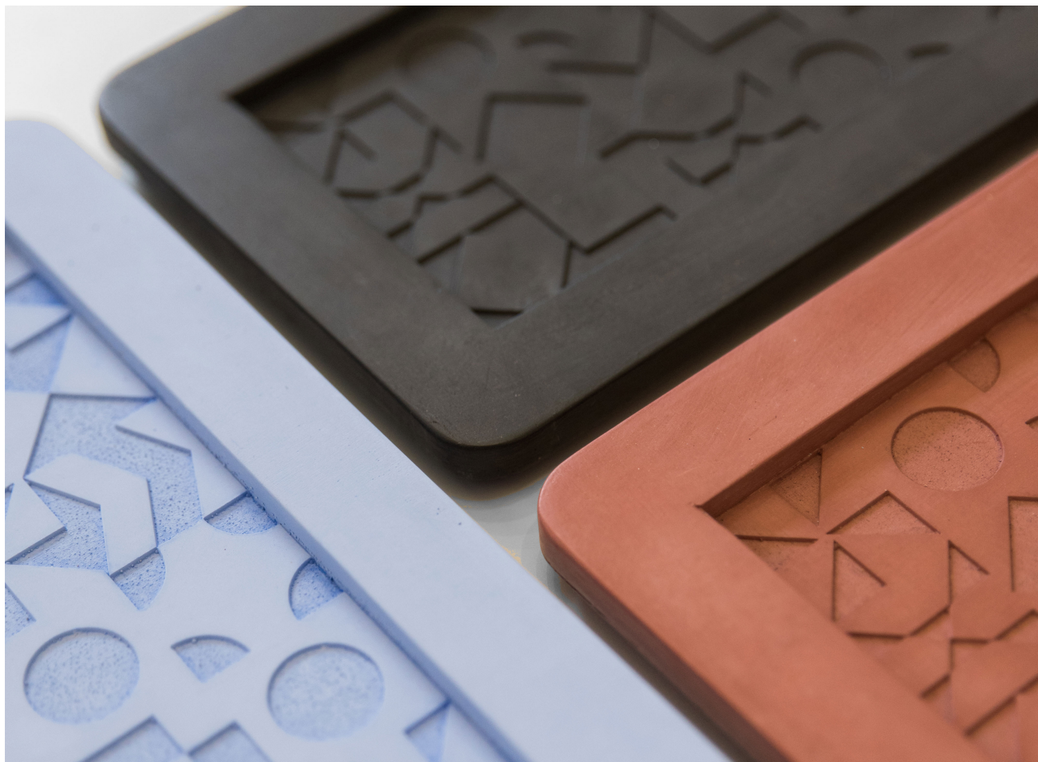
Μικρές ανάγλυφες πλατέλες