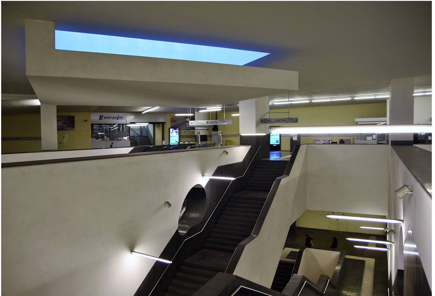
Ο σταθμός του Δημαρχείου σχεδιάστηκε από τον Πορτογάλο Alvaro Siza.

Σε αυτό το ουτοπικό σχεδόν εγχείρημα μεταξύ αρχαιολογίας, τέχνης και πόλης, οι νέοι σταθμοί του ναπολιτάνικου μετρό μετατρέπονται αφενός σε «υποχρεωτικά» υπόγεια μουσεία τέχνης, αφετέρου σε μουσεία σύγχρονης αρχιτεκτονικής.