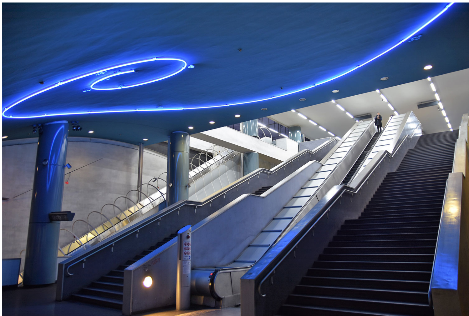
Ο σταθμός Βανβιτέλλι με την εγκατάσταση του Μάριο Μερτζ.