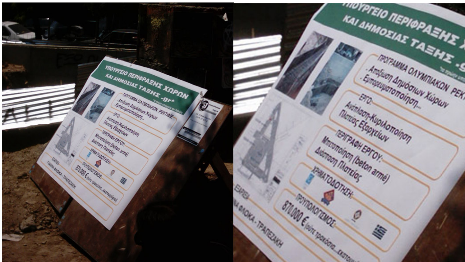
Εικόνα 3. «Τροποποιημένη» πινακίδα του έργου.

Ένα κοινό αίσθημα διακατέχει τους περισσότερους: «Δεν υπολογίζουν τους κατοίκους», «ενεργούν για εμάς χωρίς εμάς» ή αντίστοιχες φράσεις σκιαγραφούν ένα γενικευμένο (και όχι απαραίτητα Εξαρχειώτικο) αίσθημα, που σε πρόσφατο κείμενό του για το Μετρό στα Εξάρχεια (Καθημερινή 9-8-2022), ο αρχιτέκτονας Σταύρος Μαρτίνος θα περιέγραφε ως εξής: «Κανείς δεν ρώτησε αυτούς που μένουν εκεί [...] Ως πολιτεία λειτουργούμε ακόμα με το 'αποφασίζομεν και διατάσσομεν'» 2 .