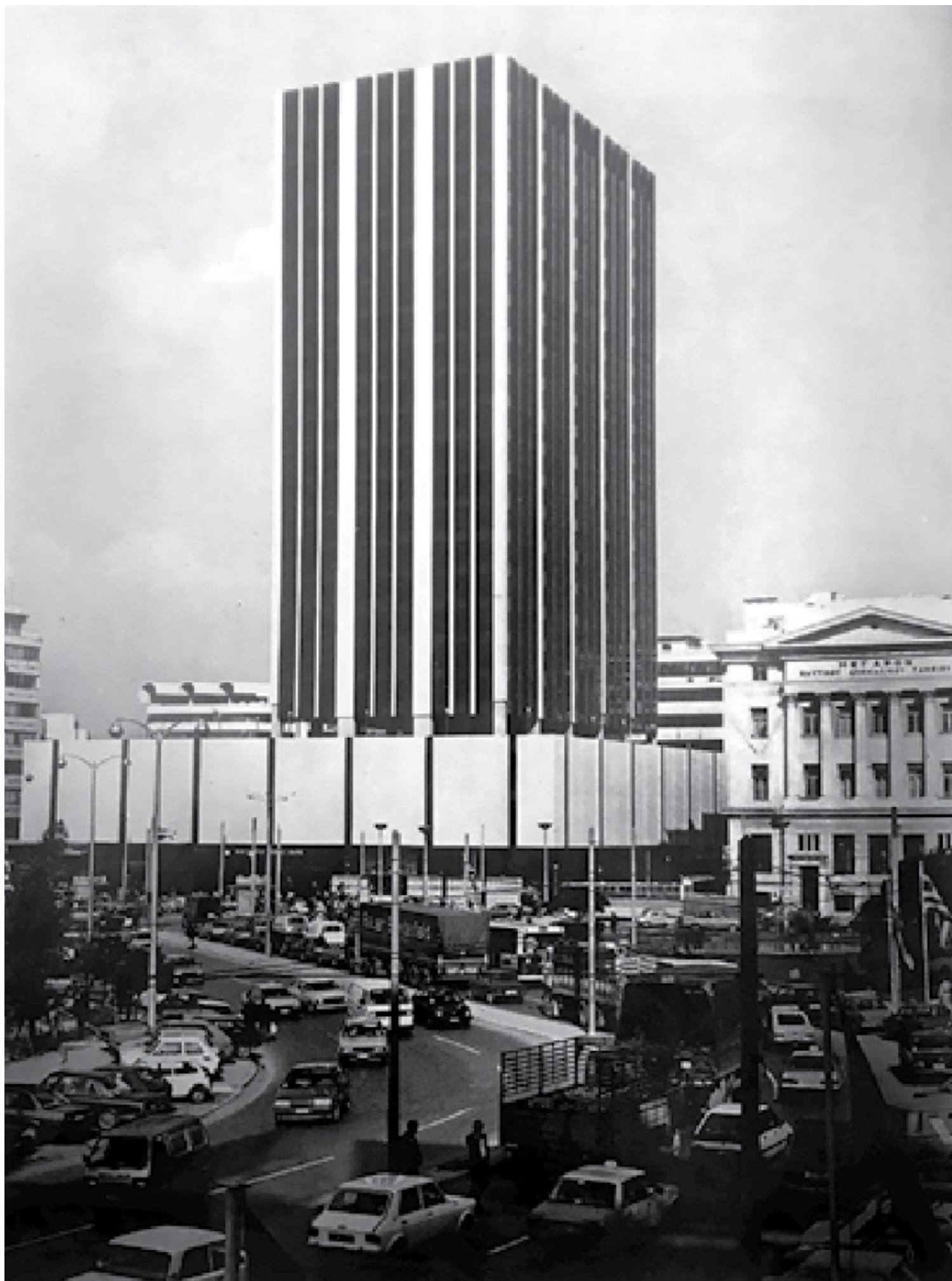
Ο Πύργος του Πειραιά.

Σε άρθρο του Γερ. Μαζαράκη, «Τριάντα ουρανοξύστες σχεδιάζονται στην Αθήνα», «Επίκαιρα», 27 Ιουνίου - 3