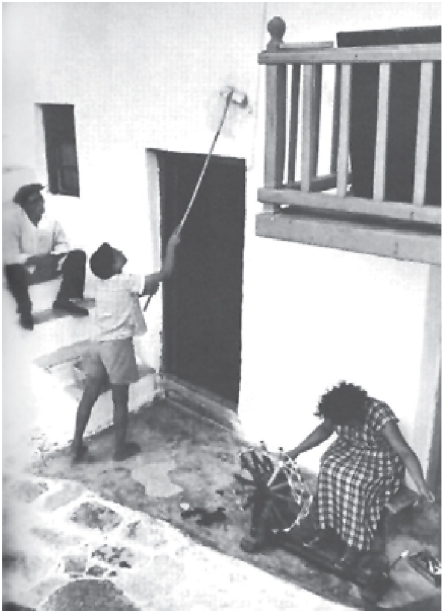
Η διαδικασία του ασβεστόματος γίνεται τρόπος ζωής και εντάσσεται στην καθημερινότητα των ανθρώπων. [από: Peter Buckley,